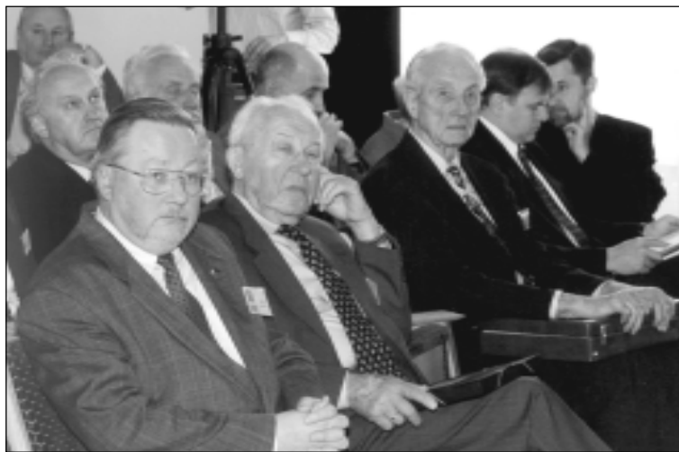
Prof. Vytautas Landsbergis ir kiti dalyviai XI pasaulio lietuvių mokslo ir kūrybos simpoziumo plenariniame posėdyje

Labai mėgo tikslumą, rašydamas bet kokio veiksmo ar dokumento tekstą jis siekdavo itin tikslios preciziškos formuluotės, nes gerai suvokė, ką politikoje reiškia