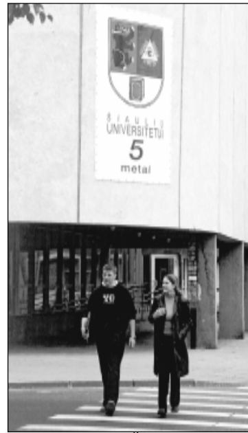
Šiaulių universitetas atšventė 5 metų sukaktį

Kitas svarbus argumentas, kėlęs komisijų abejones, buvo materialinė padėtis. Finansinis kriterijus taip pat buvo svarbus. Kad aukštoji mokykla pakiltų į naują lygmenį, reikia pinigų naujoms laboratorijoms, programoms, naujiems dėstytojams, profesūrai pritraukti. Tuo me-