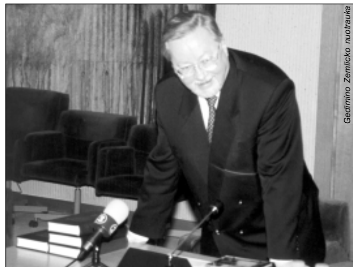
Prof. Vytautas Landsbergis

Sveikiname Lietuvos Respublikos Aukščiausiosios Tarybos-Atkuriamojo Seimo pirmininką, Lietuvos Nepriklausomos Valstybės Atstatymo Akto signatarą, Lietuvos mokslininkų sąjungos garbės pirmininką, profesorių Vytautą Landsbergį, garbingo septyniadešimties metų Jubiliejaus proga.