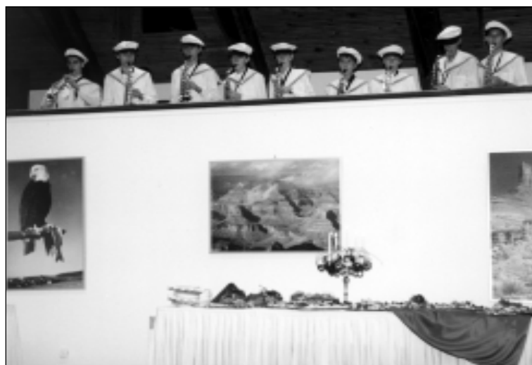
Saksofonistų grupės muzikantai atlieka Gleno Milerio kūrinius