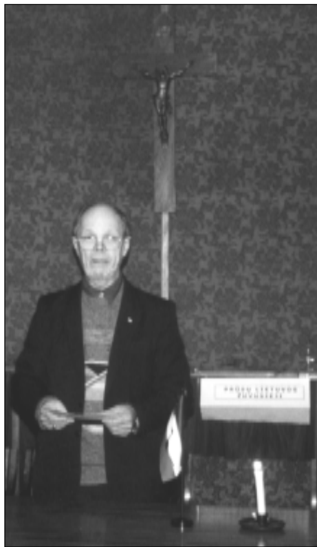
Viena tuščia kėdė skirta Prūsų Lietuvos žuvusiesiems

kietijos civilių gyventojų žuodynes, išsità čia gyvenusių žmonių genocidą. Žmogaus protui nesuvokiamos metamorfozės!