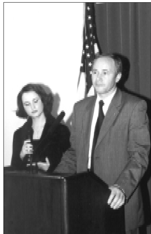
Labai aukštai programą įvertino Lietuvos švietimo ir mokslo ministras Algirdas Monkevičius