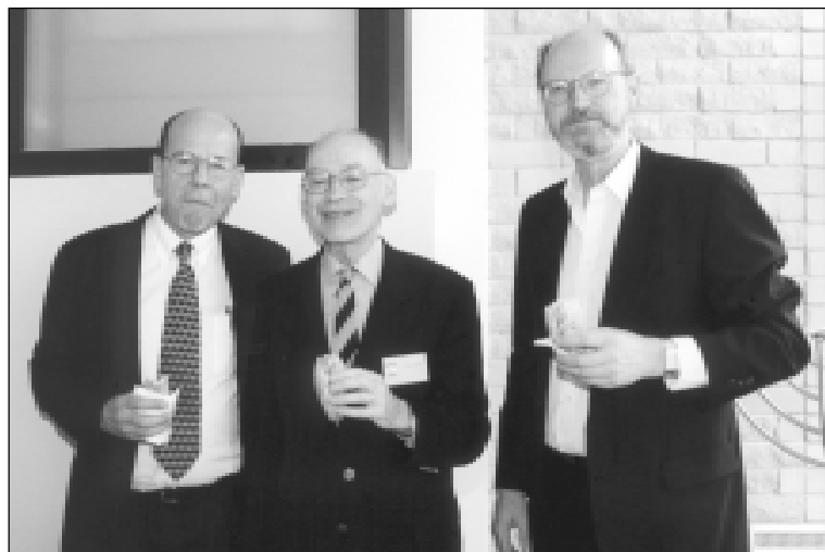
Prof. B. Sharpless, prof. H. Kagan ir prof. R. H. Grubbs su karaimiškais kibiniais rankose per kavos pertrauką