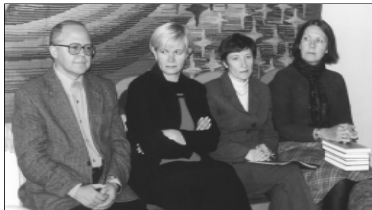
Visuotinės lietuvių enciklopedijos antras tomas jau skaitytojų rankose: enciklopedininkai laukia atsiliepimų

Reikia pripažinti, kad nors enciklopedininkai VLE 2 tome ir išsaugojo kietą stuburą, vis dėlto pasirodė besą pakankamai lankstūs. Išleisdamas 1 tomą buvo gauta įvairių organizacijų pasiūlymų ir pageidavimų, kaip reikėtų pagerinti kitų tomų informatyvumą, įtraukti naujasių žinių. Visų pirma tai pasakyta apie Lietuvos gyventojų genocido ir rezistencijos tyrimų centrą, Lietuvos kariuomenės karių, nukentėjusių nuo sovietinio ir nacistinio genocido, artimųjų sąjungą, Lietuvos vyskupų konferenciją, Lietuvos žydų bendruomenę, Nepriklausomybės Akto signatarų klubą, Pasaulio lietuvių bendruomenės atstovybę Lietuvoje, Valstybinį Vilniaus Gano žydų muziejų ir kitas organizacijas. Tą patį galima pasakyti apie Lietuvos centrinę valstybės archyvą, Lietuvos dailės muziejų, Lietuvos nacionalinę Martyno Mažvydo biblioteką, Lietuvos nacionalinį muziejų, Lietuvos nacionalinio