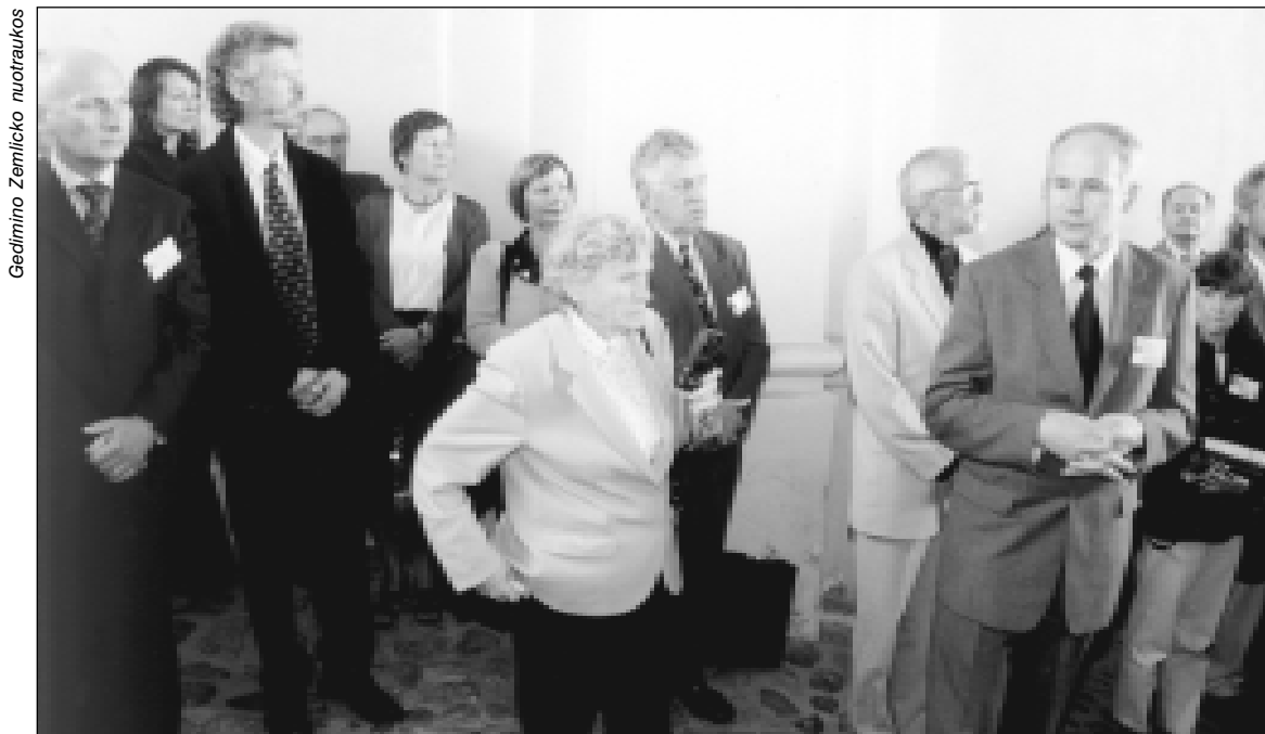
Ignotui Domeikai skirtosios parodos Lietuvos nacionaliniame muziejuje atidarymo akimirka

Dar 1842 m. siekdamas pakelti Čilės švietimo sistemą į naują pakopą I. Domeika rašė: meilė mokslui, pačioms studijoms, mokslo troškimas, noras padėti žmonijai turi vyravoti studentų, dėstytojų ir visos mokyklos bendruomenės narių galvose, o ne siekimas pinigų . Įdomu, ar būtų supastas mūsų didysis tėvynainis šiais laikais, ar netektų jam brangia kaina sumokėti už tokį savo idealizmą? Svarbiausia, kad pagal savo skelbiamus principus tas žmogus ir gyveno, ko gero, tuo smarkiai skyrėsi nuo asmenų,