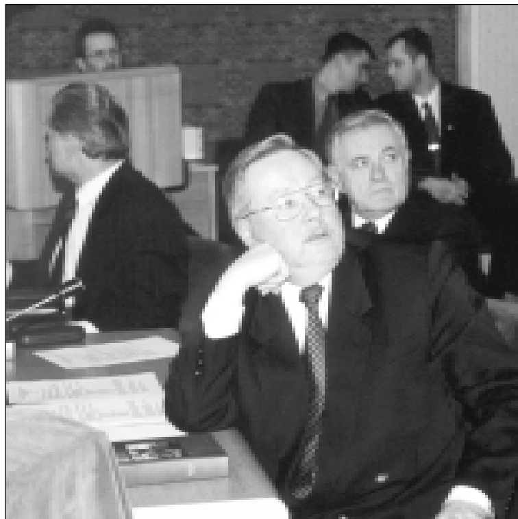
Prof. Vytautas Landsbergis ir Lietuvos Prezidentas Valdas Adamkus LR Seimo rūmuose