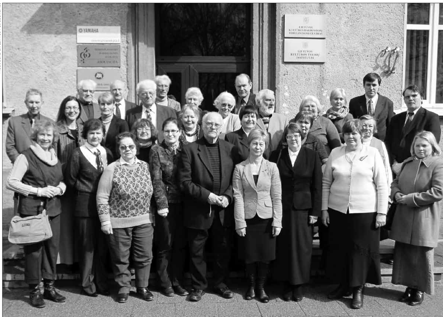
Lietuvos mokslo istorijos ir filosofijos konferencijos „Scientia et historia – 2012“ dalyvių nuotrauka

SPAUDOS, RADIJO IR TELEVIZIJOS RĖMIMO FONDAS