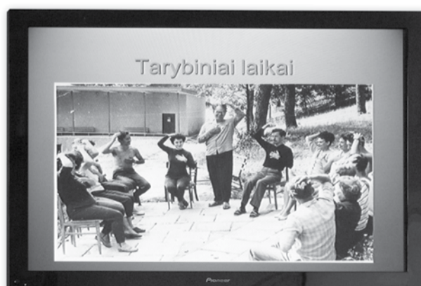
Druskininkų miesto muziejaus nuotraukose – Druskininkų kurorto praeitis