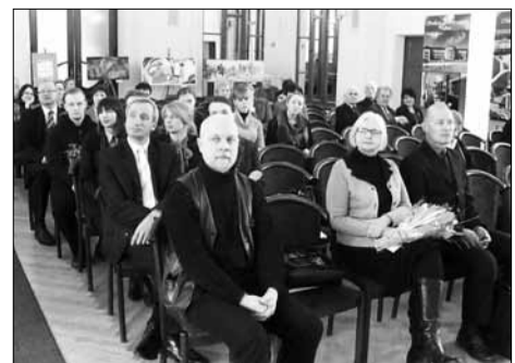
Druskininkų diena Lietuvos mokslų akademijoje

Kol Druskininkų savivaldybės tarybos nariai su mokslininkais diskutavo ir posėdžiavo, kurorto mokiniai turėjo progą aplankyti veiklos šimtmetį šiemet mininčią Lietuvos MA Vrublevskių biblioteką ir Vilniaus universiteto Lazerinių