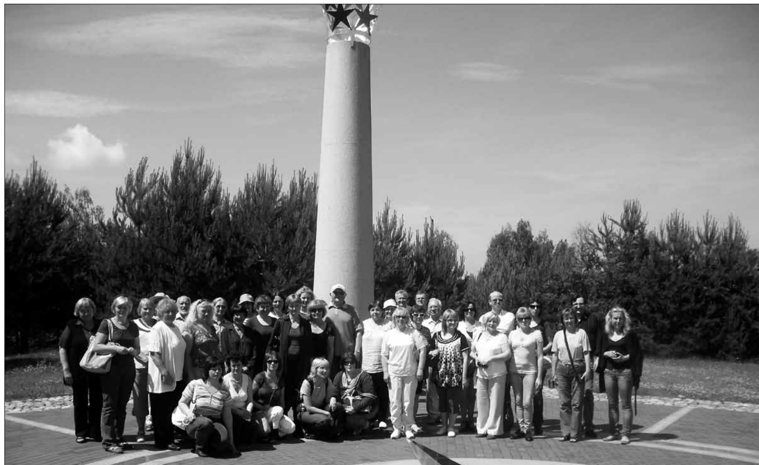
Mokslo ir enciklopedijų leidybos centro darbuotojai ekskursijoje prie Europos centro