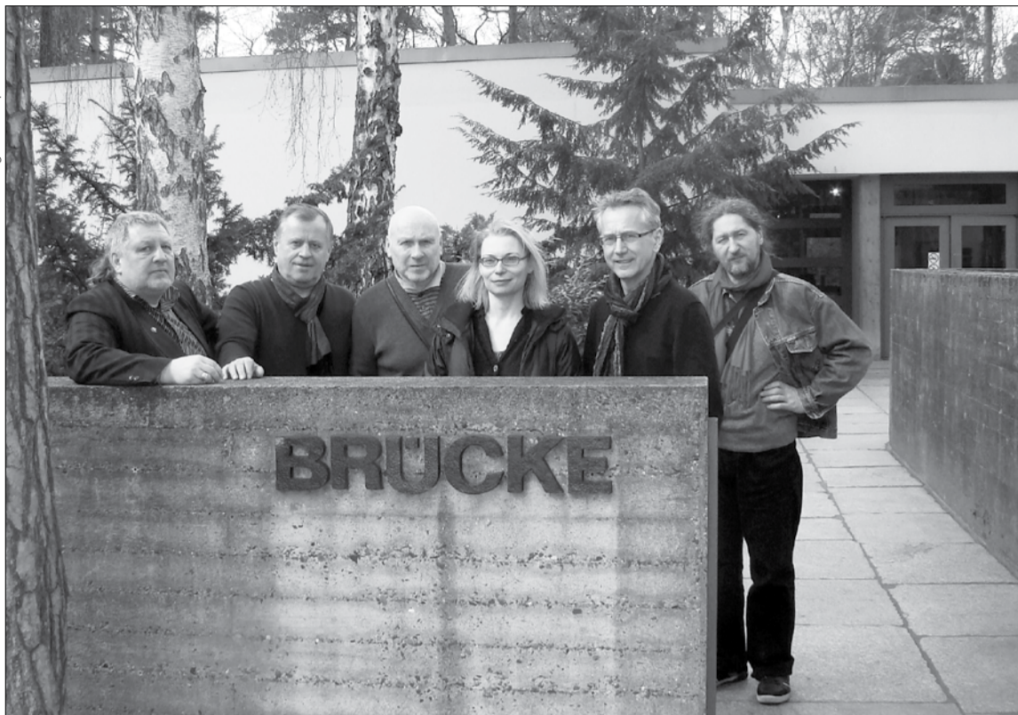
Lietuvos tapytojų delegacija Berlyne, prie BRÜCKE muziejaus (2011 m.)