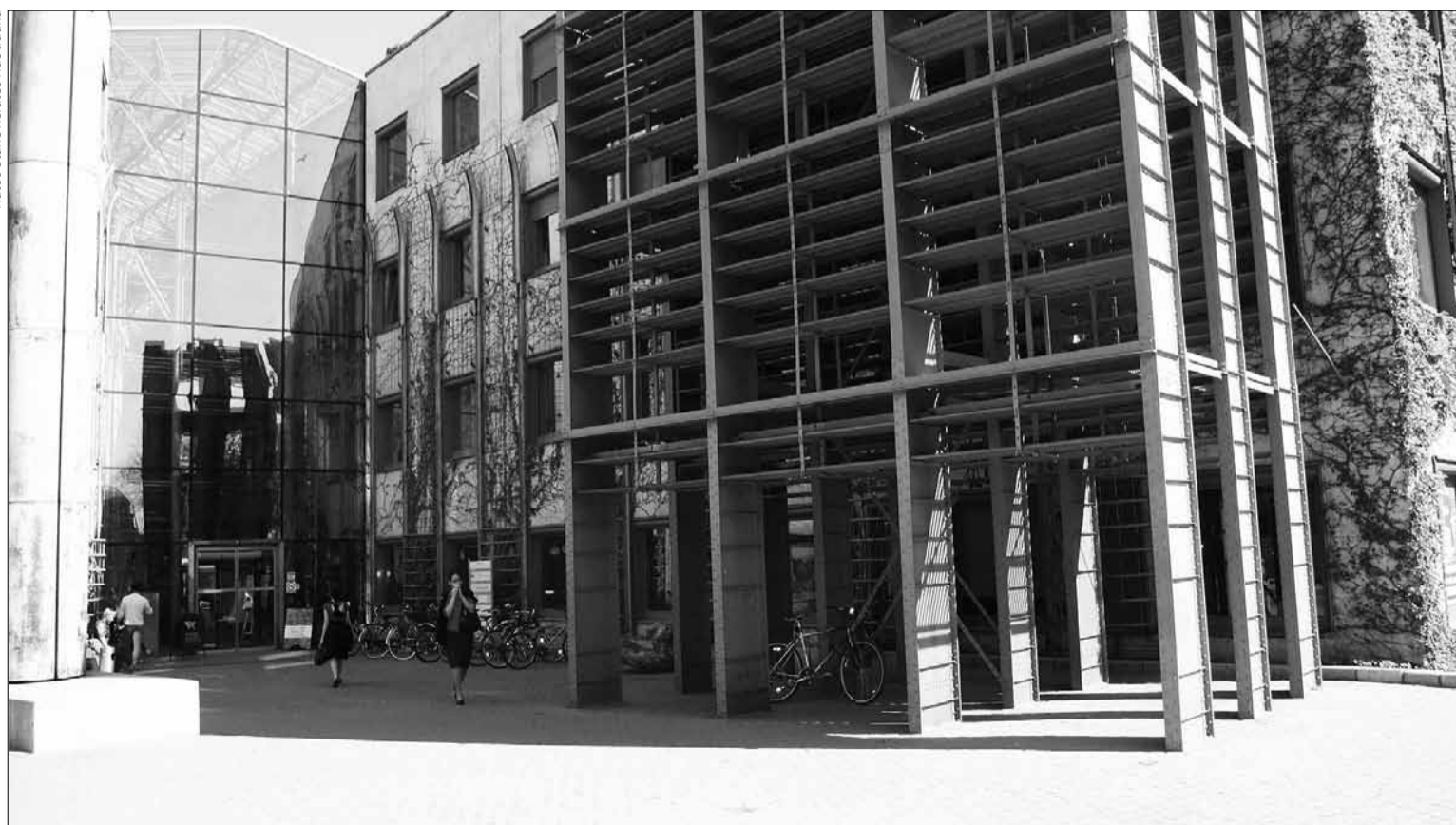
Varšuvos universiteto biblioteka

versiteto Muzikos kabinetui, Lenkijos kompozitorių sąjungai, Lenkijos muzikos leidyklai, Nacionaliniam radijui ir kitoms institucijoms, kaimyninėje šalyje vykdomi reikšmingi kritinių šaltinių tyrimų, registrų rengimo, leidybos ir skaitmenizavimo projektai, populiarinimo darbai (parodos, televizijos ir radijo laidos, filmai). Lygindama su mokslinių tyrimų galimybėmis panašiose institucijose Lietuvoje, būvau maloniai nustebinta keliolika kartų mažesniais dokumentų kopijavimo ir skenavimo įkainiais. Muzikos informacijos centras visas paslaugas teikia nemokamai, laikydamas tai indėliu į nacionalinės muzikos populiarinimą. Nors kultūrinės raiškos skaitmenizavimo baruose mūsų šalies specialistai kai kuriose srityse, pvz., spaudos skaitmenizavimo, kolegas gerokai pralenkę, muzikinio paveldo kaupimo ir sklaidos srityse dar daug ko galėtume pasimokyti. Dėmesio mokslui ir jo nacionalinės svarbos liudijimu buvo nuolat kupina iki vėlumos veikianti Varšuvos universiteto biblioteka. Vienas įdomesnių naujų Lenkijos sostinės statinių, simbolizuojantis atverstas knygas, – neabejotinas traukos centras ir kultūros židinys. Čia sudarytos itin palankios, naujomis technologijomis grindžiamos sąlygos ir studijuojančiam jaunimui, ir vietiniams bei iš svetur atvykusiems mokslininkams. Kolegų atvirumas skatina tikėtis, kad ateityje kartu imsime ir bendrą projektų muzikinio paveldo srityje.