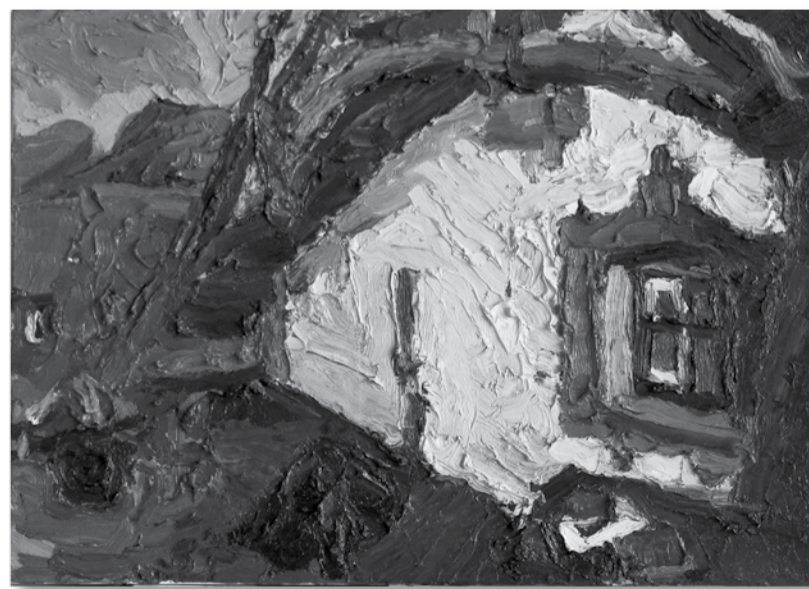
Solomonas Teitelbaumas. Nida. Vila Helene (Veranda) (2002)