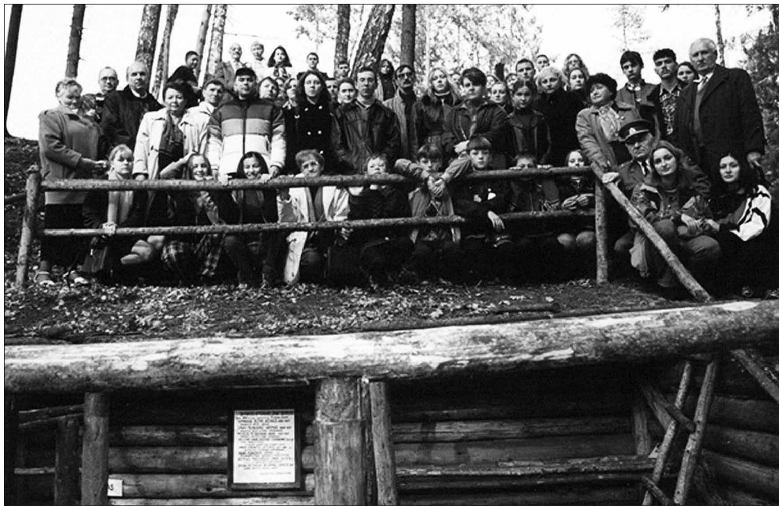
Jaunimas prie atstatytos Dainavos apygardos vadavietės Punios šile