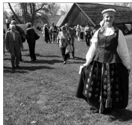
Aš dainuoju liaudies muzikos ansamblyje „Kankleliai“