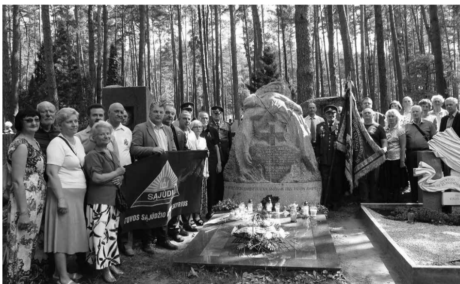
Minėjimo dalyviai prie K. Škirpos ir jo žmonos kapo.