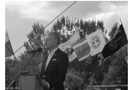
Lietuvos Prezidentas Gitanas Nausėda politinių kalinių ir tremtinių sąskrydyje Ariogaloje (Raseinių r.).