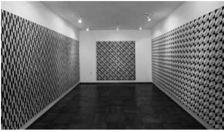
Ekspozicija Kazio Varnelio namai-muziejus.