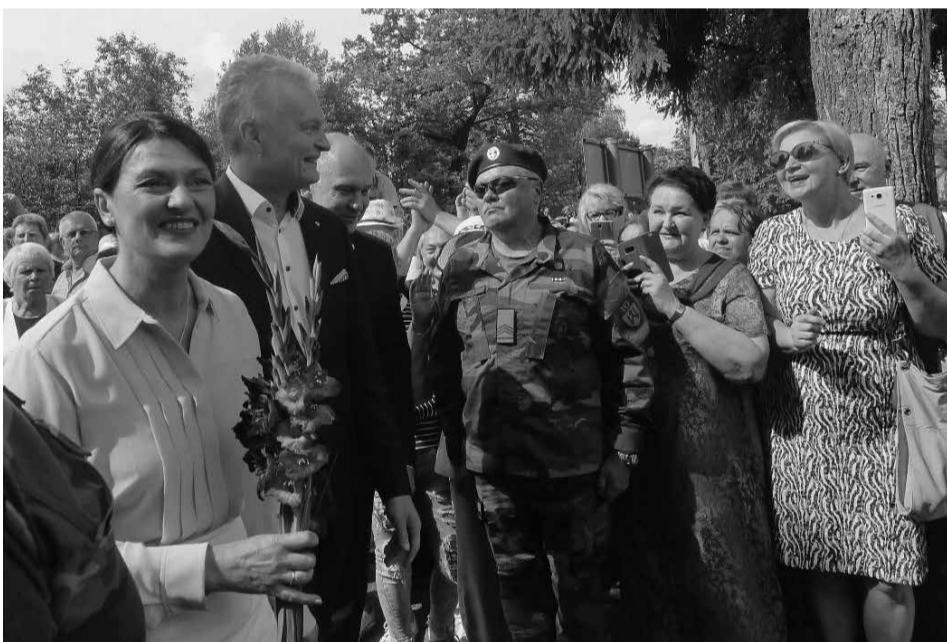
Lietuvos Respublikos Prezidentas prof. Gitanas Nausėda ir pirmoji ponija tarp šventės dalyvių

Rugpjūčio 10 d., Užugirio dvare (Ukmergės raj., Taujėnų seniūnijoje) švenčiant pirmojo Lietuvos Prezidento, Vasario 16-osios akto signataro Antano Smetonos 145-ąsias gimimo metines – Smetonines ir šimtmečio sukaktį, kai