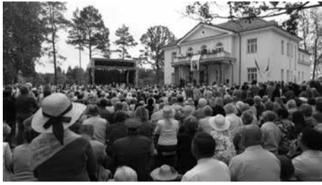
Tiek svečių Antano Smetonos gimtinėje seniai nebuvo