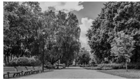
Vilniaus parkai.