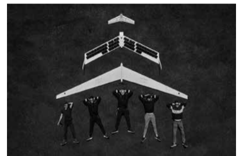
Bepiločio orlaivio „Solarwing v2“ prototipas.

Skraidantis sparno tipo bepilotis orlaivis