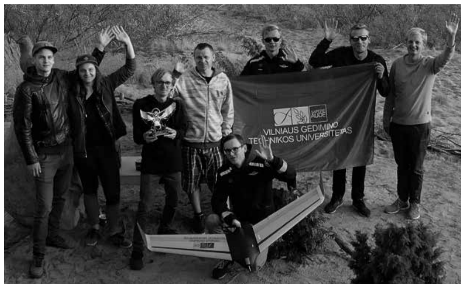
VGTU Antano Gustaičio aviacijos instituto komanda.

VGTU AGAI komandos prioritetą buvo saugumas. Norint skraidinti droną,