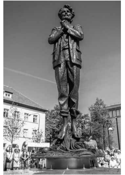
Paminklas Vydūnui.