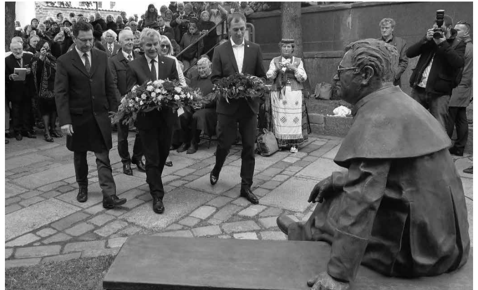
Gėles prie paminklo neša LR Seimo pirmininkas prof. dr. Viktoras Pranckietis