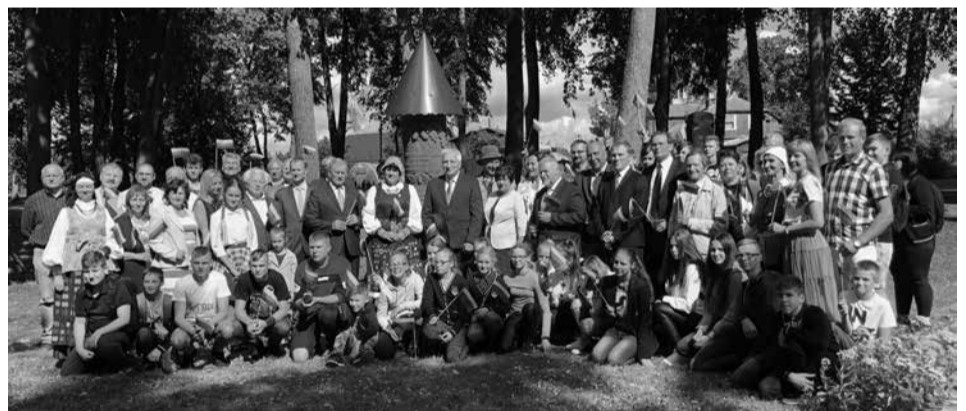
Šventės dalyviai prie kopyltstulpio.