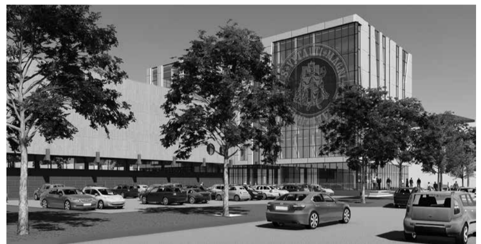
Naujojo VDU Pedagogų rengimo centro projektas

VDU siekia komercializuoti mokslinius tyrimus. Laboratorijos, planuojama įsigyti