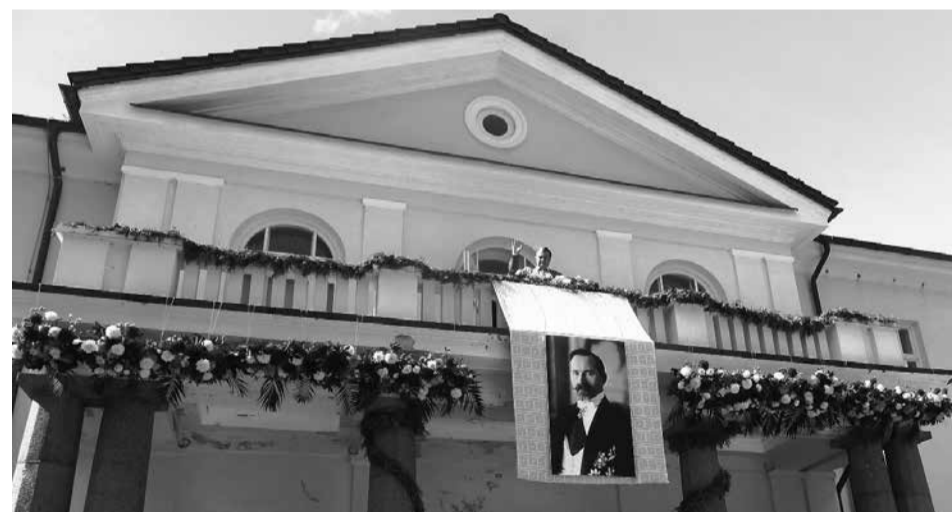
Šventiška išpuošta Užugirio mokykla pirmojo Lietuvos Prezidento tėviškėje

1920–1926 m. A. Smetona redagavo „Lietuvos balsą“, „Lietuvių balsą“, „Tėvynės balsą“, „Krašto balsą“, „Vairą“, „Tautos vairą“.