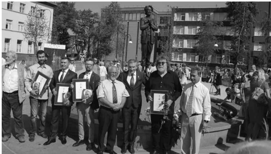
Renginyje pagerbti paminklo kūrimo rėmėjai