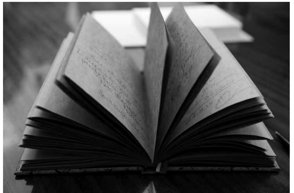
Vienintelis rankraštis knygos „Linkėjimai šimtmečiui. Autografų kolekcija“ egzempliorius

Yra ir konkrečių pageidavimų, rodančių, kad lankytojai susipažinę su geriausia šiuolaikinės ekspozicijų kūrimo praktika: „Norėtųsi patraukliai pateiktos informacijos apie reikšmingiausias Lietuvos knygas, padariusias svarbius posūkius šalies politi-