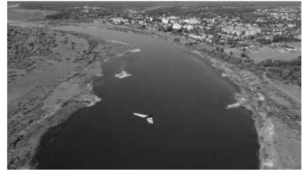
Skrydis per Lietuvą

Šis skrydis – tikrai ne paskutinis. Grįždama iš kelionės, VGTU komanda jau planavo,