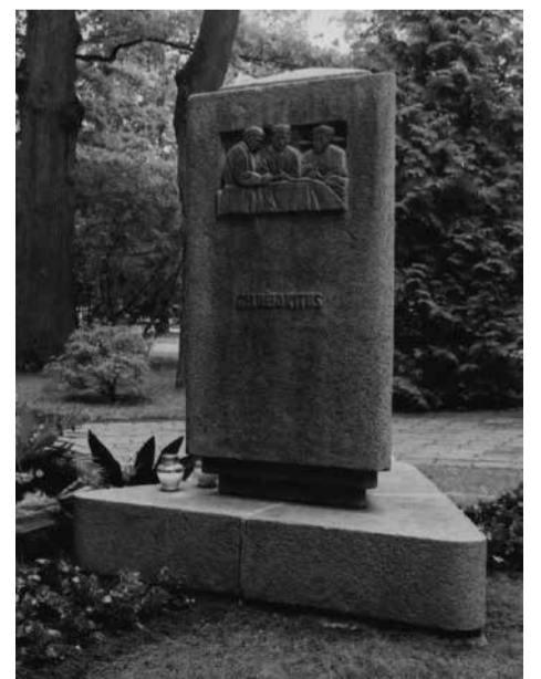
Paminklas sovietinių budelių nužudytiems Panevėžio medikams