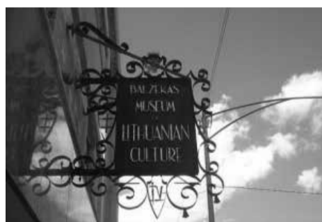
Rodyklė į Balzeko lietuvių kultūros muziejų Čikagoje