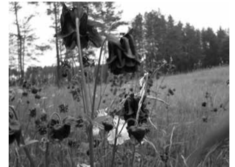
Vasaros gėlės Dzūkijoje.

„QS“ reitingą iš viso sudaro šeši vertinimo kriterijai: akademinė reputacija, darbdavių vertinimai, darbų citavimas, studentų skaičius bei darbuotojai ir studentai iš užsienio. Bendrame „QS“ reitinge VDU išsaugojo tą pačią poziciją, kaip ir praėjusiais metais – 801+. Iš viso buvo įvertinta 1,6 tūkst. geriausių pasaulio universitetų. ■