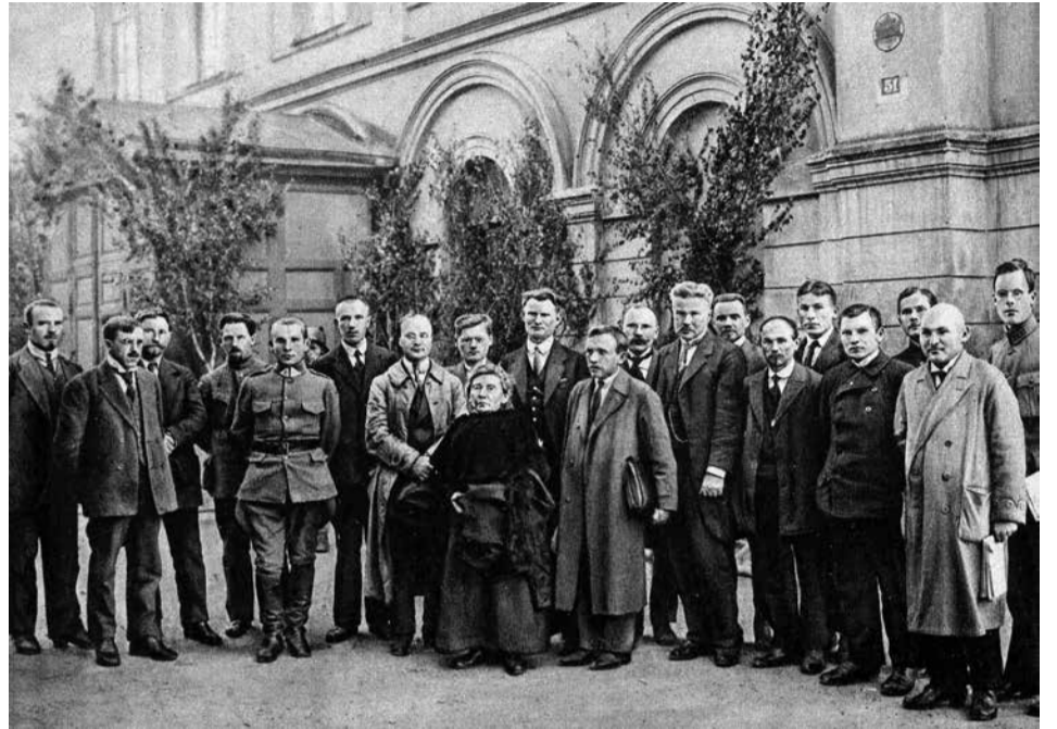
Steigiamojo Seimo nariai – Liaudininkų frakcija

Prie žurnalo atsiradimo ir jo išlaikymo vienaip ar kitaip prisidėjo daugelis čia paminėtų asmenų. Vieni padėjo jį įsteigti, kiti rėmė finansiškai, dalinosi medicinos praktikos ir mokslo naujienomis. Šio žurnalo prasmė Lietuvos medicinai ir krašto istorijai dar nėra tinkamai įvertinta, nors jame, kaip veidrodyje, atsispindi sveikatos apsaugos situacija ir lietuviškojo medicinos mokslo raida.