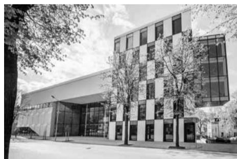
Vytauto Didžiojo universitetas.

Birželio 10 d. paskelbtame naujausiame pasaulio universitetų reitinge „QS World University Rankings“ Vytauto Didžiojo universitetas (VDU) pagerino pozicijas keturiuose kategorijose iš šešių ir buvo vienas iš trijų Baltijos šalių universitetų, šiais metais kilusių tarptautiniuose reitinguose. Geriausiai įvertintu VDU rodikliu ir toliau išlieka jo tarptautiškumas. Tarptautinių darbuotojų kategorijoje QS universitetui skyrė 492-tąją vietą pasaulyje – net 91 vieta aukščiau nei pernai. Ryškus kilimas užfiksuotas ir tarptautinių studentų kategorijoje – čia VDU pakilo per 111 pozicijų iki 560 vietos. VDU pavyko pagerinti vertinimus ir kitose srityse – tiek pagal darbdavių vertinimus apie universitetą baigusiujų potencialą, tiek pagal mokslininkų nuomonę apie tyrimų