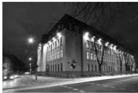
Šiaulių universiteto biblioteka

5. 1996 m. vasario 23 d. Lietuvos mokslininkų sąjungos „Salduvės“ sky-