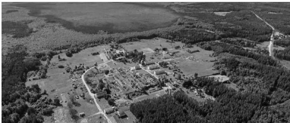
Eičių gyvenvietė – iš paukščio skrydžio.

– Sulaukia. Ir tai ypač džiugina. Tauragėje jauni šeimai įsigyti butą kainuotų apie 30 tūkst. eurų, o pas mus tokį patį galima nusipirkti už 5–10 tūkst. eurų. Sąlygos čia gyventi yra kurortinės. Tuo jau įtikinome ir kelias jaunas savo giminaičių ir bičiulių poras. Sulaukėme ir garbaus amžiaus sutuoktinių šeimos. Ji įsigijo butą Eičiuose. Žmonės atvažiuoja ir pamato, kad čia gyventi patogiu, saugu ir gražu. ■