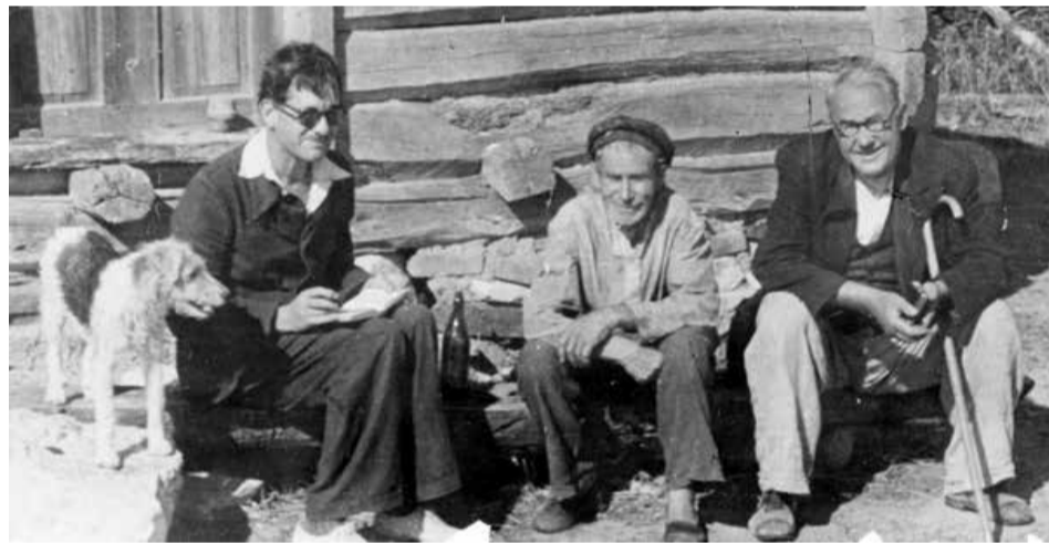
Susitikimas su vietiniais žmonėmis

Džangaloje apsistojome vietos gyventojų namuose. Aš juose nelabai norėjau apsistoti, nes tikrai maniau, kad troboje, ypačiai kai langai uždarinėti, bus nelengva gyventi. Tačiau mus prigąsdino tarantulomis, falangomis ( voragyviais – L.P. ), kurie, esą, lauke