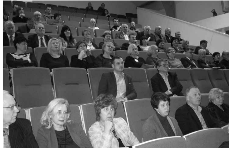
Žemaitijos inovacijų centro steigimo konferencijos Rietave dalyviai

Ką tik sužinojome, kad šių metų pradžioje Rietave įvykusios konferencijos metu Lietuvos mokslininkų sąjungos kartu su partneriais įkurtas pirmasis Lietuvoje regioninės plėtros padalinys – Žemaitijos inovacijų centras liko be patalpų. Rugsėjo 10 d. įvykusiame Rietavo savivaldybės tarybos posėdyje tarybos nariai atmetė