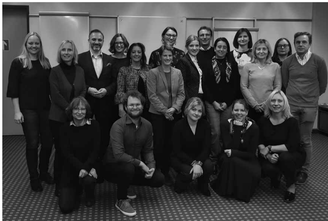
Tarptautinio universitetų tinklo narių susitikimas.

universitetų iniciatyva suteiks galimybių daug glaudžiau ir intensyviau bendradarbiauti: bus sukurtos bendros infrastruktūros, dalinamasi esamais išteklių, vykdoma daugiau ir aukštesnės kokybės jungtinio laipsnio programų bei bendrų mokslo tyrimų „Šiuo projektu siekiama atsigręžti į regiono bendruomenę, kultūrą, menus, verslą ir kurti aplinką, palankią prasingoms iniciatyvoms“, – teigia Vytauto Didžiojo universiteto