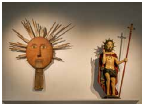
Parodos apie Velykų tradicijas eksponatai

E. Lazauskaitė: Velykų laikotarpio tradicijoje glaudžiai persipynę senojo tikėjimo ir krikščioniškieji papročiai. Didžiosios savaitės visos dienos įprasminamos iš kartos į kartą perduodamais papročiais, apeigomis, draudimais, spėjimais, magiškais veiksmais. Namų švarinimas, ugnies ir vandens šventinimas, budėjimas prie simbolinio „Kristaus kapo“ bažnyčioje, valgių ruošimas, jų pašventinimas ir pagaliau džiaugsmingas Velykų rytas, skambant bažnyčių varpams. Visa tai suburia žmones bendram laukimui. Bendruomeniškumo puoselėjimas Vely-