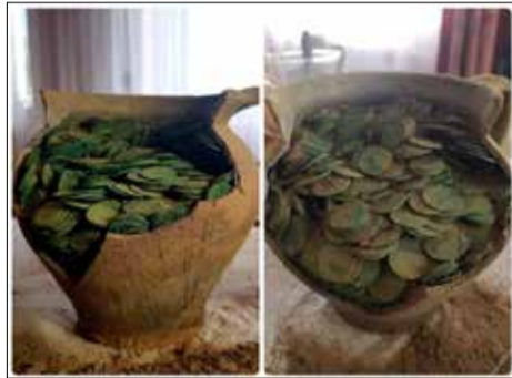
Lenkijoje rastas Vilniuje nukaltų monetų lobis.

Tyrimai parodė, kad dauguma monetų nukaldintos 1663–1666 m. Varšuvos, Vilniaus (Lietuva) ir Bresto, kuris dabar yra Baltarusijoje, bet tuo metu priklausė Lenkijos ir Lietuvos Respublikai, monetų kalyklose.