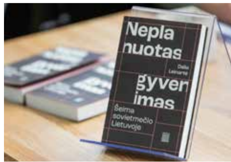
Knyga „Neplanuotas gyvenimas“