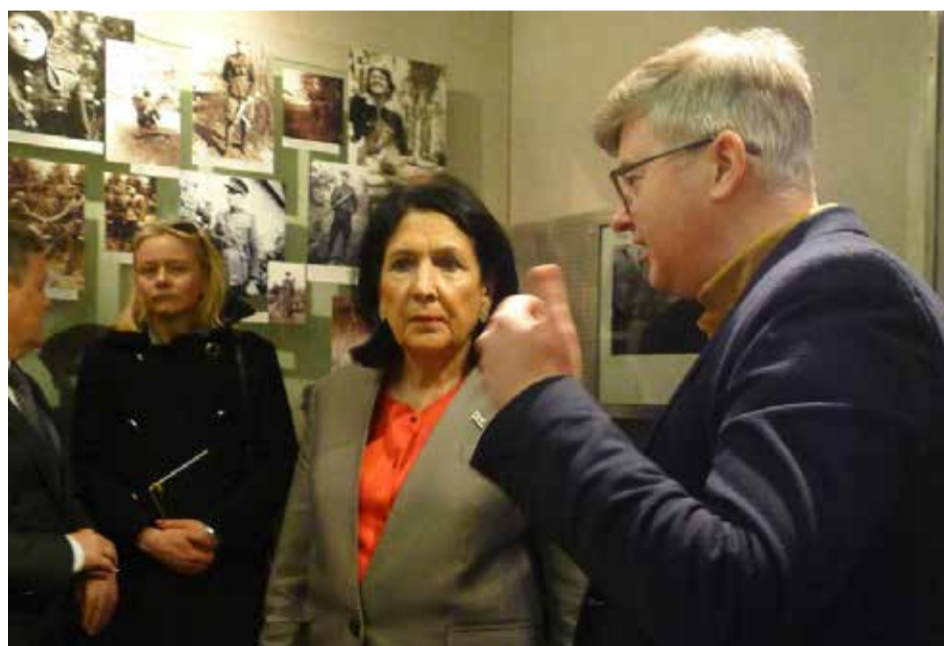
Sakartvelo prezidentė Okupacijų ir laisvės kovų muziejuje

2018 m. pirmąją į Sakartvelo prezidento postą išrinkta moterimi tapusi S. Zourabichvili yra buvusi prancūzų diplomatė, turinti daugiau nei penkiasdešimt metų diplomatinės veiklos patirtį. Ji gimė Prancūzijoje, pabėgėlių iš Sakartvelo šeimoje. ■