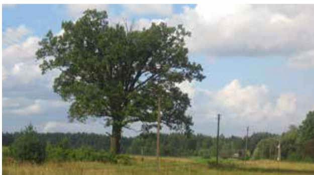
Ažuolas išnykusios ūkininko sodybos vietoje.

Ar kas kada nors paragaus Išmirusių bičių medaus?