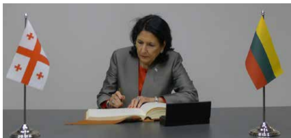
Sakartvelo prezidentė paliečia įrašą svečių knygoje.