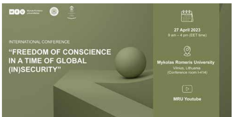
Kvietimas į konferenciją.

Tarptautinę konferenciją rengia MRU Teisės mokykla kartu su partneriais iš Indonezijos: Airlangga universiteto Teisės fakultetu ir Indonezijos universiteto Teisės fakultetu. Konferenciją iš dalies finansuoja