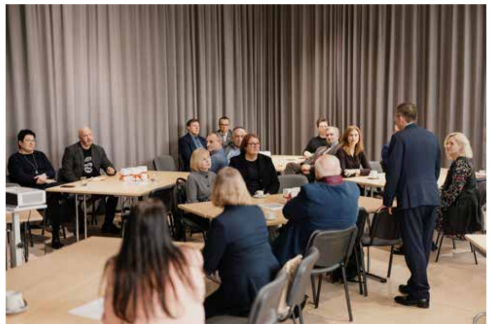
Susitikimas su MRU alumnais Panevėžyje

universiteto pasiekimus, kvietė alumnus ir toliau būti aktyvia universiteto bendruomenės dalimi.