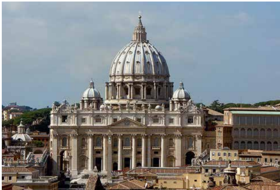
Šventojo Petro Bazilika Vatikane

Draudimas taip pat apima ir anglų kalbos vartojimą oficialiuose dokumentuose, todėl užsienio bendrovės būtų priverstos pateikti dokumentus, pavyzdžiui, vidaus taisyklių ir darbo sutarčių versijas, italų kalba. Net įmonės, kuriose dirba ir itališkai nekalbantys darbuotojai, vis tiek pirmiausia turėtų