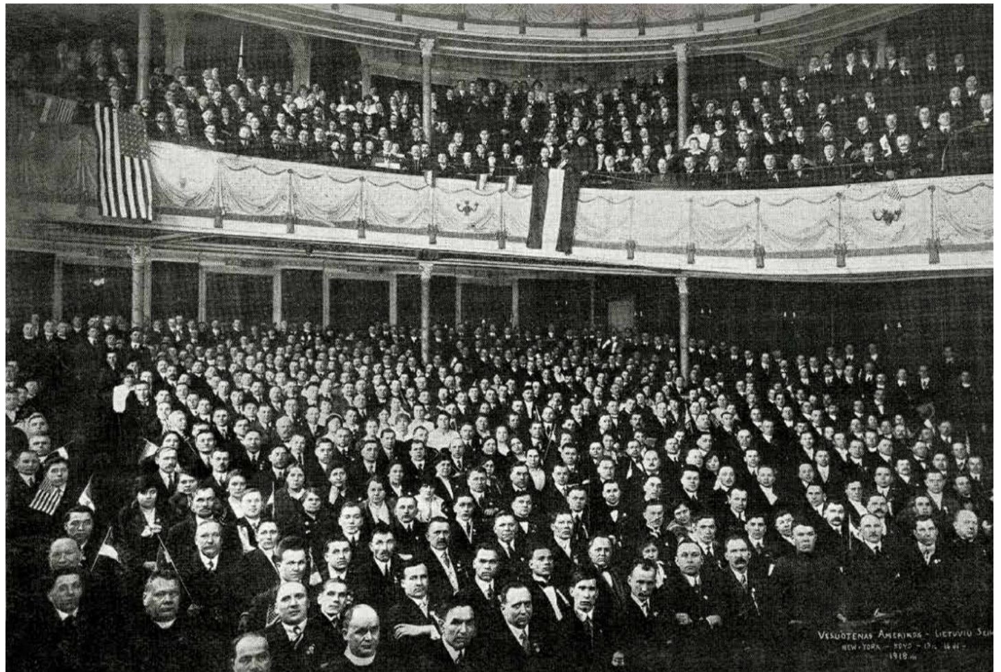
Seimo salė. Gineitis, K. „Amerika ir Amerikos lietuvių“. Kaunas, 1925, p. 86

Tačiau į Niujorką sutiko atvykti tik katalikų ir tautininkų delegatai. Socialistai atsisakė ir savo spaudoje pradėjo griežtai kritikuoti Seimą bei raginti kitus jame nedalyvauti. Kodėl? Socialistai laikėsi internacionalizmo dvasios – jiems buvo svarbesni JAV lietuvių darbininkų glaudūs ryšiai su kitų tautų bei šalių darbininkais ir jų kova su vadinamąja buržuazija. Šio judėjimo atstovai pasisakė už „laisvą Lietuvą, surištą federacijos ryšiais su proletarine Rusijos valstybe“. Taip pat jie pasisakė prieš katalikų ir tautininkų siekimą, kaip socialistai įvardijo, „buržuazijos valdomą Lietuvą“. Todėl JAV lietuvių socialistai atsisakė dalyvauti Seime. Kitų srovių spaudoje toks socialistų atsisakymas buvo įvertintas kaip „joks praradimas išėivijai“, nes kairieji nebuvo Lietuvos nepriklausomybės šalininkais. Taigi, katalikai ir tautininkai vieni pradėjo rinkti savo delegatus į Seimą.