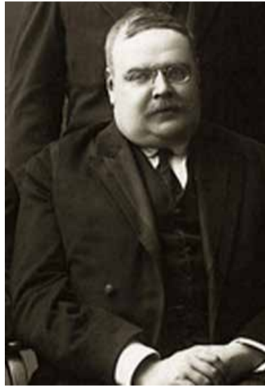
Profesorius Mykolas Romeris