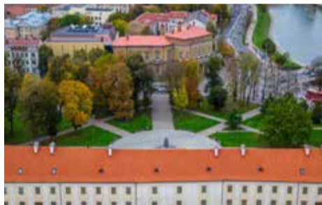
Šalia Karaliaus Mindaugo paminklo įsikurs paviljonas apie Vilnių.