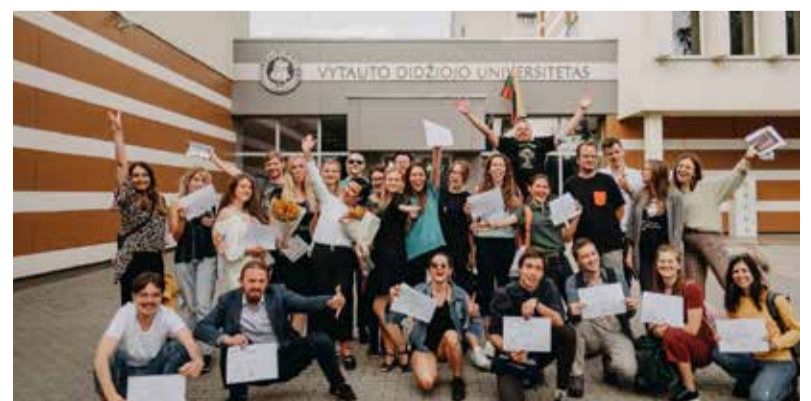
Lietuvių kalbos kursų dalyviai.