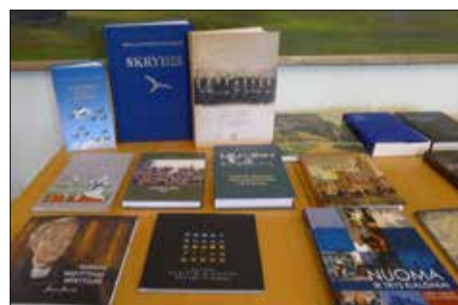
Knygos mėgėjų draugijos leidinių paroda