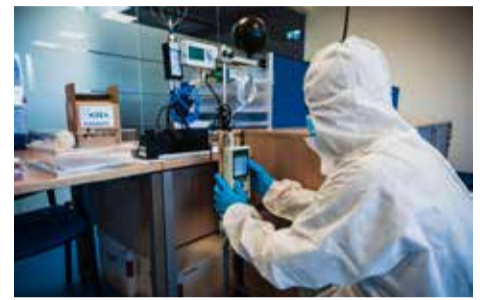
Energijos naudojimo matavimai.

V. Motuzienė teigia, kad universiteto mokslininkų atlikta ilgalaikė 6 adminis-