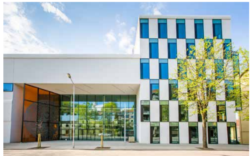
Vytauto Didžiojo universitetas

tautiškumo srityje: universitetas užėmė 1 vietą pagal magistrantų užsieniečių santykį su visais magistrantūros studentais (14,1 proc.) ir 3 vietą pagal bakalauro studijų