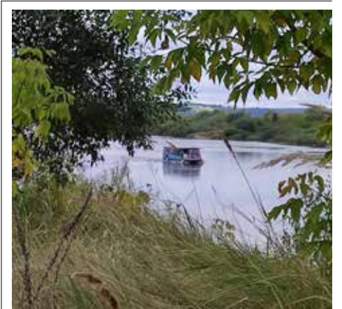
Nemunas ties Raudondvariu.