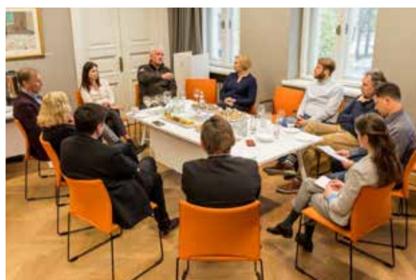
Pasaulio lietuvių universiteto 10-mečio aptarimas