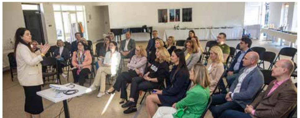
Susitikimas su MRU alumnais Palangoje.