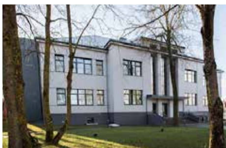
„Aušros“ muziejus Šiauliuose (Venclauskių namai)

„Aušros“ muziejaus priklausymo LMA rezultatas – dalies dokumentų, spaudinių, knygų išgabenimas iš Šiaulių į Vilnių. Dar pakankamai nesustiprėjusi akademija, pasitaikius pirmam progai, šio muziejaus atsikratė. 1942 m. vasario 1 d. „Aušros“ muziejus perduotas Švietimo valdybos aukštojo mokslo departamentui, jam buvo sugrąžinta provincijos kraštotyros muziejaus padėtis, tačiau sumažinti etatai ir subsidijos. Hitlerininkų valdžia nesikišo į muziejaus darbą