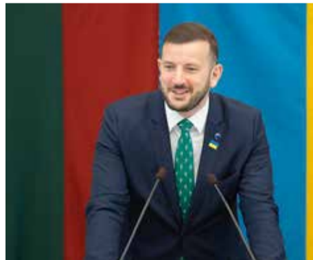
Europos Komisijos narys Virginijus Sinkevičius