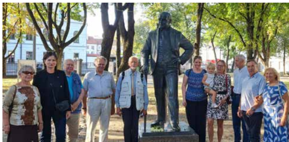
Prie Aleksandro Stulginskio kapo

Aleksandras Stulginskis gimė 1885 m. Kutaliuose, nedidelio ūkelio savininkų šeimoje. Jis buvo dvyliktasis vaikas šeimoje. Nuo pat jaunų dienų būsimasis Prezidentas atkakliai siekė mokslo. Iš pradžių mokėsi Kaltinėnų mokykloje, toliau – Liepojos gimnazijoje. Baigęs gimnazijos penkias klases, įstojo į Žemaičių kunigų seminariją. Baigęs ją, būdamas sąžiningas absolventas paprašė seminarijos vadovybės, kad ši atidėtų kunigo šventimus ir leistų dar kartą pasiti-