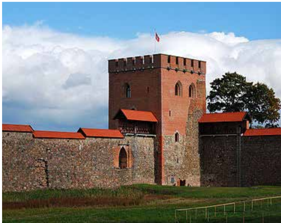
Restauruota Medininkų pilies dalis

Medininkų pilis laikoma seniausiu pilies tipu Baltijos regione. Manoma, kad ji buvo pastatyta XIII a. Ši pilis, minima nuo 1311–1313 m., atliko gynybinę funkciją – išorės priešui atremti. Didžiausią reikšmę pilis