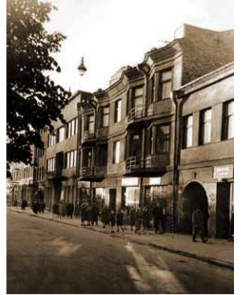
Kaunas. Laisvės alėja.