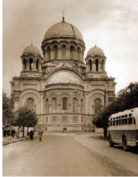
Kaunas. Laisvės alėja. Soboras.