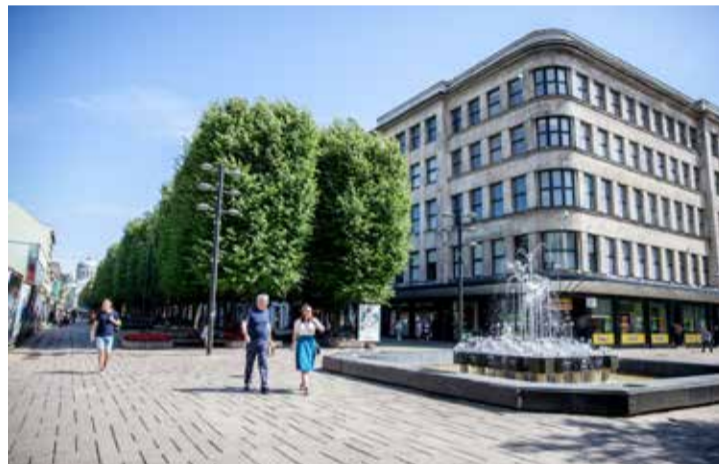
Kaunas. „Pieno centro rūmai“.