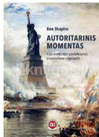
Naujos knygos viršelis