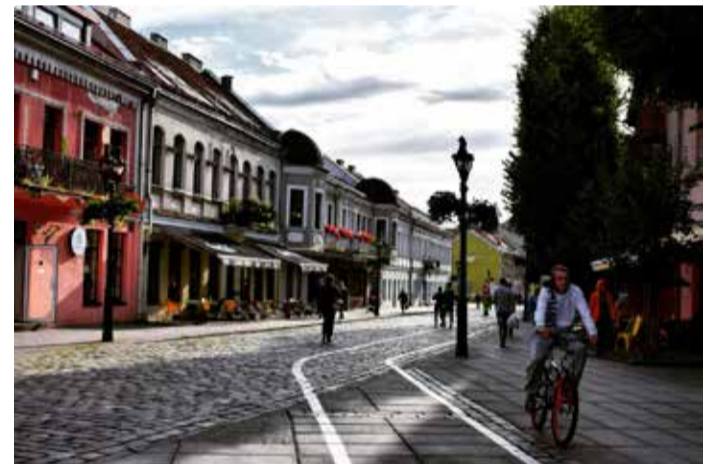
Kauno architektūra.

Žvelgiant iš paveldosauginės galimybės, kultūros paveldas turi būti saugomas viešajai pagarbai, moksliniam pažinimui bei viešajam pažinimui ir naudojimui. Ir tikrai norisi tikėti, kad nominacinės paraiškos autoriai ir kiti savo sričių žinovai padarys viską, kiek jiems leidžia galimybės, kad šis unikalus paveldas būtų prieinamas kuo didesnei lankytojų grupei. Bet yra vienas BET: XX