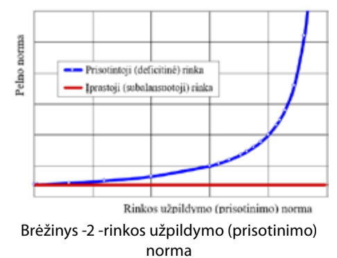
Brėžinys -2- rinkos užpildymo (prisotinimo) norma

sampratą. Laisvoji rinka, kur pasiūla apytiksliai lygi paklausai ( S \approx D ), tiktų laikyti subalansuotą ir susireguliuojančią rinką. Tačiau išskyla problema, kad tokia rinka yra žemo efektyvumo, daug kas ją laiko stagnuojančia. Tuo tarpu deficitinė rinka yra sparčiai auganti, bet nestabili ir turi būti valdoma, todėl ją priskirti laisvųjų rinkų kategorijai būtų nelogiška.