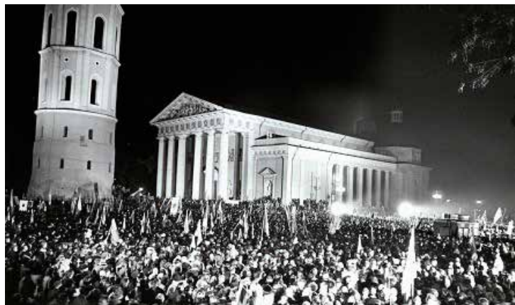
Katedros aikštė 1988 m. spalio 23 d.