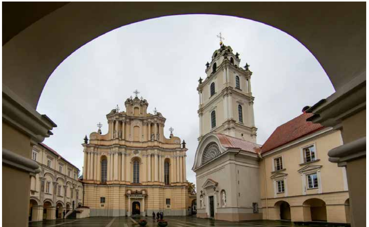
Šv. Jonų bažnyčia – Vilniuje.