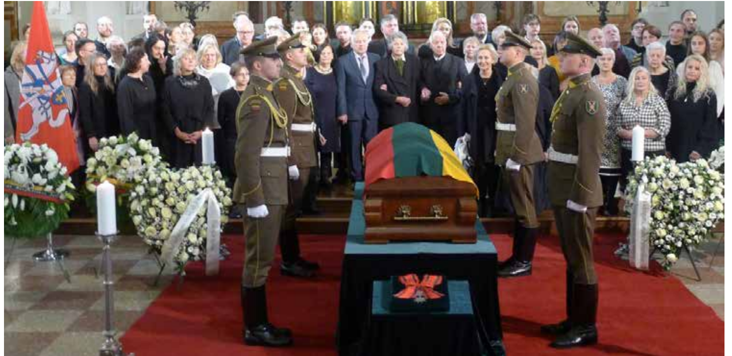
Atsisveikinimas su J. Vitkumi-Kazimieraičiu

1947 m. Dainavos apygardos partizanų vadų nutarimu Merkio partizanų rinktinė buvo pavadinta Kazimieraičio vardu. Vieninteliame partizanų suvažiavime 1949 m. Lietuvos laisvės kovos sąjūdžio prezidento sprendimu už ypatingus nuopelnus J. Vitkui-Kazimieraičiui po mirties suteiktas aukščiausias kovinis žymuo – Laisvės kovotojo karžygio vardas, jis apdovanotas aukščiausiu partizaniniu apdovanojimu – I laipsnio Laisvės kovų kryžiumi (su kardais). 1997 m. Prezidento dekretu J. Vitkus-Kazimieraitis apdovanotas Vyčio Kryžiaus I laipsnio ordinu. Jo vardu pavadinta Lietuvos kariuomenės inžinerijos batalionas, progimnazija gimtajame Tirkšlių miestelyje, gatvės Vilniuje, Kaune, Varėnoje. ■