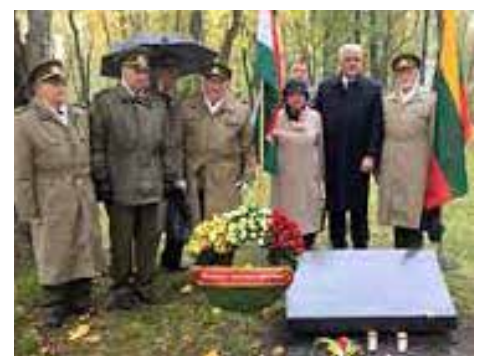
Prie A. Stulginskio kapo Kaune, Panemunės kapinėse

Mokslo Lietuvos“ 17-ajame numeryje neteisingai įvardintas prie straipsnio „PRISIMINĖME PREZIDENTĄ ALEKSANDRĄ STULGINSKĮ“ pridėtos nuotraukos pavadinimas „Prie A. Stulginskio kapo“. Tikrasis nuotraukos pavadinimas – „Minėjimo dalyviai šalia A. Stulginskio paminklo prie istorinės prezidentūros“. Pridedame minėjimo dalyvių nuotrauką prie Prezidento A. Stulginskio kapo Panemunės kapinėse. Atsiprašome už klaidą. „ML“ redakcija ■