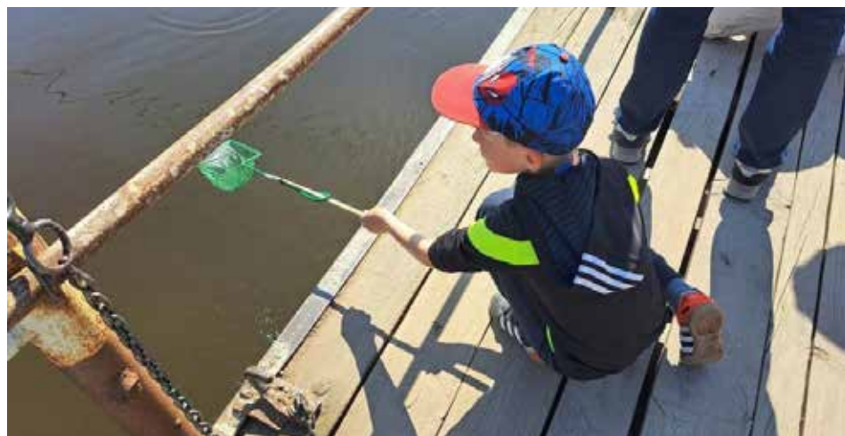
Susipažinimas su vandens pasauliu. Asoc. nuotr.

Pusšimtis naujų šios programos dalyvių grupių gaus specialiai išleista mokomąją medžiagą. Jie taip pat turės galimybę dalyvauti pažintiniame edukaciniame renginyje ir pažintinėje pamokoje apie akvakultūros sektorių, Lietuvos akvakultūros ūkiuose išau-