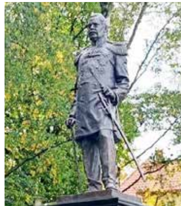
Paminklas M. Muravjovui Karaliaučiuje (rus. – Kaliningrade)

Paminklo atidengimo dieną teigta, kad Muravjovas – valstybės ir karo veikėjas. Jis davęs rusiškumo sustiprinimo pradžią (ma-