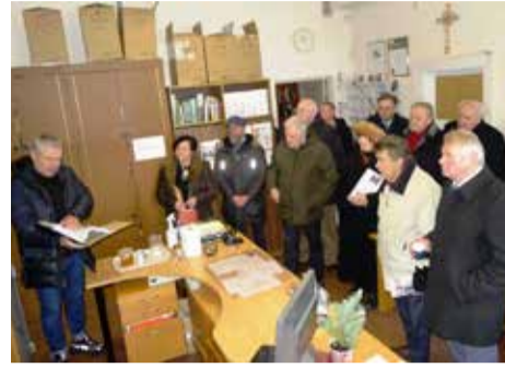
XXVII knygos mėgėjų draugijos nariai pažintinėje ekskursijoje po „Versmės“ leidyklą

liaudies išmintį, bažnyčias, įžymius žmones, tarmių ir vietos šnektų ypatumus, tautosaką, tautines mažumas ir pan.