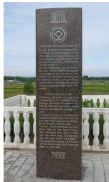
Struvės laiko ženklas, Paliepiukai, Vilniaus r., Nemėžio sen.

Įvykdžius XVI a. valakų reformą, LDK sustiprėjo ekonomiškai ir viena pirmųjų valstybių įgyvendino žemės apskaitą, kuri yra šiuolaikinio Nekilnojamojo turto kadastro pirmtakė. Vėlesniais Abiejų Tautų