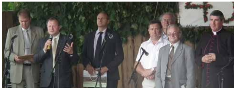
Bijotų 455 metų minėjimas ir Lurdo grotos šventinimas – viena iškilusių švenčių Bijotuose (2013 m.).