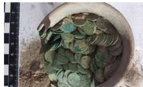
T. L. Burattini kalyklos monetų lobis, neseniai rastas Lenkijoje (plačiau – kitame numeryje)

1666 m. gruodžio 22 d. karalius Jonas Kazimieras Vaza įsakė visoje Respublikoje visoms kalykloms sustabdyti monetų kaldinimą. Taip bajorijai siekė susidoroti su monetų kaldintojais. T. L. Burattini stojo prieš teisumą. Teismas ne tik išteisino T. L. Burattini, bet ir pripažino valstybės skolą kaldintojui, siekusių 1,5 mln. auksinų. Kadangi Respublikos išdas neturėjo lėšų skolai sumokėti, teismo sprendimu T. L. Burattini buvo suteikta teisė papildomai nukaldinti savo reikmėms 1,5 mln. auksinų vertės varinių šilingų. Šios skolos grąžinimas tęsėsi