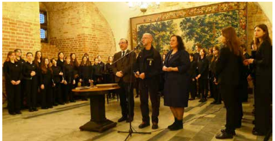
Ukrainos sakralinio meno parodos atidaryme.

Parodos organizatoriai yra Lietuvos nacionalinis dailės muziejus ir Nacionalinis Kyjivo Pečerų Lauros istorinis ir kultūrinis draustinis. Paroda veiks iki gegužės 11 d.