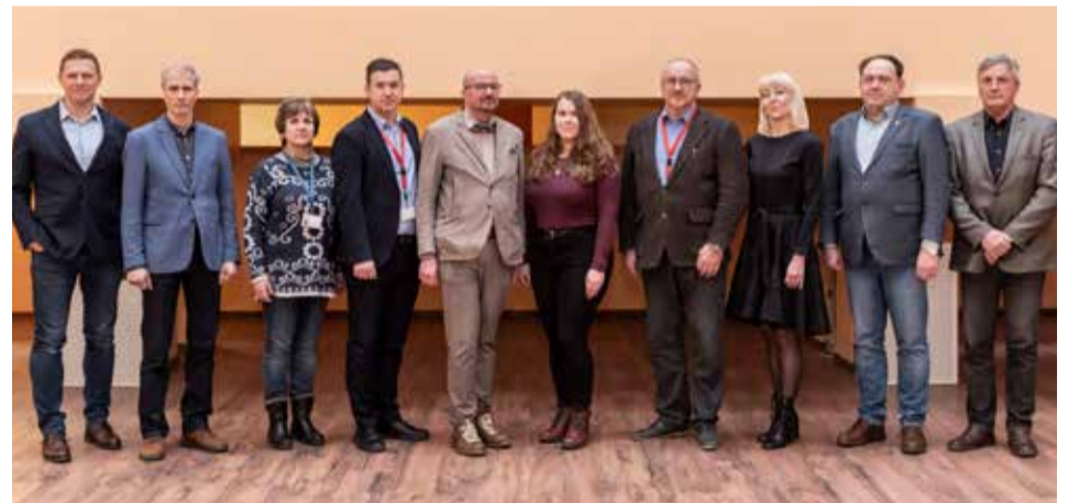
Instituto Mokslo tarybos nariai.

Instituto misija – inicijuoti ir vykdyti nacionalinius bei tarptautinius fundamentinius ir taikomuosius gamtos ir technologijos mokslų, tarpdisciplininius tyrimus, kurie atitinka mokslo, Lietuvos visuomenės bei