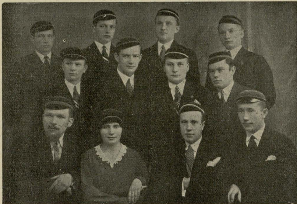
Studentai ateitininkai VI-je Studentų Atstovybėje.

Fakult. Dr. jų S-ga, tikiuos, nudirbs daug ir tiesioginio darbo (ne tik per laikraštį ir Atstovybę), kada jos taryba bei valdybą sudarys visi nepartiniai asmenys. Deja, ta sąlyga toli gražu ne žemėj, bet tik idėjų plokštumoj realizuojama. Todėl visai sąmoningai ir nuosekliai tautininkai ir ateitininkai, pernai nekreipė dėmesio į Sąjungos sudarymą, šiemet, berods, eina į Sąjungą, kaip ir į Atstovybę. Taip kad, vienai grupei sudariusi poziciją, nesilpna bus ir opozicija. Ir todėl Sąjungos organuose galės būti veikli minėta arklio ir bota-go sistema, kuri praktiškai, pasirodo, daugiau gali, nekaip absoliutus pasitikėjimas valdyba. Sąjungos pirmininkas ir „Lietuvos Studento“ redaktorius turėtų, be abejo, būti nepriklausomai ir tuo būdu mažiau inspiruojami tos ar kitos grupės. Bcn. Fabrauskas.