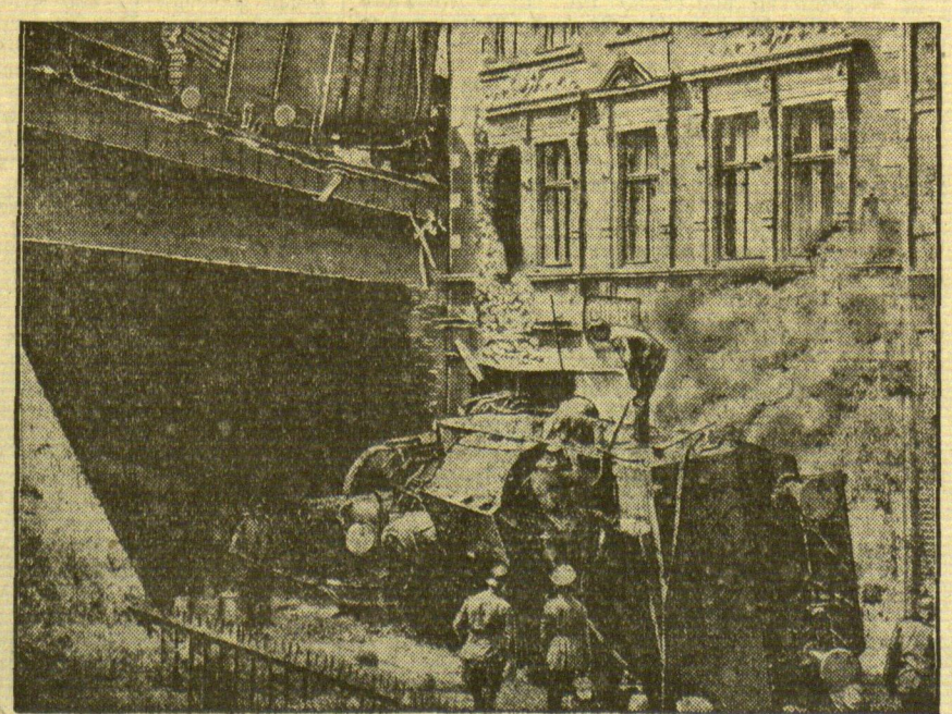
Locomotive auf den Bürgersteig gekürzt In Essen entgleiste vor einer Straßenüberführung infolge falscher Weichenstellung eine Rangierlokomotive, durch das Brückengeländer und stürzte auf die Straße. Der Lokomotivführer und der Setzer wurden sofort getötet, ein Kind erlitt durch den anströmenden Dampf schwere Verletzungen.

Am letzten Sonntag konnte „Vorwärts“-Hendekrug die Spielvereinigung Memel im fälligen Verbandsliga-Fußballspiel 5:3 schlagen. Das Spiel, das mit diesem eben genannten überraschenden Resultat enden sollte — gilt die Spielvereinigung doch als Favorit der diesjährigen Runde — wurde auf dem Sportplatz in Jugnaten ausgetragen. Die erste Halbzeit schloß mit einem Stande von 1:1, und in der zweiten, die eine sichtlich frischerer „Vorwärts“-Elf auf dem Platz steht, konnte Hendekrug das Ergebnis auf 3:1 erhöhen. Das Erreichen des Ausgleiches kostete der Spielvereinigung die letzten Kraftreserven und so wurde es möglich, daß Hendekrug noch zwei weitere Torerfolge erzielen konnte. Mit diesem Sieg dürfte sich die „Vorwärts“-Mannschaft wieder zu den Spitzenmannschaften der Verbandsliga „vorwärts“ und „aufwärts“ gekämpft haben.