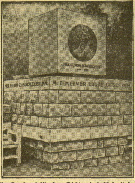
Ein Denkmal für den Dichter des Weserliedes Bei Hirteln an der Weser, wo Franz von Dingelstedt das berühmte Weserlied (Hier hab' ich so manches liebe Mal...) dichtete, wird anlässlich seines 50. Todestages ein Dingelstedt-Denkmal eingeweiht. Das Denkmal ist nach dem Entwurf des Bielefelder Architekten Griemert geschaffen.

Wo die Russen ein geographisches Absatzmonopol haben, wie im angrenzenden Innerasien, werden sie auch schlechte Ware los. Sonst aber entscheidet auf die Dauer die Güte der Ware. Allenfalls mit