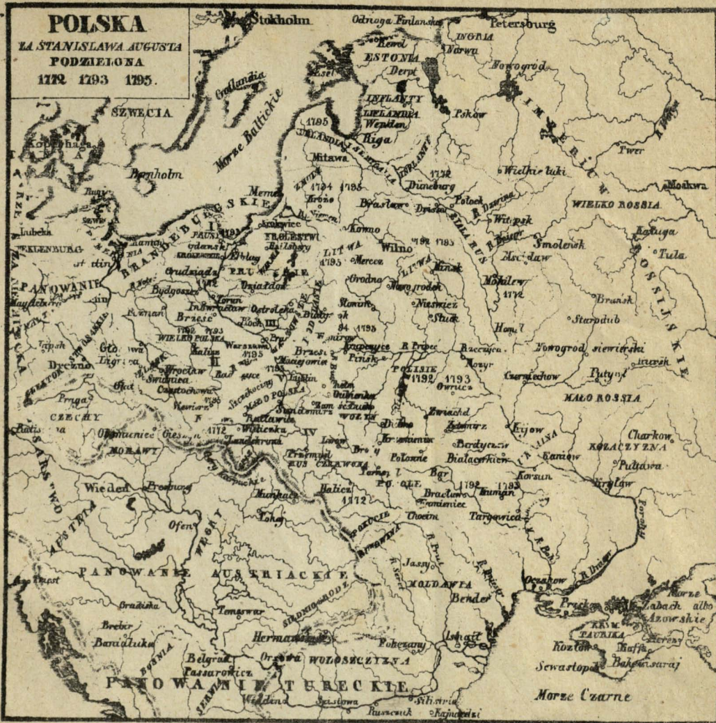
I Prusy zachodnie. II Prusy południowe. III Prusy wschodnie. IV Galicya i Łodomerya. V Galicya nowa.

ZA STANISŁAWA AUGUSTA PODZIELONA 1772 1793 1805.