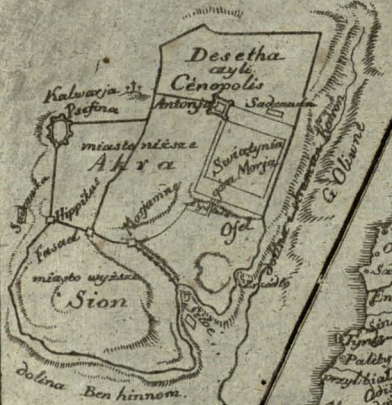
HEROSOLYMA, JERUSALEM. ירושלים