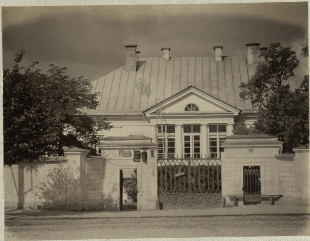
288. [Negatyvas] Fg. 1-3314