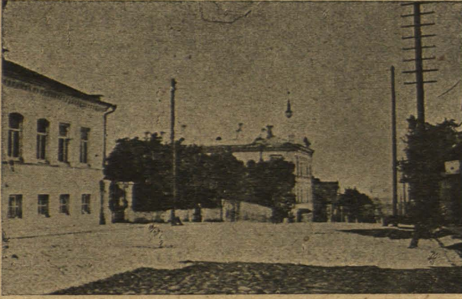
Менская „Чрэзвычайка“ на Пётрапаўлаўскай вул.