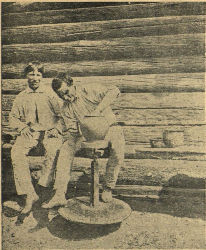
Ганчары. (Менск. пав., Івянецкай вол.).