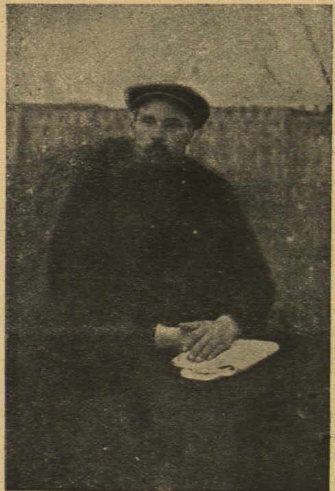
Якуб Колас (Тарас Гушча).

Праўдзівае імя яго—Константын Міцкевіч. Ён пачаў працаваць на ніве беларускай з 1905 г. У першай беларускай легальнай часопісі „Наша Доля“ пачалі друкавацца яго вершы.