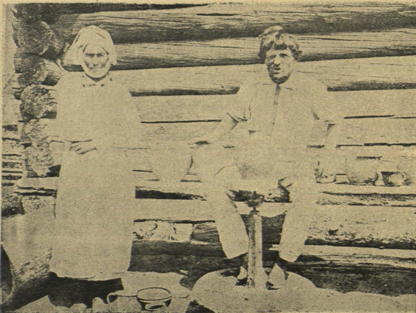
Ганчары пры рабоце.