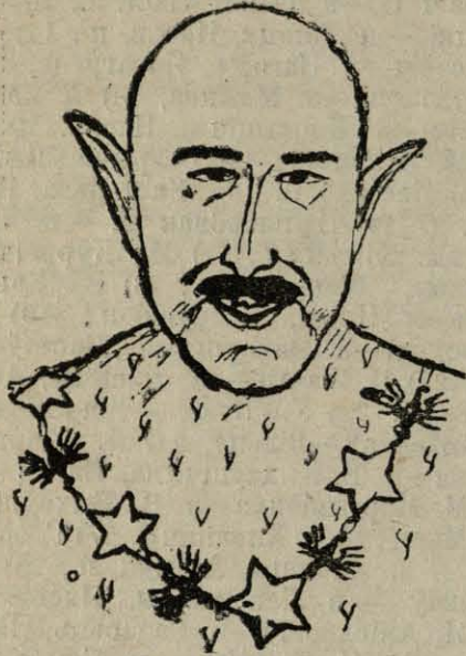
„Надпасол“, „манарх“ А. Л.—вч.

Галерэя Партрэтаў беларускіх парламентарыяў і дзеячоў.