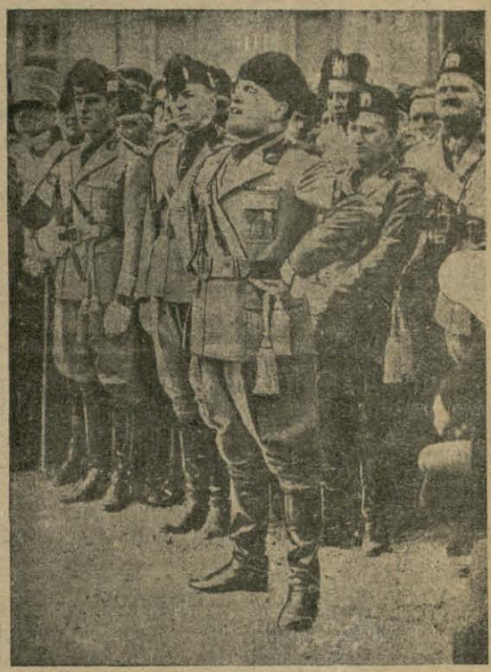
На ўрачыстасьці з прычыны 8-х угодкаў фашыстаўскага перавароту ў Італіі — дыктатар Мусаліні гавора прамову.

ляны ваенным флотам дзяржаваў. Цяпер як раз ідзе дыплёмацыйная перапіска з Кантонам адносна адшкадаваньня за прычыненыя страты чужаземным дзяржавамі і іх грамадзянам. Англія, Амэрыка і Японія напісалі ноты, жадаючы грашовых кампэнсацыяў і гарантыі, што ўперад не паўторацца падобныя выпадкі. Гэн. Шэк заявіў, што ён разьсьледуе гэты факт на месцы і дасць завальняючы адказ. Але можна прадбачыць наперад, які гэта будзе адказ. — састаўлены над дыктоўку большавіцкага дарадчыка Барадзіна. Кантон абядае зьвярнуць чужаземцам страты, але ўзамен патрэбуе заплаты за зьнішчэньні, прычыненыя абстрэлам горада. Гэтак квітаваліся большавікі з Англіяй і Францыяй, трэбаўшых адшкадаваньня за ўбыткі, панесеныя іх грамадзянамі ў часе большавіцкай рэвалюцыі ў Расеі. У кожным разе, сытуацыя лічыцца вельмі сур'ёзнай. З Англіі, Амэрыкі і Японіі прыбываюць ўсё новыя падкрэпленыя Тры названыя дзяржавы напераджаючы, што калі толькі Кантон ня дасць задовальваючага адказу, дык магчыма будзе блэкада марскіх берагоў Палуднёвага Кітаа.