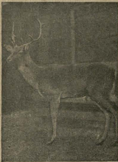
У Варшаўскім зьвярынцу знаходзіцца прыгожы алень з Белавежскае пушчы.