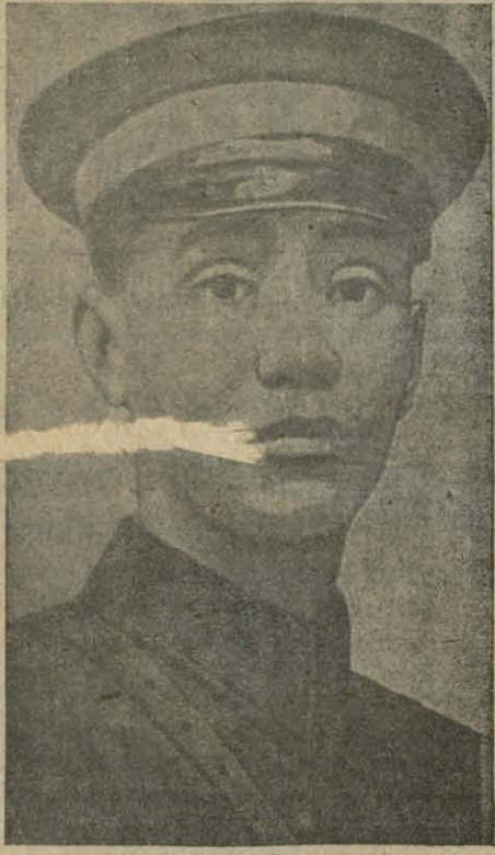
Ген. Чан-Кай-Шэк, які стаіць на чале кантонавай арміі, заняўшай Шанхай.

РАСТРЭЛ 2 ШПЕНАЎ. У Тарунскім вайсковым судзе закончылася справа проці паручнікаў Урбаніка і Пятка, якія былі абвінавачаны ў шпіёнстве на карысць суседняе дзяржавы. На судзе ўся справа вялася тайна.