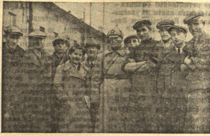
Група рабочых скурзавода Штурмана, выбраных на агульны сходзе у Рабочую Гвардыю.