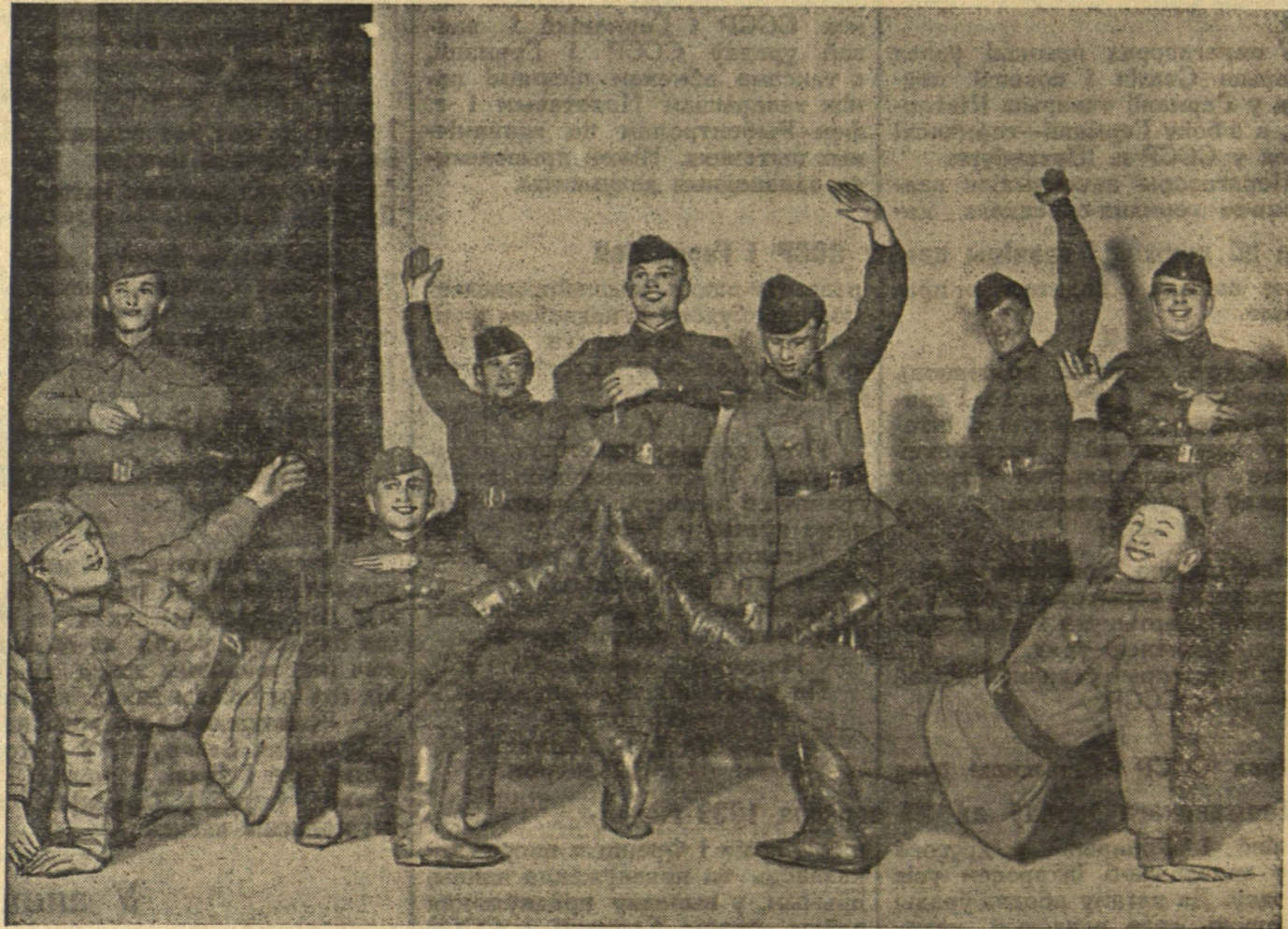
Выступленне Ансамбля чырвонаармейскай песні і пляскі ў горадзе Вільно. На здымку: група удзельнікаў ансамбля выконвае «Чырвонаармейскую пляску».