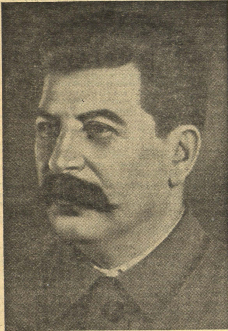
Генеральны сакратар Цэнтральнага Камітэта Усесаюзнай Комуністычнай Партыі (большэвікоў) таварыш Іосіф Вісарыёнавіч Сталін