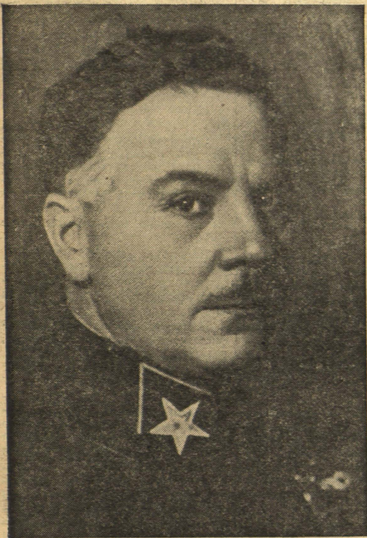
Народны Камісар Абароны, першы маршал Савецкага Саюза таварыш Кліменцій Ефрэмавіч Варашылаў