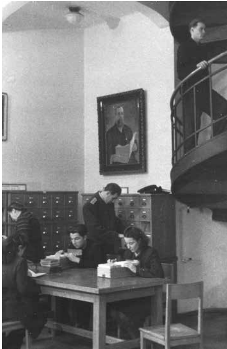
LMAB katalogų kambarys. [Vilnius], 1949. LMAVB RSS, Fg.1-1897/1.