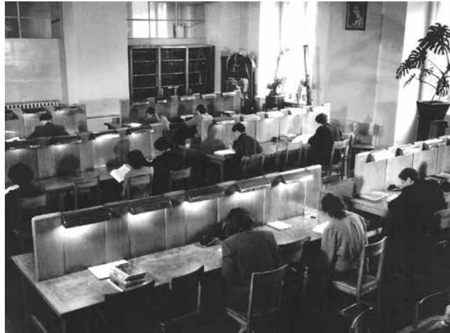
LMAB Bendroji skaitykla. [Vilnius], 1959.