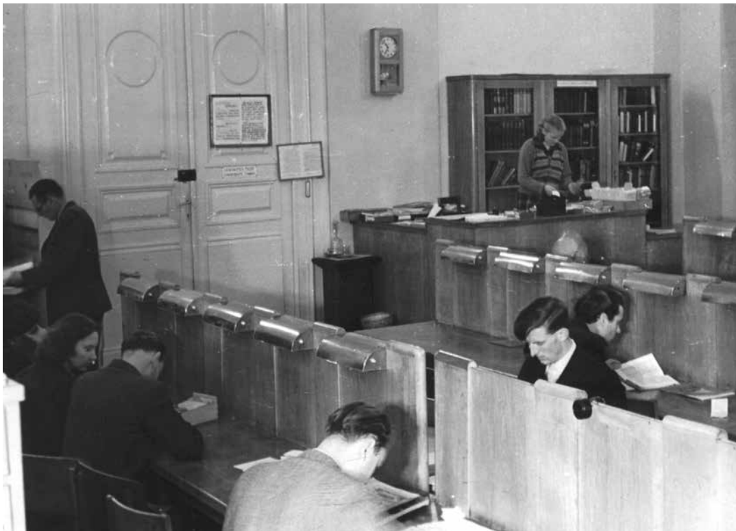
LMAB skaitykla. [Vilnius], 1957.