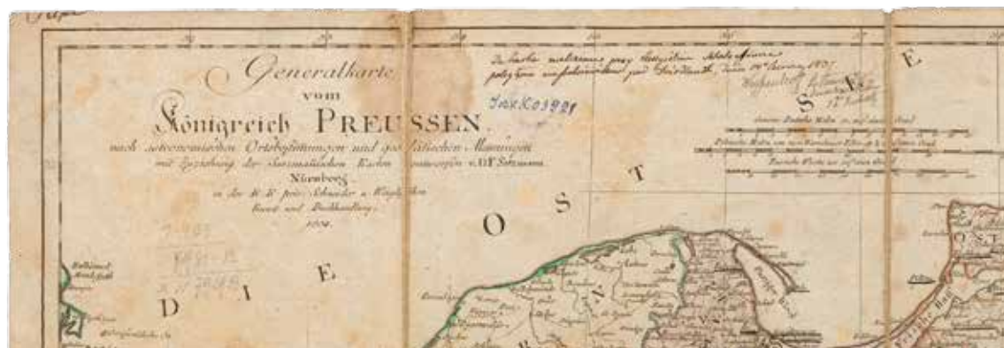
1804 m. Prūsijos karalystės žemėlapis ir žemėlapio fragmentas su nuosavybės įrašu. LMAVB RSS K-874