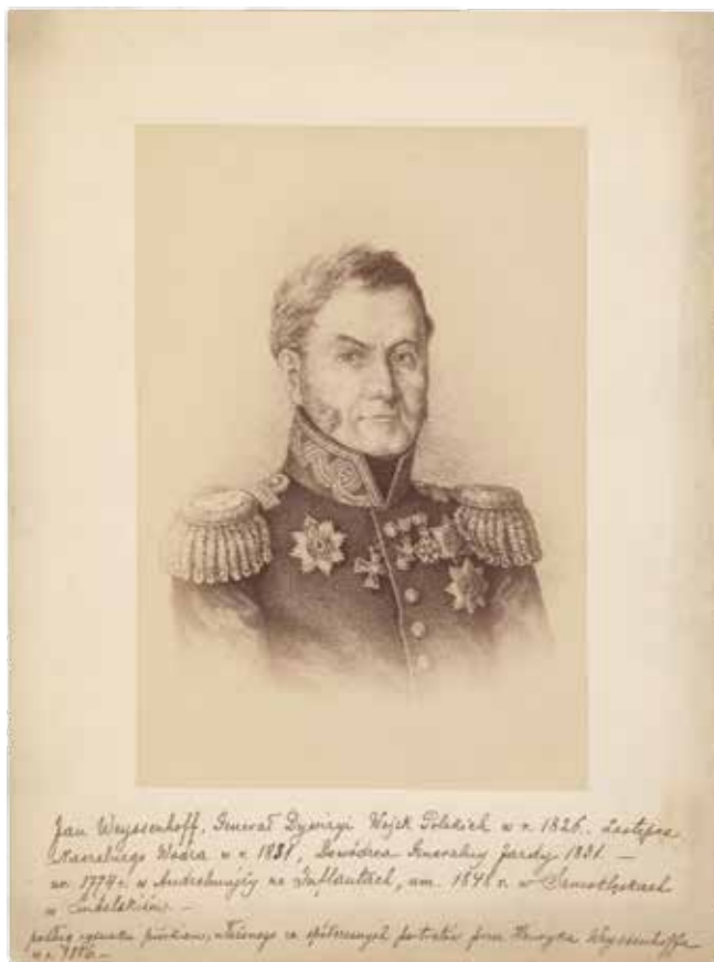
Generolas Janas Veisenhofas (1774–1848): portreto fotoreprodukcija. LMAVB RSS Fg1-2036