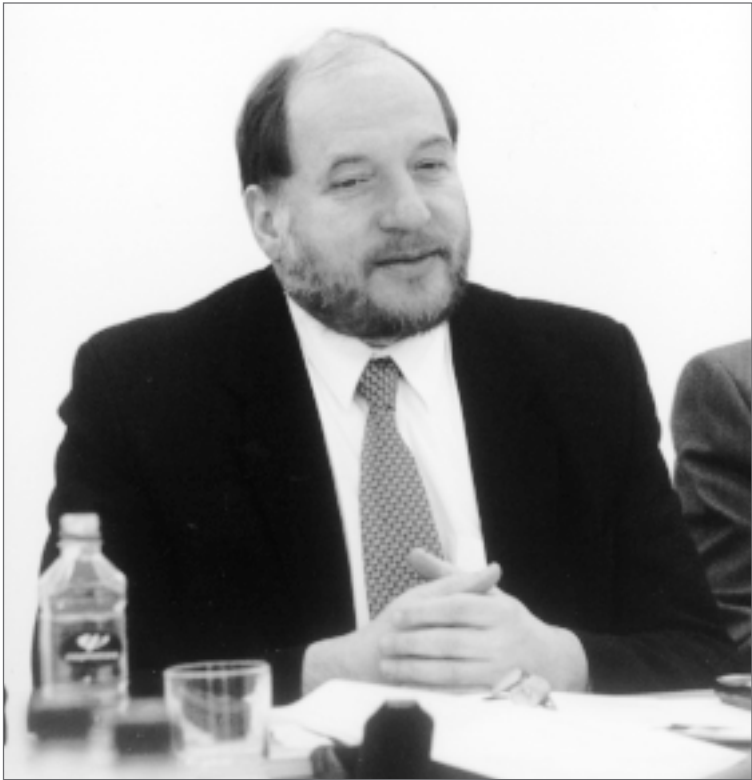
Lietuvos Respublikos Seimo Žmogaus teisių komiteto pirmininkas Gediminas Dalinkevičius