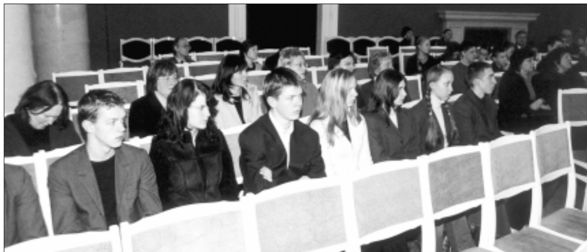
Jei ne sostinės Petro Vileišio gimnazijos moksleivių būrys, konferencijos salė Rotušėje būtų beveik tuščia