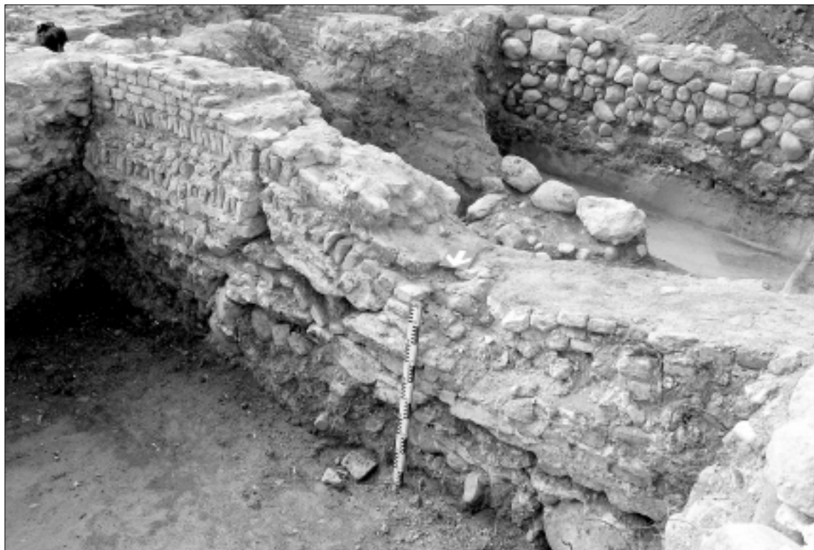
Vilniaus senamiesčio 60-asis kvartalas. Pamatai, neatlaikę 200 metų naštos, virš ūkinės XVII a. duobės

G. Drėmaitė. Valdovų rūmų teritorijoje archeologai atidengia fantastiškus dalykus. Paskutinis matytas vaizdas stovi akyse – atidengtos medinio tilto, vedusio į Žemutinę pilį, liekanos. Išlikę seni mediniai rąstai. Tačiau ar daug iš tų radinių matys būsimejų Valdovų rūmų lankytojas? Labai abejoju. 2003 m. vasarą buvo atidengta Žemutinės pilies rūmų teritorija, kurioje buvo matyti mediniai šaligatviai, pastatų likučiai. Tačiau šiandien ta vieta užbetonuota, nes eina kolektorius, kuris būtinas būsiam atstatomų Valdovų rūmų egzistavimui. Tačiau archeologinė vertybė neišsaugota.