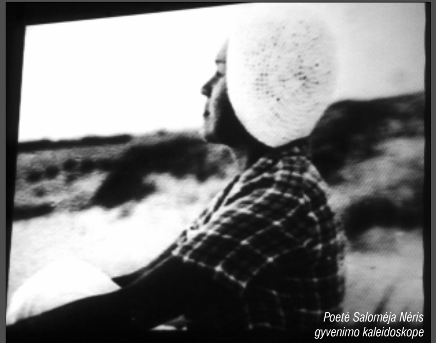
Poetė Salomėja Nėris gyvenimo kaleidoskope