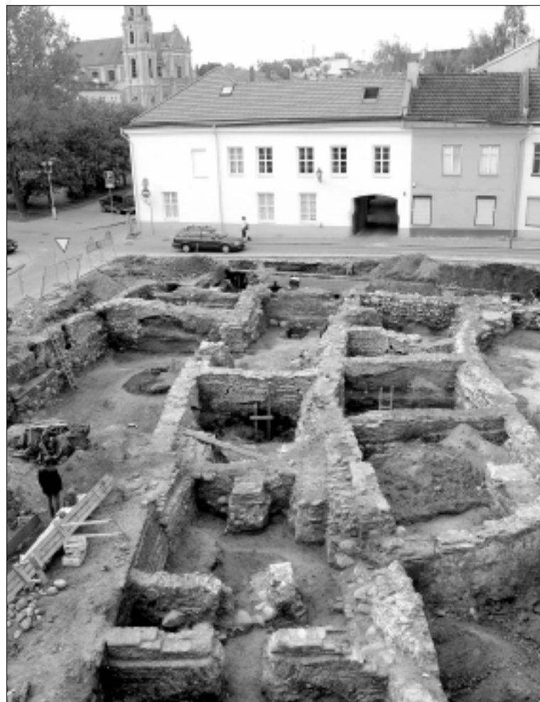
Vilniaus senamiesčio 60-asis kvartalas. Mažoji Vilniaus „Pompėja“. Archeologinių tyrimų metu ryškėjantis XVI–XIX a. pamatų „korys“

Jei dažno archeologo praktiškai neįmanoma patikrinti, nes tyrinėjimo metu kultūrinis sluoksnis sunaikinamas, tai mūsų darbą bus galima patikrinti tose pačiose požeminėse komunikacijose. Mat iškart po mūsų, archeologų, čia dirba mūro restauratoriai, kurie tas liekanas restauruoja, apsau-