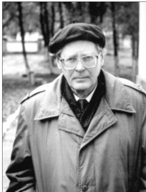
Žmogaus teisių gynėjas biologijos mokslų daktaras Sergejus Kovaliovas