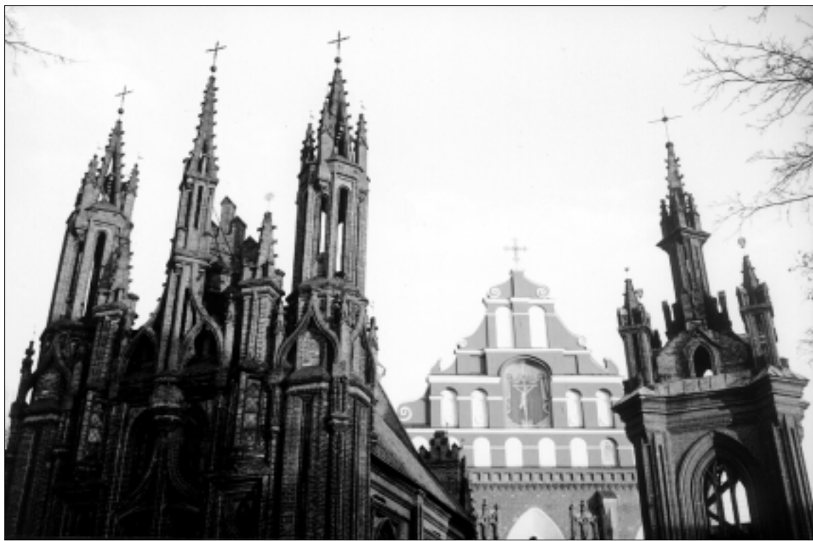
Vilniaus gotikos kampelis yra įkvėpęs ne vienos tarptautinės konferencijos dalyvius

Deja, atsivertęs kai kuriuos leidinius, gali pagalvoti, kad leidėjai turi, kaip ironizuoja viename esė Umberto Eco (Umberto Eco), vienintelį tikslą – parduoti savo prekę. Kartais net topteli mintis apie kažkokį sąmokslą, ima atrodyti, kad