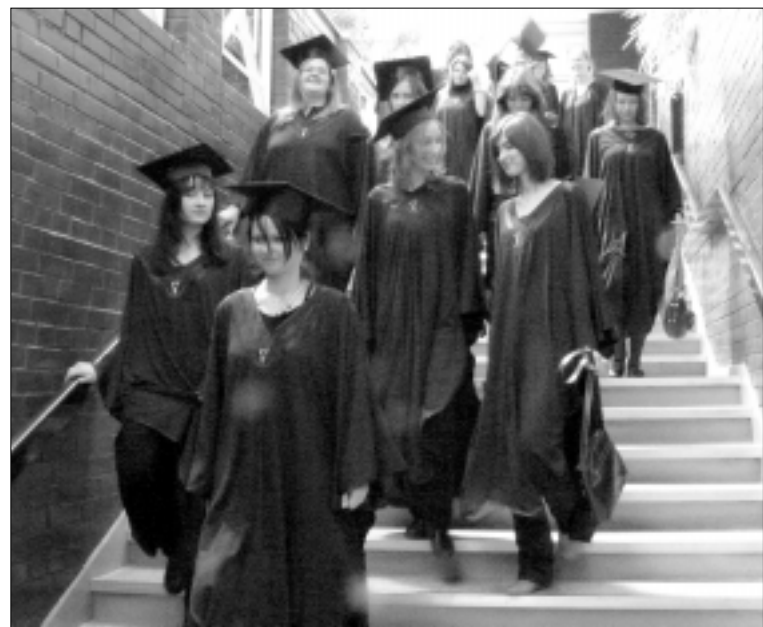
Vilniaus kolegijos studentės

Dabar kadencijų nėra, bet mūsų parengtame siūlyme buvo numatyta, kad kas 5 metai būtų skelbiamas naujas konkursas į šias pareigas. Lygiai tas pats, kaip universitetų dėstytojams.