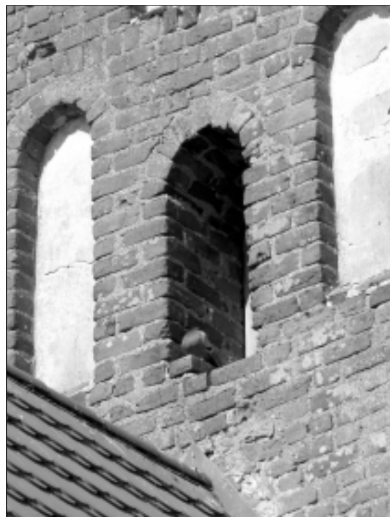
Zapyškio bažnyčios architektūriniai fragmentai