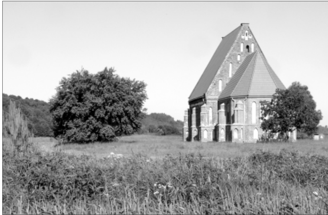
Už Kauno, panemuniuos, rymo vėlyvosios gotikos grožybė – Zapyškio bažnyčia