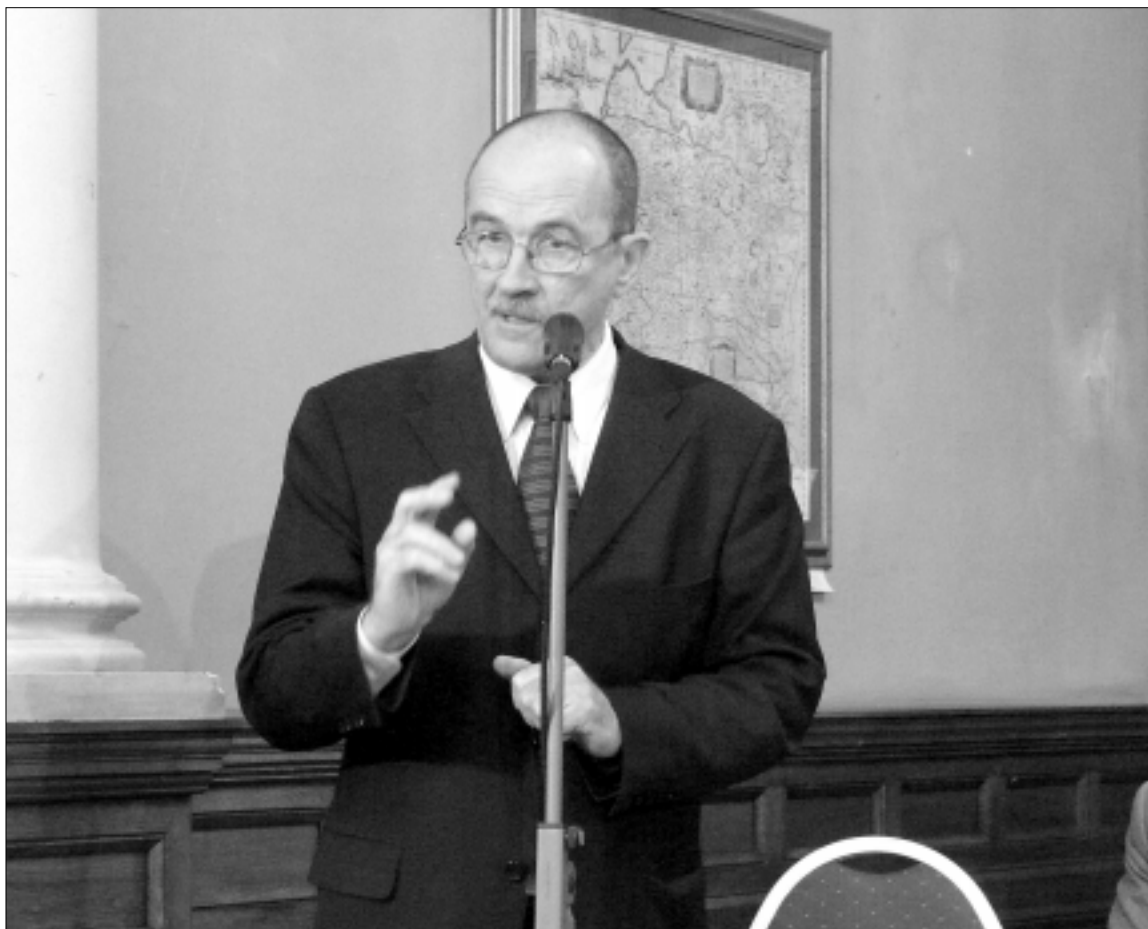
Prisiminimais apie Sajūdžio pradžią dalijasi Romualdas Ozolas

Romualdas Ozolas pasidžiaugė, kad salė apypilnė, nors atėjusiųjų daug mažiau negu prieš 20 me-