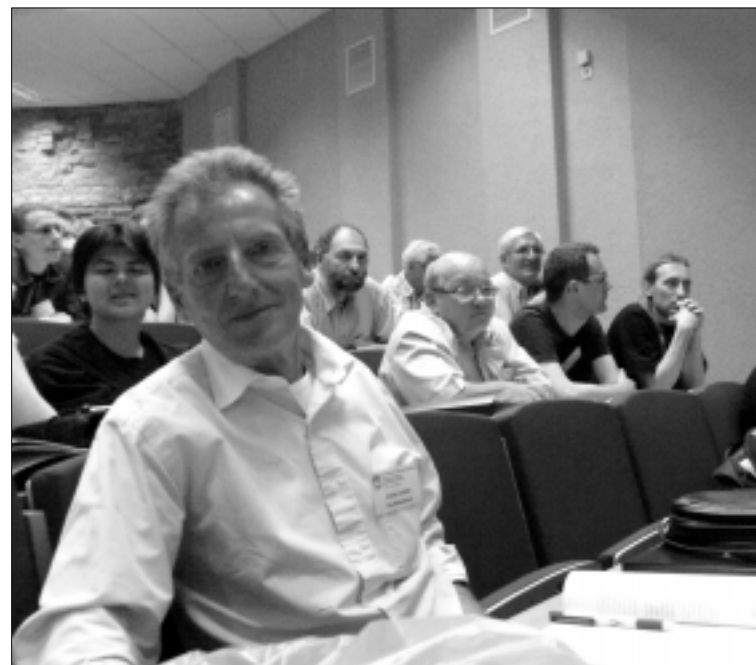
Baltijos organinės sintezės (BOS 2008) konferencijos Vilniuje akimirkos