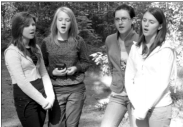
Pabradės „Ryto“ gimnazijos moksleivės kelionės dalyvius turtino lietuvių partizanų ir liaudies dainomis

sudėtyje buvo ir Šakių (tada Naumiesčio) apskrities dalis. 1915 m. Suvalkų gubernija atiteko Oberostui, o 1918 m. paskelbus Lietuvos nepriklausomybę tapo nedaloma Lietuvos dalimi.