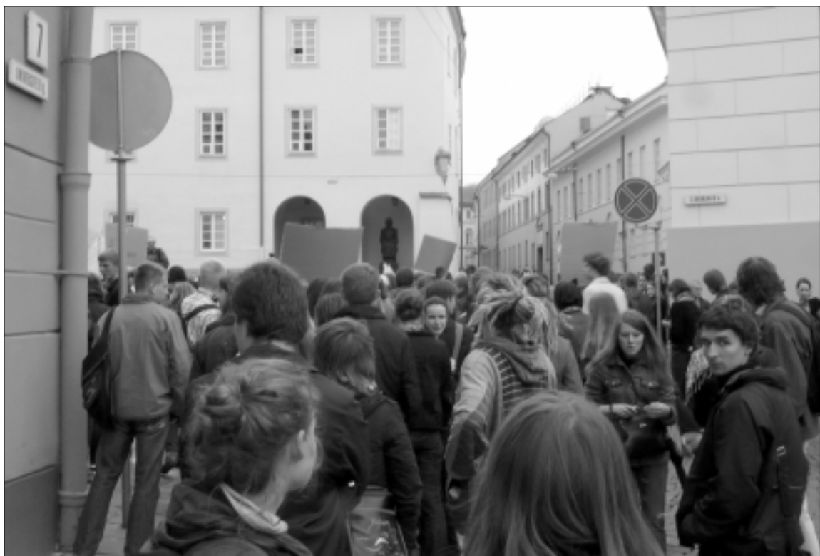
Vilniaus universiteto studentai nepatenkinti aukštojo mokslo sistema

Labai abejoju, ar pati akademinė bendruomenė arba bendrija panorėtų tokios naujovės. Iš esmės per tarybas universitetai būtų veikiami visuomenės. Toks tikslas ir keliamas: turi atsirasti sveika visuomenės įtaka universitetams, nes jie privalo pirmiausia dirbti visuomenei, individui ir valstybei. Ką tai reiškia? Ne visuomet dėstytoju, profesoriaus norai ir gebėjimai sutampa su visuomenės interesais. Tam tikra priešprieša visada bus. Nelabai tikiu, kad universiteto darbuotojai patys panorės tokių radikalių pereinamųjų. Net ir tarybų modelio universitetams teikėjai šiandien negali pasiūlyti, kas darytina, kad būtų išvengta neigiamų padarinių, kurie pastebėti formuojant kolegijų tarybas. Kol kas