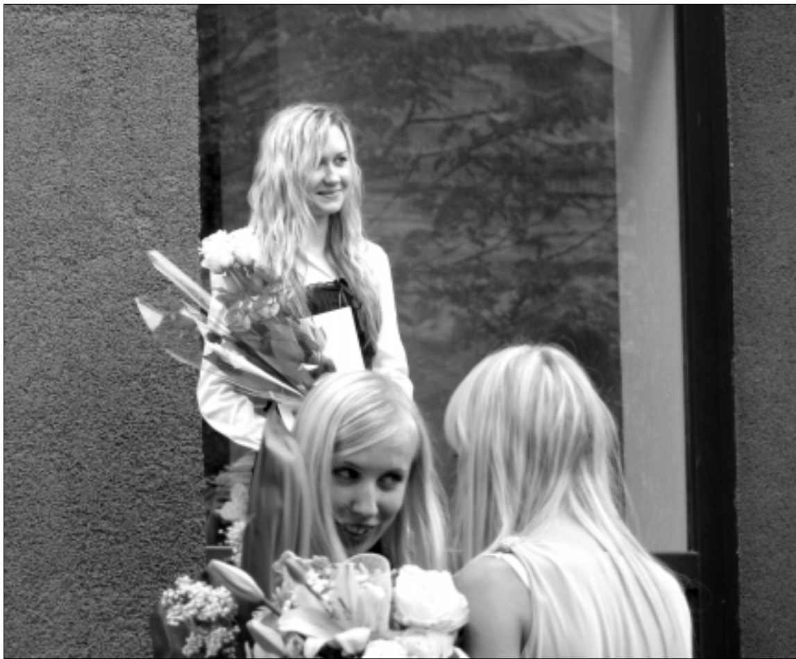
Mes jau diplomuotos...