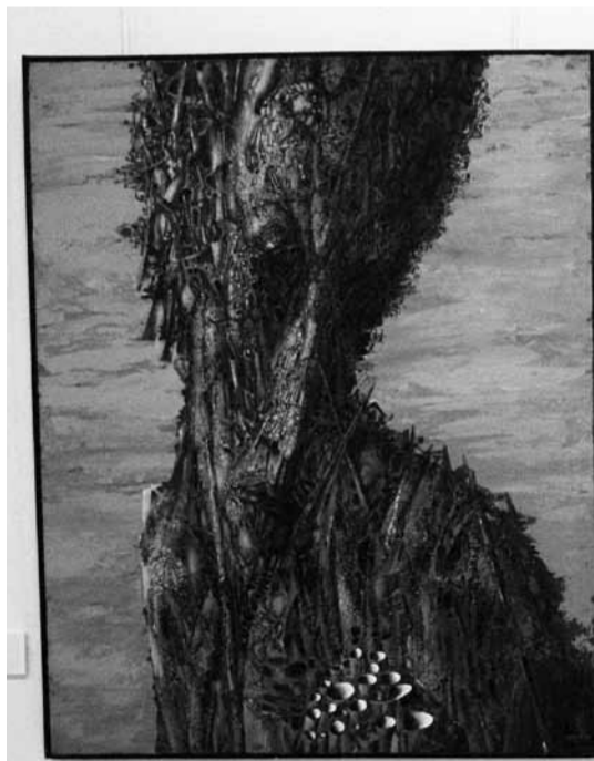
Vargono garsai. 1996, drobė, akrilas