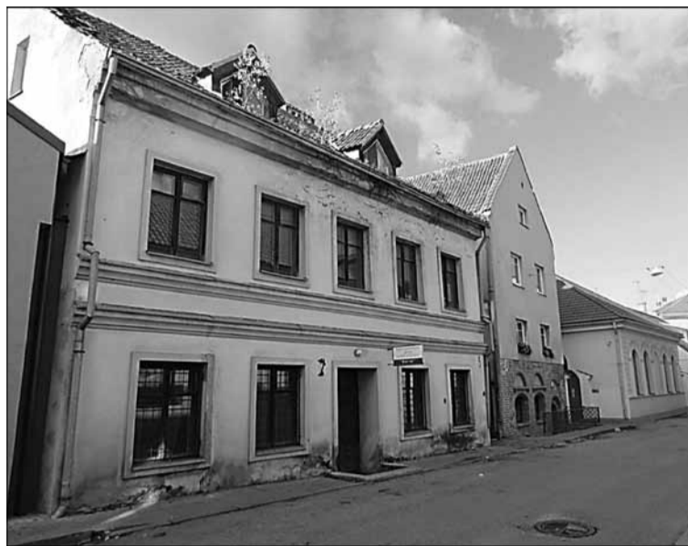
Buvęs Zilbernikų namas, dabar Lietuvos esperantininkų sąjungos būstinė, 2012 m.