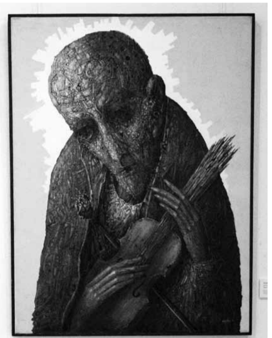
Nutilo stygos. 1993, drobė, akrilas