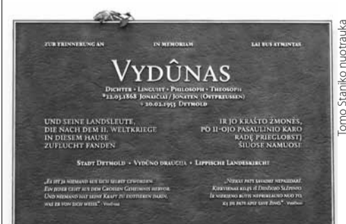
Atminimo lenta Vydūnui ir jo krašto žmonėms, radusiems čia prieglobstį po Antrojo pasaulinio karo, atidengta Detmolde prie Wiesenstrasse gatvės Nr.5 namo (2013 05 10)