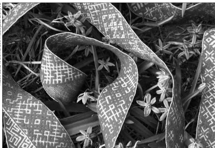
Legendomis apipinta Lielvārdes juosta Latvijoje laikoma tikru tautos sakralumo simboliu, neatsitiktinai šiais ornamentais papuoštas keturtomis leidinys „Latviai ir Latvija“

„Už nuopelnus Lietuvai“ Komandoro kryžiumi.