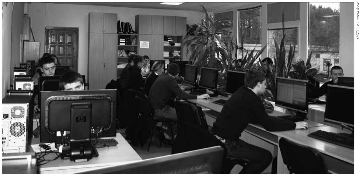
VGTU Transporto inžinerijos fakulteto studentai pratybų metu

Logistika – vienas iš pagrindinių Europos ekonomikos sektorių, apimantis verslo produktų ir informacijos judėjimą ir sandėliavimą tarptautiniu mastu. Transporto ir logistikos sektorius – vienas perspektyviausių ir spar-