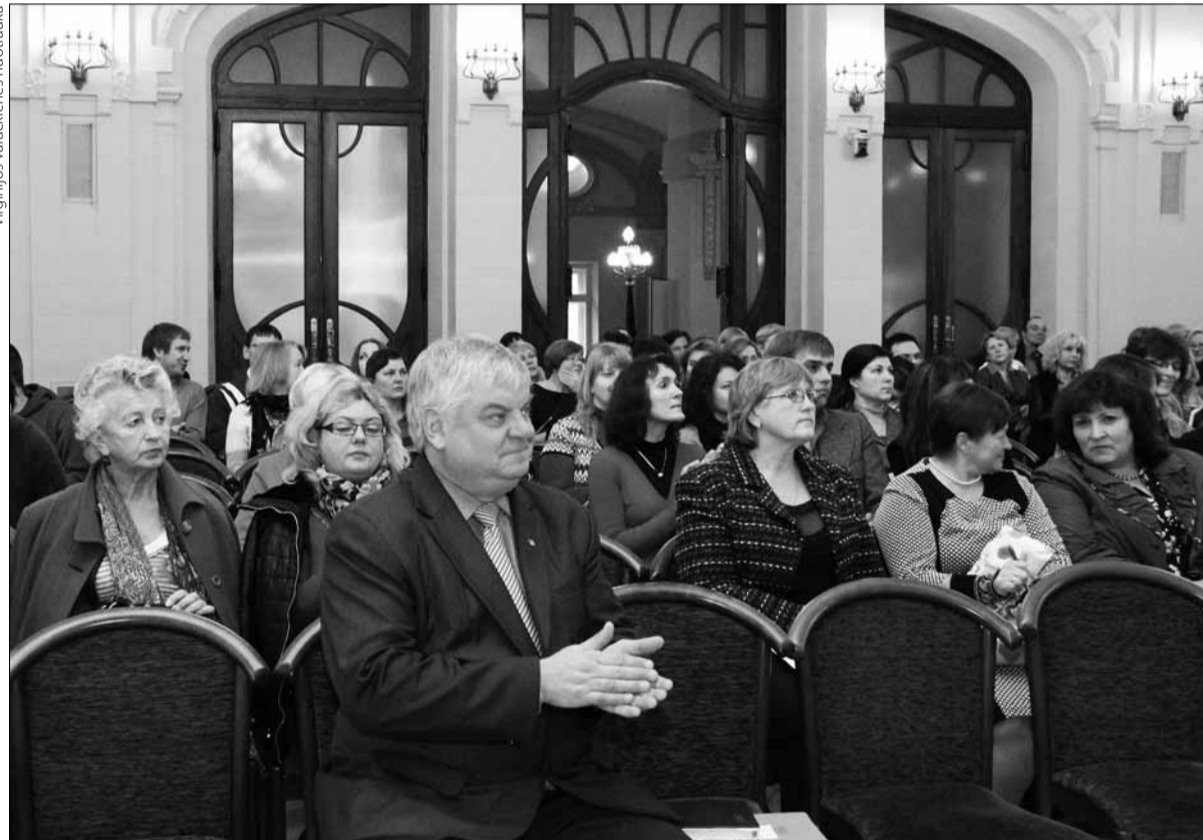
Konferencijoje susitiko Lietuvos vidurinių mokyklų biologijos mokytojai, Vilniaus universiteto Biotechnologijos instituto mokslininkai ir Vilniaus universiteto profesoriai

Taigi ši konferencija biologijos mokytojams buvo naudinga – sudaryta puiki galimybė susipažinti su Lietuvoje atliekamais molekulinės biologijos tyrimais ir jų pasiekimais.