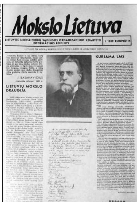
Titulinis pirmojo „Mokslo Lietuvos“ numerio puslapis (1989 m. rugpjūčio 1 d.)