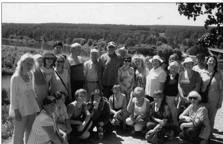
Mokslo ir enciklopedijų leidybos centro komanda lankėsi ant Merkinės piliakalnio

Šveicarija Lietuvą pripažino de jure taip pat du kartus – 1921 ir 1991 metais. Šveicarai noriai talkino 1918 m. paskelbtai Lietuvos Respublikai. Jau 1919 m. Berne pradėjo veikti Lietuvos pasiuntinybė, 1920 m. Ciuriche – Lietuvos gen. garbės konsulas. Lietuva 2012 m. eksportavo į Šveicariją prekių už 165,8 mln. Lt., importavo – už 323,3 mln. Lt. Šveicarijos tiesioginės investicijos į Lietuvos ūkį 2011 m. su-