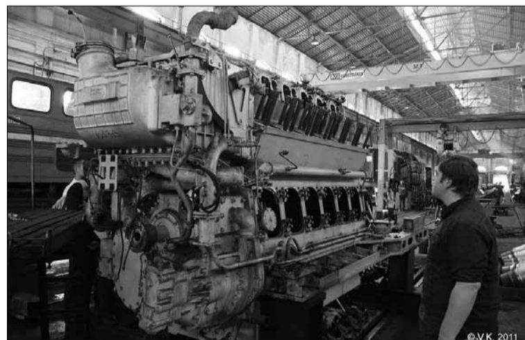
VGTU Transporto inžinerijos fakulteto studentų laboratoriniai darbai Vilniaus lokomotyvų remonto depe

čiausiai augančių rinkoje. Jis sukuria beveik 14 % Europos BVP (remiantis Europos logistikos veiksmų planu). 2013 m. birželio 11 d. Briuselyje buvo oficialiai įsteigta Europos technologijų platforma Logistikos vystymui (European Technology Platform on Logistics, ALICE). Platforma įsteigta, kad būtų parengta išsami strategija dėl tyrimų, naujovių taikymo, logistikos ir tiekimo grandinės valdymo inovacijų diegimo į rinką Europoje. Platforma prisidės prie ES mokslinių tyrimų programos „Horizontas 2020“, kurioje dalyvauja ir Lietuvos mokslininkai. Tikslas – pasiekti 30 % našumo logistikoje pagerinimą iki 2030 m., t. y. paspartinti našesnių, konkurencingesnių ir tvaresnių tiekimo grandinių kūrimą.