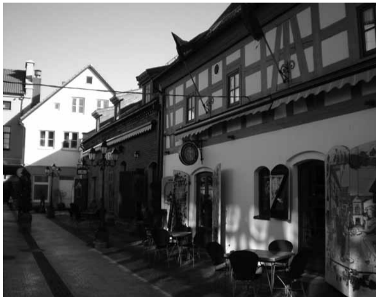
Klaipėdos senamiesčio pasažų dabartinis vaizdas