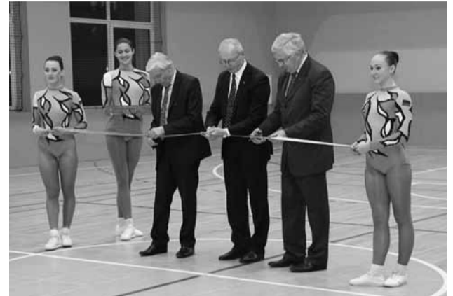
Aleksandro Stulginskio universiteto atnaujintos sporto bazės atidarymas

Detaliausiai visą Žemės ūkio akademijos veiklą Dotnuvoje išanalizavo ir apibendrino jos auklėtinis (1930), buvęs Specialiosios