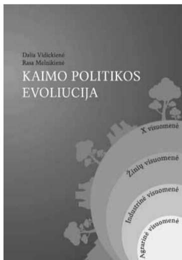
Monografijos „Kaimo politikos evoliucija“ viršelis

Parengė Lietuvos agrarinės ekonomikos institutas