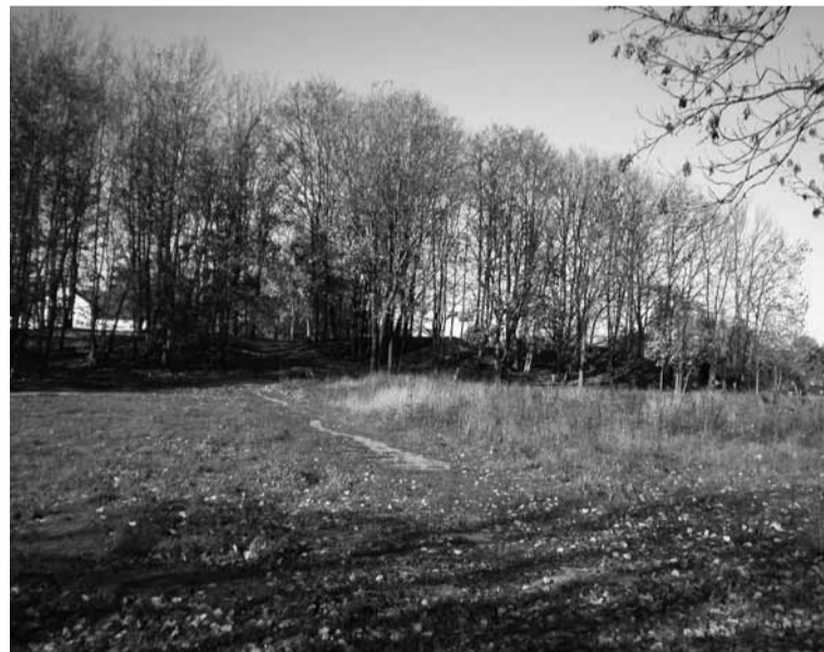
Nesaugomi Klaipėdos jūrų tvirtovės fragmentai