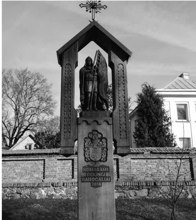
Koplytstulpis Komarų giminės atminimui.