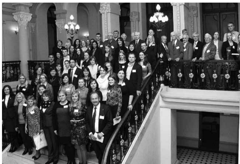
Konferencijos dalyviai Lietuvos mokslų akademijos rūmuose.

ji mokslininkai iš Lietuvos agrarinių ir miškų mokslų centro, Aleksandro Stulginskio, Lietuvos sveikatos mokslų ir Kauno technologijos universitetų, Gamtos tyrimų centro ir Lietuvos agrarinės ekonomikos instituto. Jie skaitė pranešimus agronomijos, agrochemijos, sodininkystės ir daržininkystės, veterinarijos, zootechnikos, miškininkystės, aplinkotyros, agrarinės ekonomikos ir maisto saugos temomis.