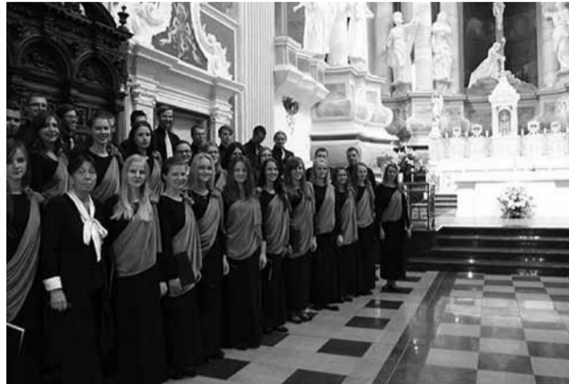
Aleksandro Stulginskio universiteto choras Kauno katedroje.