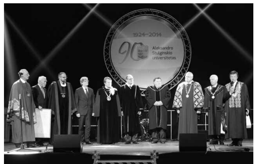
90-mečio proga Lietuvos universitetų rektorai sveikina Aleksandro Stulginskio universiteto bendruomenę

<...> Pastarasis laikotarpis ASU buvo ne tik ryžtingų sprendimų ir jų įgyvendinimo, bet ir atsakingas išbandymų ir įvertinimo laikas. 2012 m. spalio mėnesį Studijų kokybės vertinimo centro (SKVC) sudaryta tarptautinių ekspertų grupė atliko ASU veiklos išorinį vertinimą. Galime džiaugtis šį egzaminą išlaikę puikiai: teigiamas ekspertų išvadas