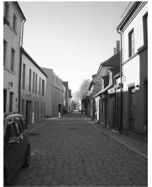
Klaipėdos senamiesčio gatvės dabartinis vaizdas.

Norvegijos Stavangerio miesto jūrų muziejaus vyresnysis specialistas Haraldas Hamrė perskaitė pranešimą „Jūrinio paveldo išsaugojimo projektai Norvegijoje“. Šioje valstybėje jūrinio paveldo būkle rimtai susirūpinta gal tik prieš gerus keturis dešimtmečius. Vis tik turtingoje šalyje per šį laikotarpį padarytas milžiniškas šuolis. Pranešėjas nurodė, kad senieji laivai Norvegijoje ypač saugomi ir restauruojami. Yra trys senųjų laivų restauravimo centrai (du iš jų restauruoja tik medinius laivus), kuriuos išlaiko valstybė. Norvegijoje yra 220 saugomų laivų sąrašas, o 10 laivų yra ypač saugomų sąraše. Stavangerio muziejus irgi turi ne vieną plaukiojantį burinį laivą – eksponatą. Ypač vertinga istorinė erdvinė Stavangerio miesto struktūra bei panorama su didelių baltų sandėlių ir silkių apdorojimo pastatų, išrikuotų galų į vandens telkinius bei gatves, virtinėmis nuo XIX a. vidurio iki šiol yra nepakitusi (apie tai liudijo įspūdingos iliustracijos). Tik šiuose pastatuose dabar yra ne sandėliai, o viešbučiai, restoranai, įstaigos ir pan. Pats muziejus yra įsikūręs dvejuose istoriniuose sandėliuose, kuriuose išsaugota daug autentiškų interjero elementų. Dar 1989 m. muziejus parengė programą ir bandė gaivinti tradicinį Baltijos silkių