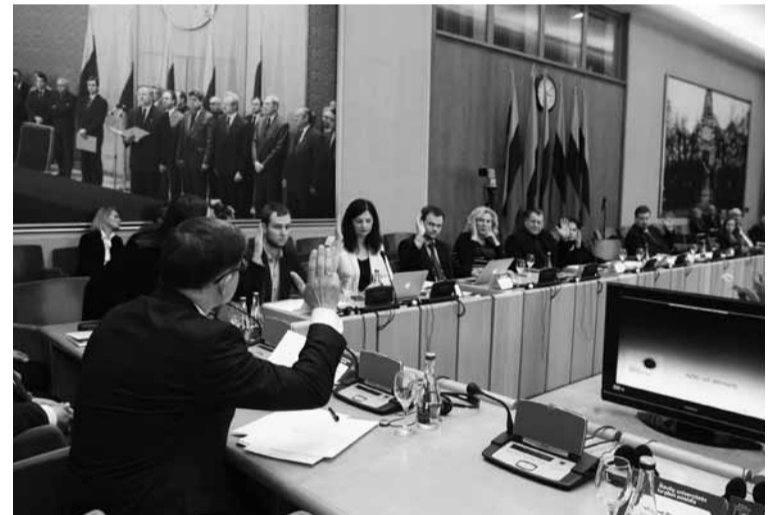
Balsuoja Šiaulių universiteto tarybos nariai.

ir specialiojo ugdymo bei edukologijos sričių tyrimai. Prieš keletą metų Šiauliuose atidaryta viena moderniausių universitetinių bibliotekų. Universitetas jau seniai peržengė jam pradžią davusius pedagoginio instituto ir KTU fakulteto rėmus.