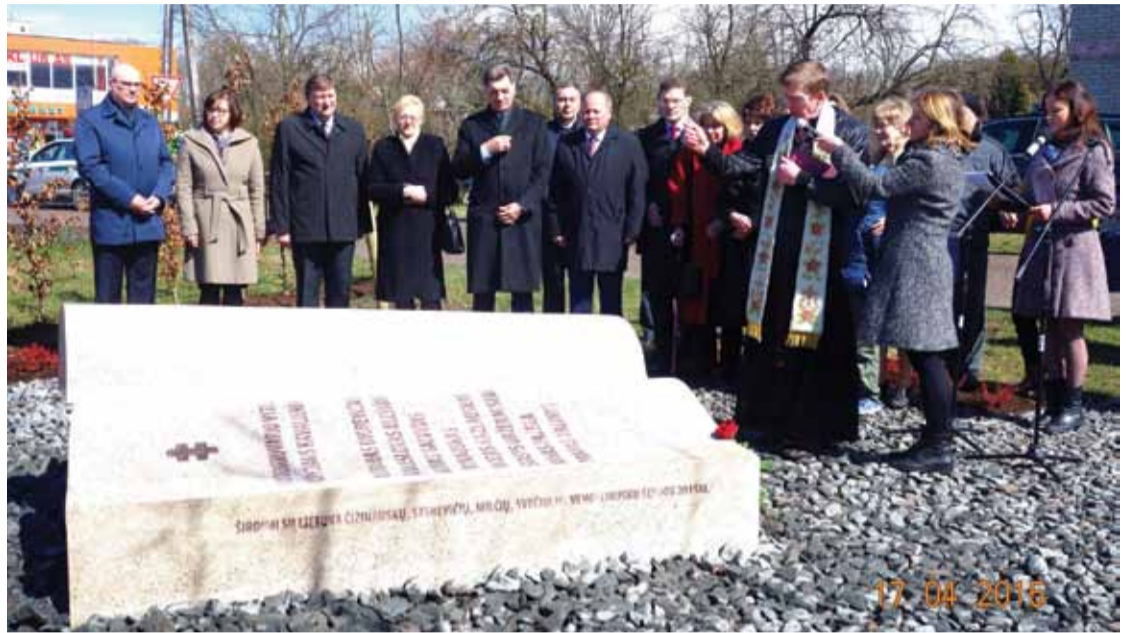
Paminklo Lietuvos savanoriams atidengimas. Penktas iš kairės – Ministras Pirmininkas Algirdas Butkevičius.