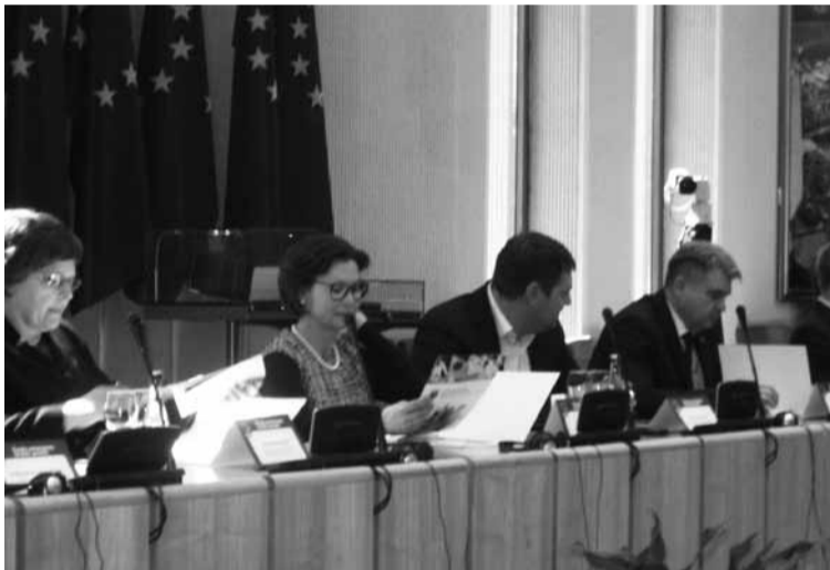
Renginio LR Seime dalyviai susipažįsta su Šiaulių universiteto strategija.

publikacijas labai susilpnino dėmesį Lietuvos regionų raidos problemoms. Primityvią ir agresyvią konkurenciją iki šiol lemia ir pseudoliberaliųjų ideologija besiremianti aukštojo mokslo institucijų finansavimo sistema, pagrįsta itin subjektyviomis „krepšelių“ ir „projektų“ skirstymo metodikomis.