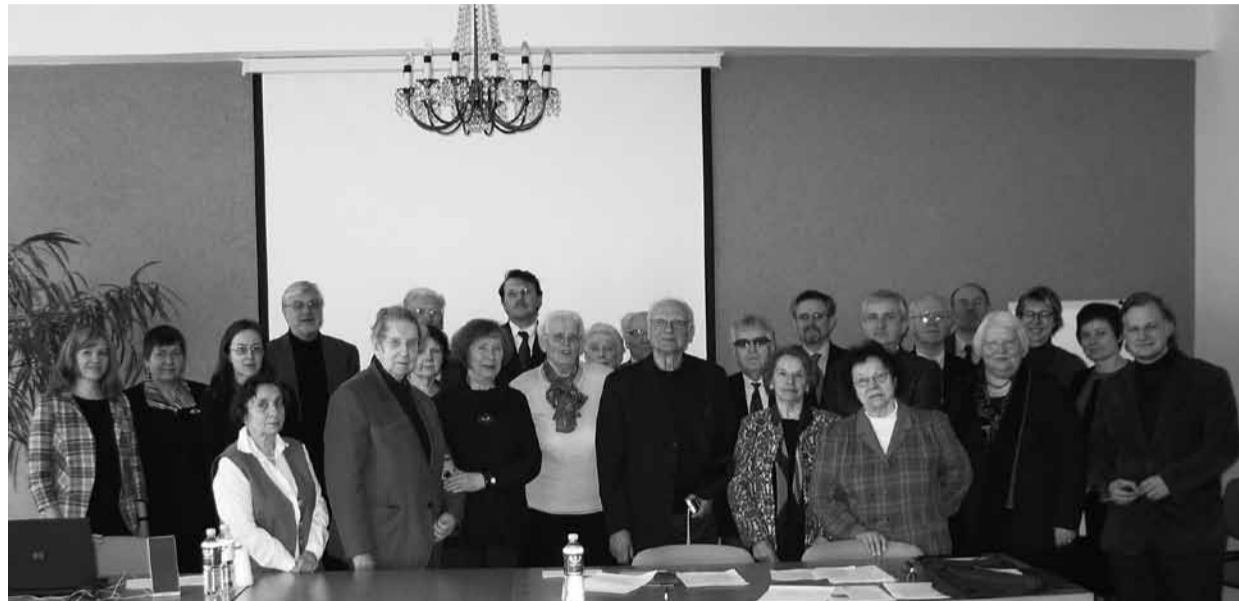
XXII konferencijos dalyvių grupė.