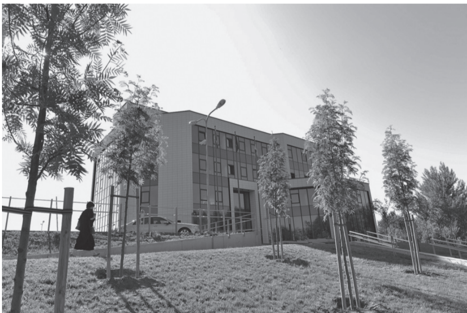
Universiteto bičiulių sodas prie Socialinių inovacijų laboratorijų centro