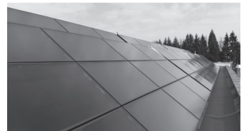
Saulės kolektoriai ant daugiabučio namo stogo