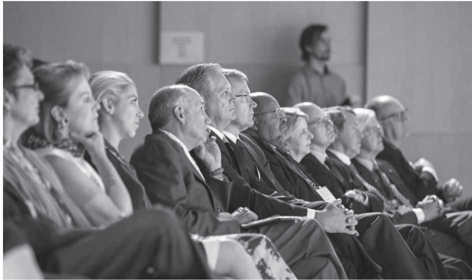
Fondo jubiliejaus susitikimo dalyviai

Baltijos–Amerikos laisvės fondo misija – per švietimo ir mainų programas sustiprinti ryšius tarp Jungtinių Amerikos Valstijų ir Lietuvos, Latvijos bei Estijos, sutelkiant dėmesį į ekonomikos augimo ir demokratijos puoselėjimo procesus. Per penkerius veiklos metus BAFF tapo prestižine stažuotų programa. Tai patvirtina didelė konkurencija tarp norinčiųjų, nes tik vienas iš dešimties yra apdovanojamas BAFF stipendija. Paraiškos gali būti teikiamos du kartus per