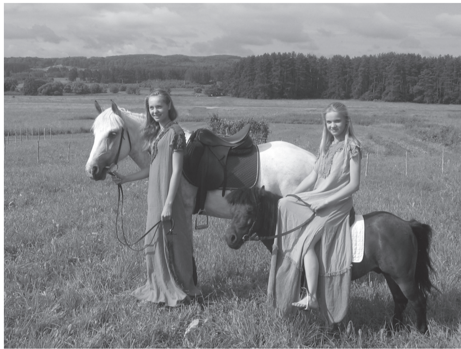
Vaidilutės su žemaituku ir poniu tarptautiniame gyvosios archeologijos festivalyje Kernavėje.

Žemaitukai – universalūs ponių klasės žirgai, tinkantys naudoti šeimos ūkiuose, reabilitacijos centruose, hipoterapijai, vaikų