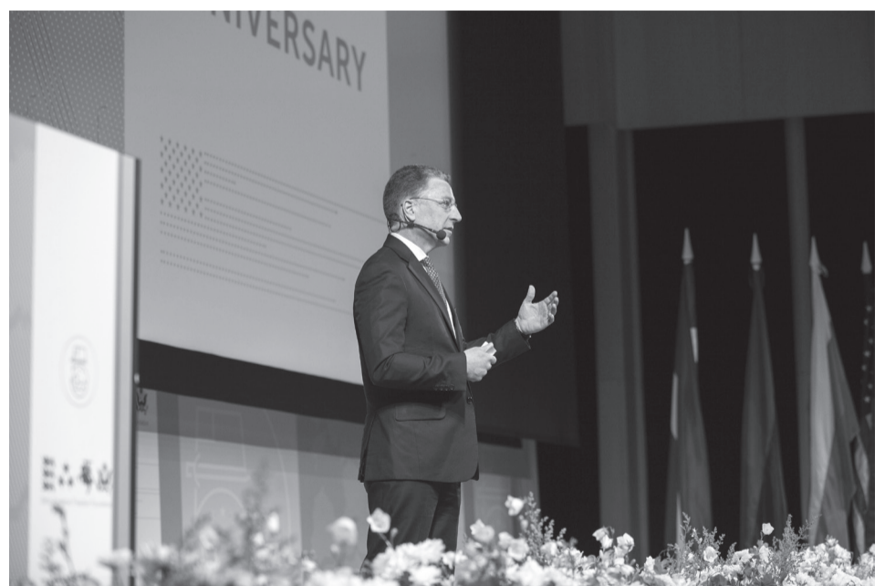
Ambasadorius Kurtas Volkeris

Ambasadorius Kurtas Volkeris yra pagrindinis JAV užsienio ir nacionalinio saugumo politikos ekspertas, turintis apie 30-ties metų patirtį valdžios, akademinio ir privataus sektorių pajėgumų srityje. Jis yra Vašingtone įsikūrusio Arizonos valstijos universiteto McCaino tarptautinės lyderystės instituto vykdomasis direktorius. Be to, jis yra Džono Hopkinso ( John Hopkins ) universiteto Pažangiųjų tarptautinių studijų mokyklos Transatlantinių santykių centro