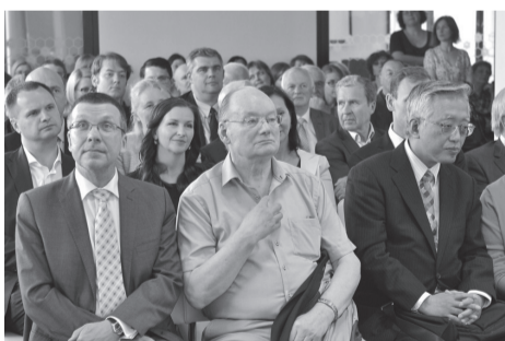
Bičiulių sodo atidarymo šventė Mykolo Romerio universitete.