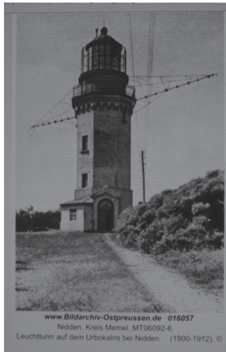
016057 Nidden, Kreis Memel, MT06092-6 Leuchtturm auf dem Urbokains bei Nidden. (1900-1912).

Senamiestyje, Muziejaus ir Santakos gatvėse, išlikęs išpūdingas senojo Kauno upių ir jūrų uosto reliktas – senasis, valstybės saugomas Dviejų sandėlių kompleksas (UK-822) dar buvo vadinamas Hanzos sandėliais.