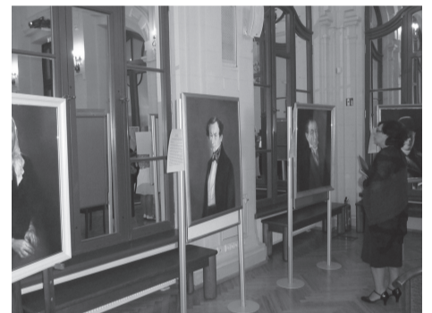
Iškilių krašto asmenybių portretų paroda Lietuvos mokslų akademijoje