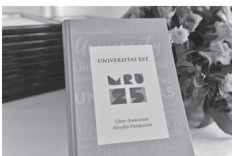
Universiteto 25-mečiui skirtas leidinys, įvardijantis jo kūrėją ir ilgametį rektorių

Nuo šiol žydinčiomis sakuroms vilniečiai ir sostinės svečiai galės grožėtis ne tik prie Baltojo tilto. Joninių išvakarėse Didlaukio gatvėje prie Mykolo Romerio universiteto Socialinių inovacijų laboratorijų centro iškilmingai atidarytas Bičiulių sodas. Šiemet Mykolo Romerio universitetas mini įkūrimo 25-metį. Bičiulių sodo atidarymas – vienas iš universiteto įkūrimui paminėti skirtų renginių.