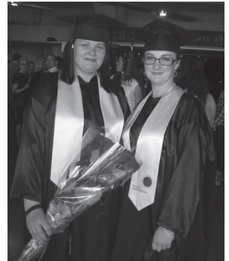
Regioninio universiteto absolventės.