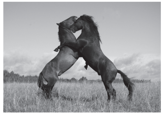
Eržilų žemaitukų kova.