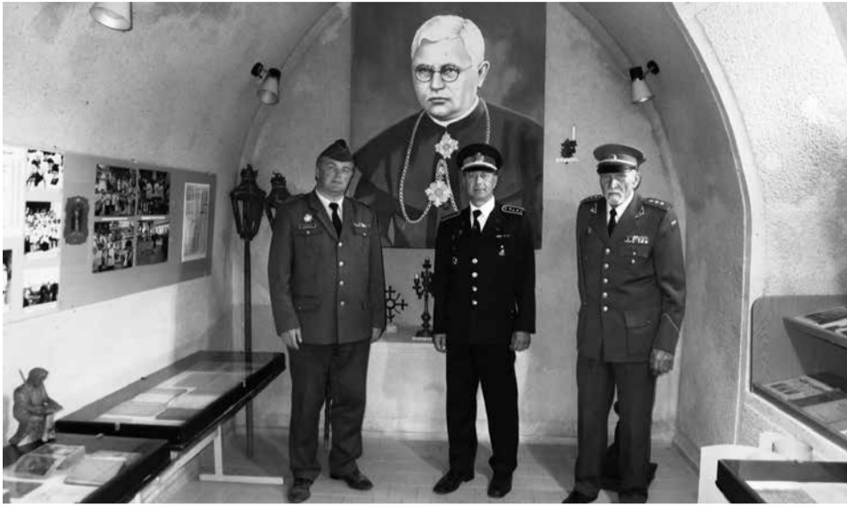
Kulių krašto muziejuje.