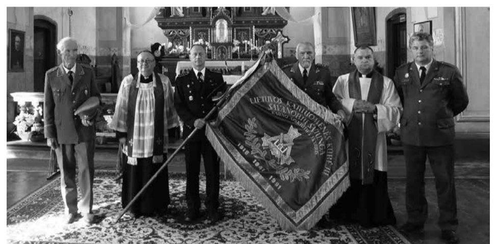
Lietuvos kariuomenės kūrėjų savanorių sąjungos vėliava bažnyčioje

Kulių seniūnija yra Plungės rajono pietvakarinėje dalyje. Ji ribojasi su Nausodžio ir Stalgėnų seniūnijomis, Rietavo, Klaipėdos ir Kretingos rajonais. Seniūnijoje (2017 m. duomenimis) buvo apytiksliai 1150 gyventojų. Kuliai – didžiausia seniūnijos gyvenvietė, pirmą kartą paminėta 1253 m., priklausiusi