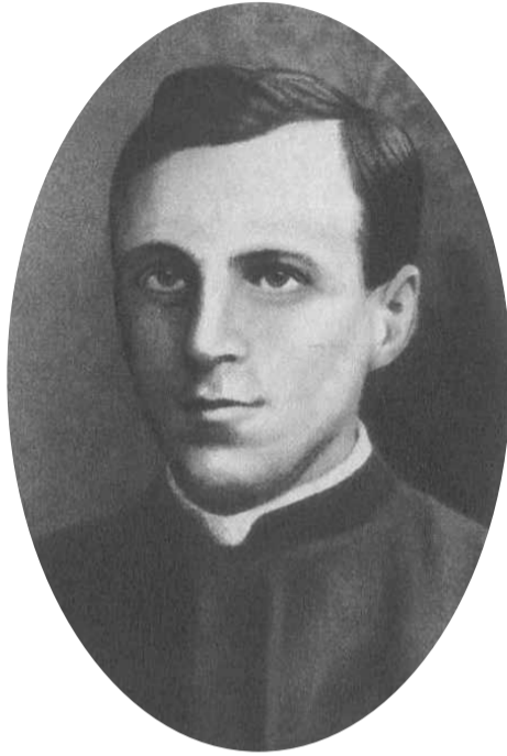
Aleksandras Dambrauskas studijų metais Peterburgo dvasinėje akademijoje

1872–1880 m. mokėsi Šiaulių gimnazijoje, 1880–1881 m. studijavo Peterburgo universiteto Matematikos-gamtos fakultete, nuo 1881 m. pradėjo studijuoti kunigų seminarijoje Kaune. Dėl savo neeilinių gabumų 1884 m. buvo išsiųstas tęsti mokslų į Peterburgo dvasinę akademiją. 1888 m. įšventintas kunigu. 1900–1905 m. Aleksandras Dambrauskas jau dirbo šios akademijos profesoriumi.