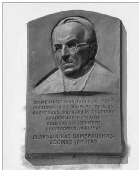
Memorialinė lenta Adomui Jakštui Kaune, Rotušės a. 23

Aleksandras Dambrauskas-Adomas Jakštas kartu su kitais dviem jo amžininkais, Lietuvos kunigais Jonu Mačiuliu-Maironiu ir Juozu Tumu-Vaižgantu visiems laikams yra įrašytas į Lietuvos istoriją. Autorius yra Lietuvos esperantininkų sąjungos Valdybos pirmininkas