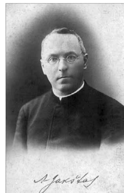
Aleksandras Dambrauskas-Adomas Jakštas – 160-osios gimimo metinės