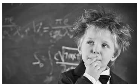
Kaip atpažinti gabų vaiką? Asociatyvi nuotr.

„Gifted“ – atvira mokymosi aplinka, kurioje mokytojai ir dėstytojai padeda vaikams augti intelektualiai ir emociškai. Šiuo metu pradėtos vykdyti septynios specialios programos, skirtos 3 ir 11 klasių gabių vaikų ugdymui. Taip pat organizuojama IQ testavimo metodika, pagal kurią nustatomas vaiko intelekto koeficientas, siekiant parengti