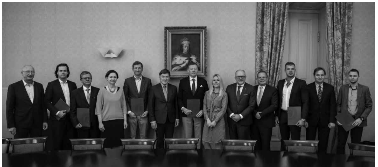
Konsorciumo steigėjai.

Konsorciumas sieks Vidurio ir Vakarų Lietuvos regione paskatinti pramonės, žemės ūkio, maisto ir energetikos sektorių skaitmeninę transformaciją. Nors šiuo metu šiame regione veikia didelė dalis šalies pramonės, tačiau skaitmeninių technologijų teikiamus konkurencinius privalumus išnaudoja nedaug įmonių. Skaitmeninių inovacijų centre bus dalijamasi praktine skaitmeninių technologijų diegimo patirtimi, vykdomi skaitmeninio ir inovaciniai auditai, ku-