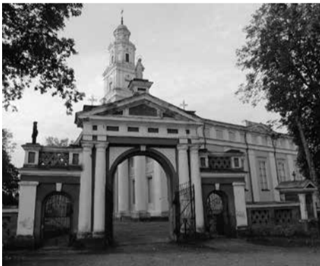
Architektūros paminklas – Kulių Šv. vyskupo Stanislovo bažnyčia

Rugsėjo 26 d. Plungės r. Kulių bendruomenėje įvyko Lietuvos partizanų, jų ryšininkų ir rėmėjų, politinių kalinių ir tremtinių pagerbimo šventė. Šv. vyskupo Stanislovo bažnyčioje Mišias už Lietuvos partizanus ir kitus šioje parapijoje veikusius laisvės kovotojus aukojo kun. Ar-