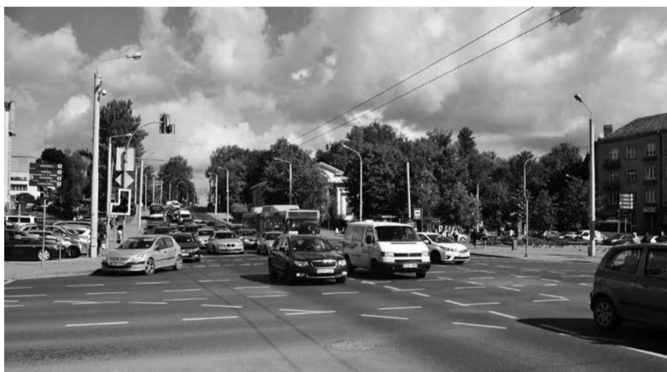
Intensyvus transportas didmiesčiuose.