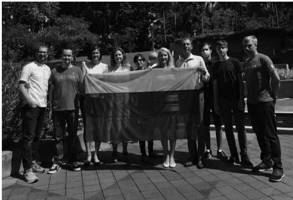
Malaizijos lietuvių bendruomenės atstovai