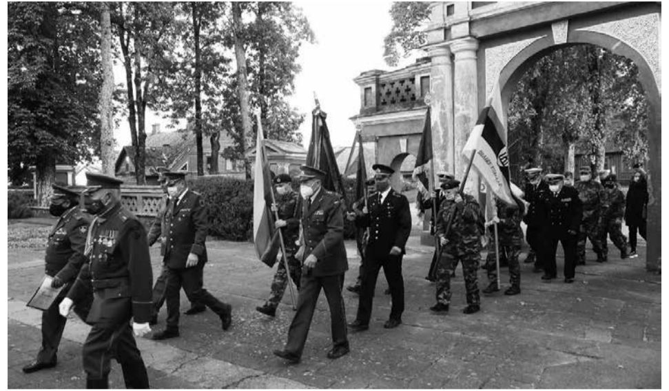
Šaulių ir kitų organizacijų atstovų eiseną