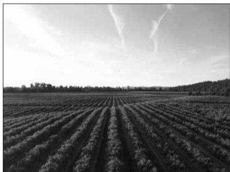
Derlingas laukas.