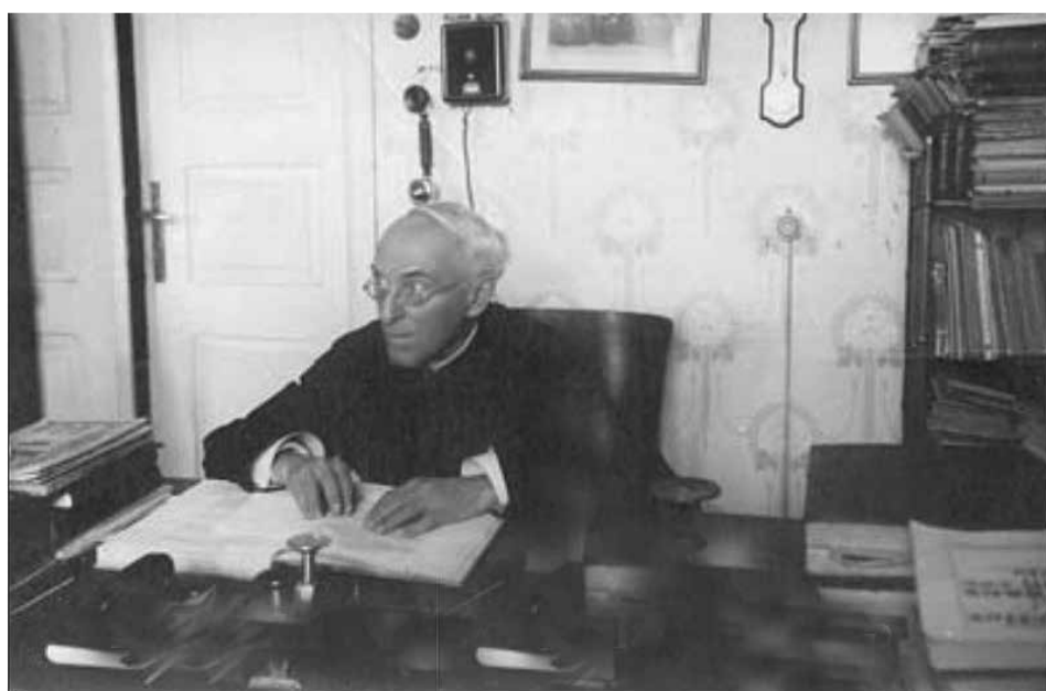
Aleksandras Dambrauskas-Adomas Jakštas darbo kabinete Kaune

1906 m. grįžęs į Kauną, įsteigė Šv. Kazimiero knygų leidimo draugiją. Vėliau įsteigė ir redagavo kelis žurnalus, 1911 m. kartu su kitais įkūrė Ateitininkų organizaciją. Nuo 1914 m. tapo prelatu. Nuo 1922 m. – Lietuvos universiteto Kelių fakultetų garbės daktaras ir profesorius. 1922 m. kartu su