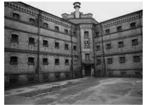
Lukiškių kalėjimo mūrai saugo daug paslapčių

Vyčio kryžiaus ordino kavalerius, Lietuvos sąjūdžio Kauno tarybos pirmininko pavaduotojas