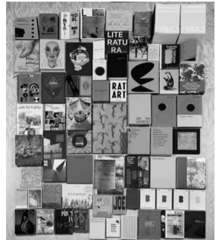
Gražiausios Čekijos 2020 metų knygų