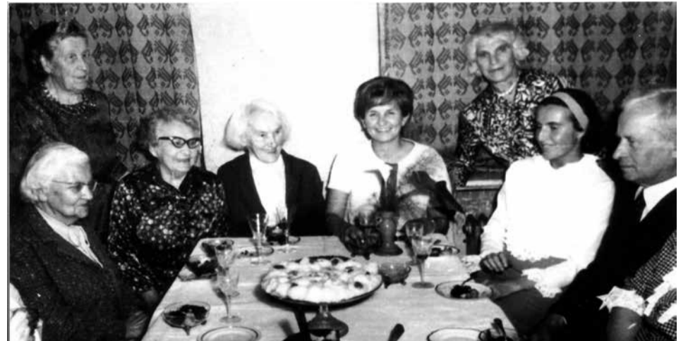
Alseikų namuose lankėsi žymūs to laikmečio žmonės