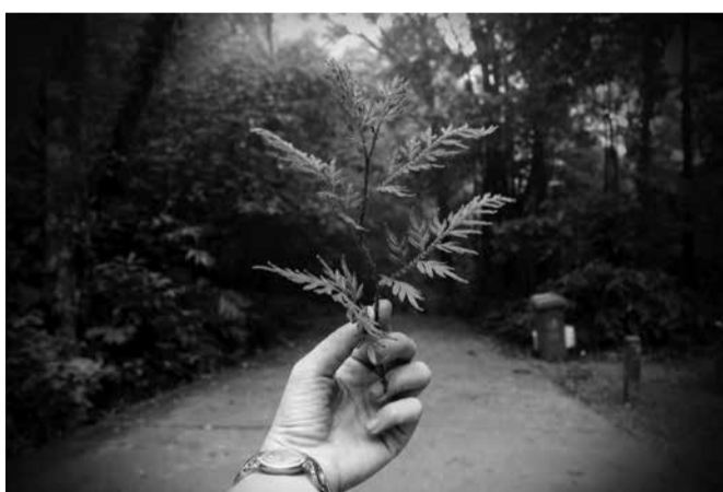
Ekologija.