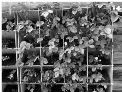
Žemuogių auginimas ant sienos

„Pastaruosiu metu vis dažniau kalbama apie tai, kad, siekiami tvarumo, turėtume kuo labiau stengtis trumpinti maisto tiekimo grandinę – nuo lauko iki stalo. Vertikaloji žemdirbystė leistų vartotojams tiekti šviežius, kokybiškus žalumynus, kurie yra ypač jautrūs transportavimui ir ilgesniam laikymui. Abejočiau, kad vertikalios sistemos artimoje ateityje pakeis horizontalų dirvožemį,