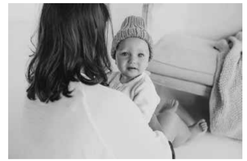
Mama su vaiku. Asoc. nuotrauka yra akivaizdus.

Šiaurės šalys vykdo projektą „Pirmos 1000 dienų Šiaurės šalyse“ ir formuoja politikos rekomendacijas, kaip užtikrinti sveiką gyvenimo pradžią visiems Šiaurės regiono vaikams. Tūkstančio pirmųjų gyvenimo dienų prioritetą akcentuoja Jungtinė Karalystė, Australija, JAV ir kitos šalys. Tuo tarpu Lietuva apie tai nediskutuoja, nors atsilikimas