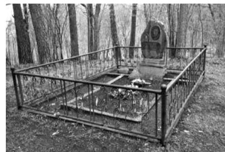
Tragiškai žuvusio poeto Vytauto Mačernio kapas