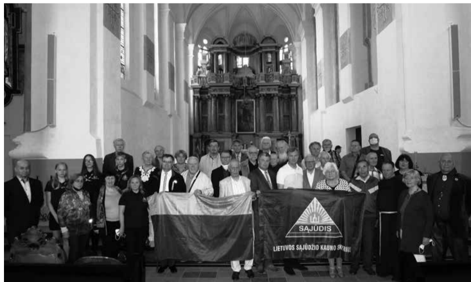
Bendroje nuotraukoje – Sąjūdžio minėjimo Kaune dalyviai