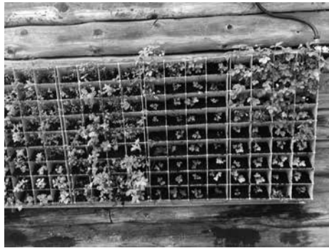
Vertikaloji žemdirbystė. Daržovės auga ant išorinių ir vidinių sienų

tačiau tai yra alternatyva rinktis“, – dėsto pašnekovė, atkreipianti dėmesį, kad vertikalios sistemos yra itin patogios, nes, imant derlių, žmogui nereikia lankstyti. Be to, nei uogos, nei prieskoniniai niekada nebūna žemėti, liūtys priplakti prie grunto.