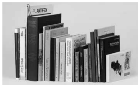
Gražiausios Lietuvos 2020 metų knygų

Paroda veiks iki liepos 11 d. Ją rengia Lietuvos nacionalinio muziejaus Kazio Varnelio namai-muziejus, Lietuvos Respublikos kultūros ministerija, Čekijos Respublikos ambasada Vilniuje ir „Knygų šalis“. Autorius yra Lietuvos nacionalinio muziejaus viešųjų ryšių specialistas