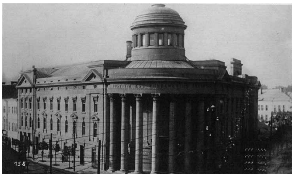
Teisingumo ministerijos rūmai Kaune (1929). Žr. 3 p.

Kvietimo autorė yra Lietuvos sociologų draugijos prezidentė