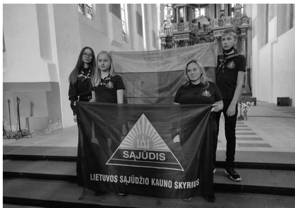
Baltijos jūrų skautai