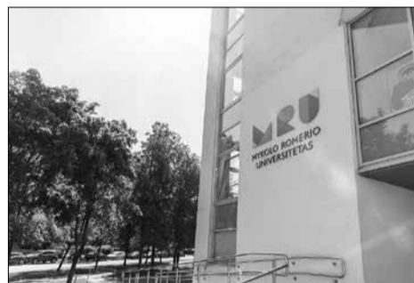
Mykolo Romerio universitetas