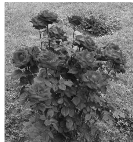
Pražydusi vasara kviečia atostogauti.