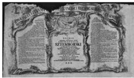
Pranciškonų spaustuvės leidinys.

naudojo dirbdamas Drohičine ir Zamoscyeje. Grįžęs į Vilnių, išrūpino spaustuvei Lenkijos karaliaus ir Lietuvos didžiojo kunigaikščio Mykolo Kaributo Višnioveckio privilegiją (ji patvirtinta 1670 m.). Iš viso per savo veiklos laikotarpį (1671–1781, su pertraukomis) Vilniaus pranciškonai išleido daugiau kaip 160 leidinių, iš jų lietuvių kalba – 13. Tai buvo religinė literatūra (maldų knygos, apeigynai, regulos ir pan.), teologijos knygos, proginės (laidotuvių pamokslai, panegirikos) ir originaliosios literatūros veikalai. Vienas tokių – itin populiarus Džono Barklajaus ( John Barclay , 1582–1621) eiliuotas herojinis epas „Argenidė“ (1756), vien XVII a. lotynų kalba perleistas 30 kartų, išverstas į daugelį kitų kalbų ir XVIII a. skaitytas LDK skaitytojų, dažnai cituotas to meto proginėje literatūroje.