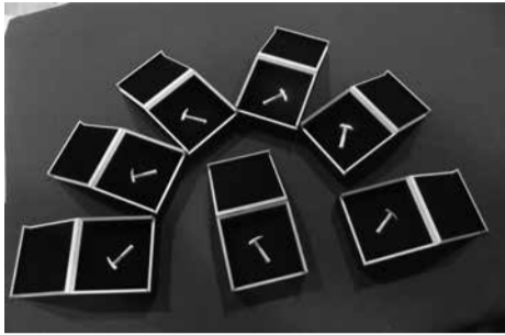
Profesinio pasižymėjimo garbės ženklų „Aukso geologo plaktukas“ 2020 metų kolekcija