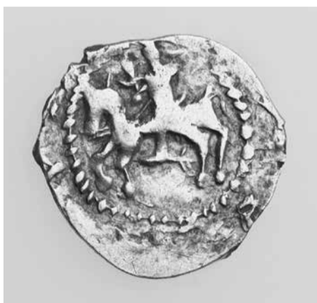
Jogailos denaras 1388 m.

Tiriamas lobi radimo vietą, aptikti 62 vienas komplektui priskirtini daiktai, datuojami XIV a. pabaiga. Tarp monetų – du Prahos grašiai, kaldinti valdant Jonui I Liuksemburgiečiui (1310–1346), šeši Karolio I (IV) (1346–1378), devyni Vaclovo IV (1378–1419), viena neidentifikuoto valdovo Prahos grašio klastotė. Iš Lietuvos Didžiosios Kunigaikštystės denarų – 40 kaldinti, valdant Jogailai (1377–1392), beveik visos monetos – apie 1388–1390 m. Trys monetos yra ankstyvesnės. Tai – portretinė, datuojama apie 1386–1387 m., ir dvi monetos