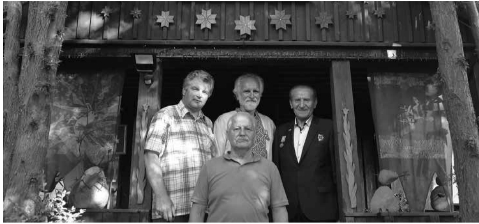
Lietuvai pagražinti draugijos atstovų susitikimas Juškų muziejuje