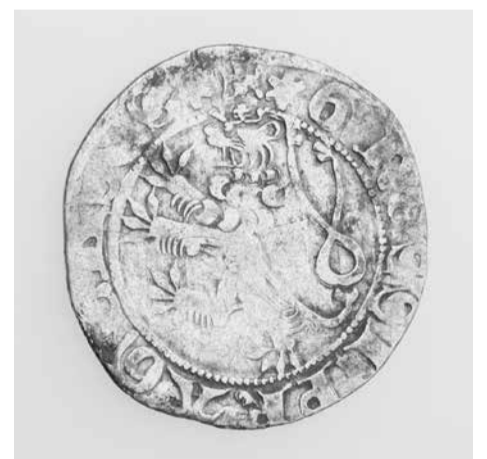
Jono I Liuksemburgiečio (1310–1346) laikų Prahos grašis – seniausia šio lobi moneta

„Per beveik mėnesį trukusius archeologinius tyrimus ekspedicijos komanda nuodugniai ištyrė 234 kv. m plotą ir kruopščiai išžvalgė net 5370 kv. m dydžio teritoriją. Būtent archeologiniai tyrimai leido nustatyti, kad visi radiniai yra ne paskiri, o to paties lobi dalis. Teritorijoje taip pat aptikta nemažai tuo pačiu laikotarpiu datuojamų buitinių keramikos šukių, molio tinko fragmentų, du geležiniai peiliukai ir keletas kitų smulkių pamestų arba išmestų dirbinių“, – teigia muziejaus archeologas