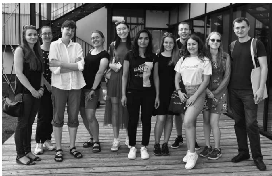
VDU studentai.