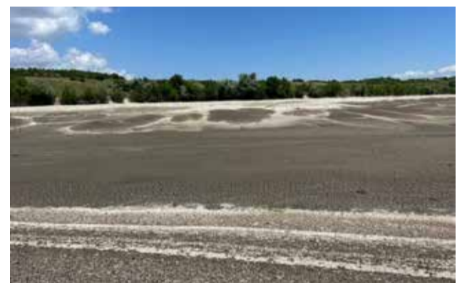
Tai, kas liko iš Kamianska Sich nacionalinio gamtos parko