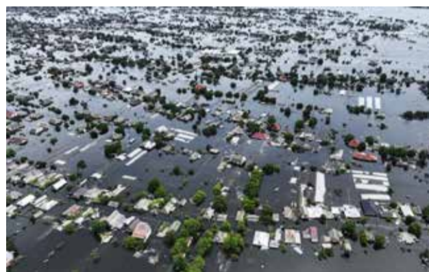
Užtvindytas Oleshki miestas Chersono srities kairiajame krante