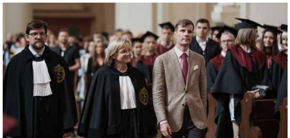
Diplomų įteikimo šventė Vilniaus universiteto Ekonomikos ir verslo administravimo fakultete