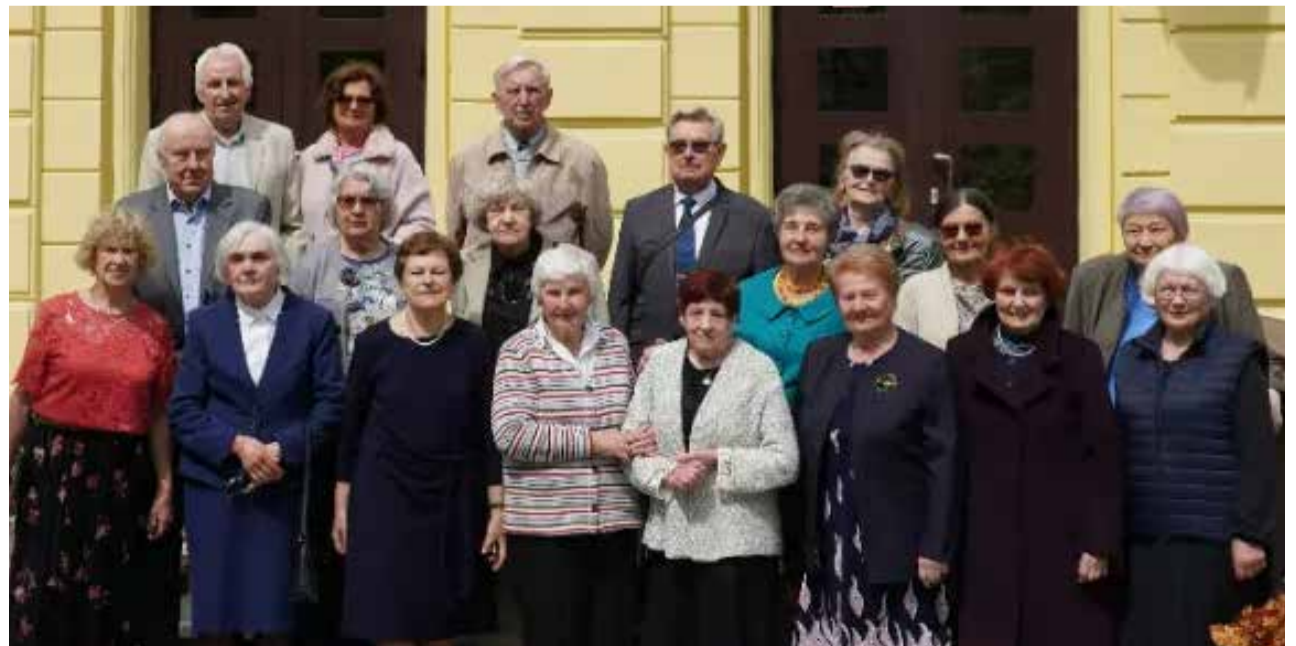
Šiaulių Juliaus Janonio vidurinės mokyklos 107-osios laidos abiturientų susitikimas.