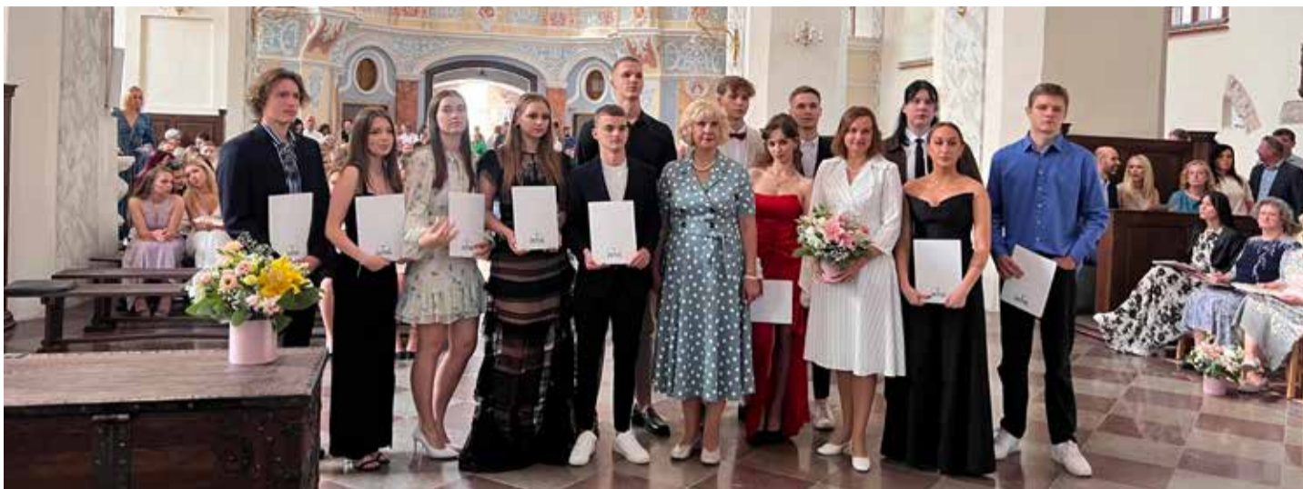
Vilniaus Žvėryno gimnazijos 12-osios „C“ klasės abiturientai.