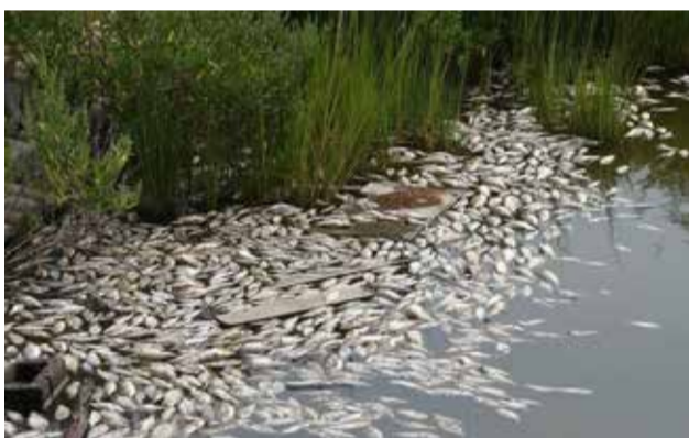
Masinė žuvų žūtis Dniepre

Lietuvos mokslininkų sąjunga teikia pastovią paramą Ukrainos mokslininkams