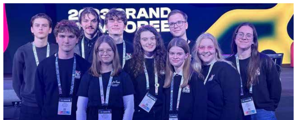
Vilniaus universiteto komanda sintetinės biologijos konkurse

Vilniaus universiteto komanda savo projekte siekė sukurti biologinę sistemą, sintetinančią praturtintas bakterinės celiuliozės pagrindo medžiagas. Sukurtos trys veikiančios sistemos, kurios sintetina bakterinės celiuliozės ir chitozano medžiagą, palengvinančią bakterinės celiuliozės pritaikymą biomedicinoje. Tai leidžia gauti spalvotą celiuliozės ir biologiškai skaidžią plastiko alternatyvą,