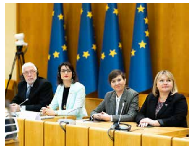
Seime prasidėjo Pasaulio lietuvių bendruomenės ir Seimo komisijos posėdžiai

Suskystintų gamtinių dujų laivo-saugyklos „Independence“ įgulos sudarymas. Seimo Jūrinių reikalų komisija lapkričio 8 d. posėdį skyrė aptarti suskystintų gamtinių dujų laivo-saugyklos įgulos sudarymą, kai laivą 2024 m. antroje pusėje valdyti perims Lietuva. Primename, kad nuo 2025 m., kai Lietuva perims nuosavybės teise valdyti laivą-saugyklą „Independence“, jis bus registruotas Lietuvos Respublikos jūrų laivų registre ir plaukios su Lietuvos vėliava. Jūrinių sąjunga, Jūrų kapitonų asociacija, Jūrinių įdarbinimo įmonių asociacija ir Jūreivystės akademija Komisijai raštu išreiškė susirūpinimą dėl tokio tipo laivų įgulos formavimo iš Lietuvos jūrinių ir jūrinių rengimo Lietuvoje. ■