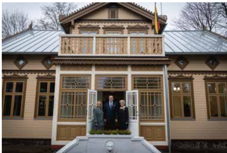
Jono Šliūpo muziejus po kapitalinio remonto.

Remonto darbai buvo finansuoti iš Europos Sąjungos struktūrinių fondų, Klimato