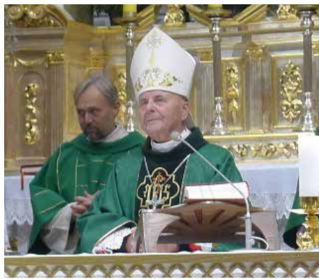
Kardinolas Sigitas Tamkevičius SJ aukojo Padėkos šv. Mišias Kauno arkikatedroje bazilikoje.