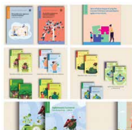
Metodinių leidinių rinkinys

Tvarumui nagrinėti skirtų metodinių priemonių iki šiol trūko, todėl 37 naujos knygos apims svarbias temas ir padės jas įtraukti pagal programas į dalykų turinį bei įvairią neformalią veiklą. Tvarumas šiose metodinėse priemonėse ne tik siejamas su ekologinėmis problemomis, bet ir apima kur kas platesnę reikšmę, problemas ir jų sprendimo būdus.