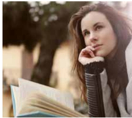
O kas esu aš? Asoc. nuotr.

Pažinti save ar savąjį „Aš“ nėra paprasta,