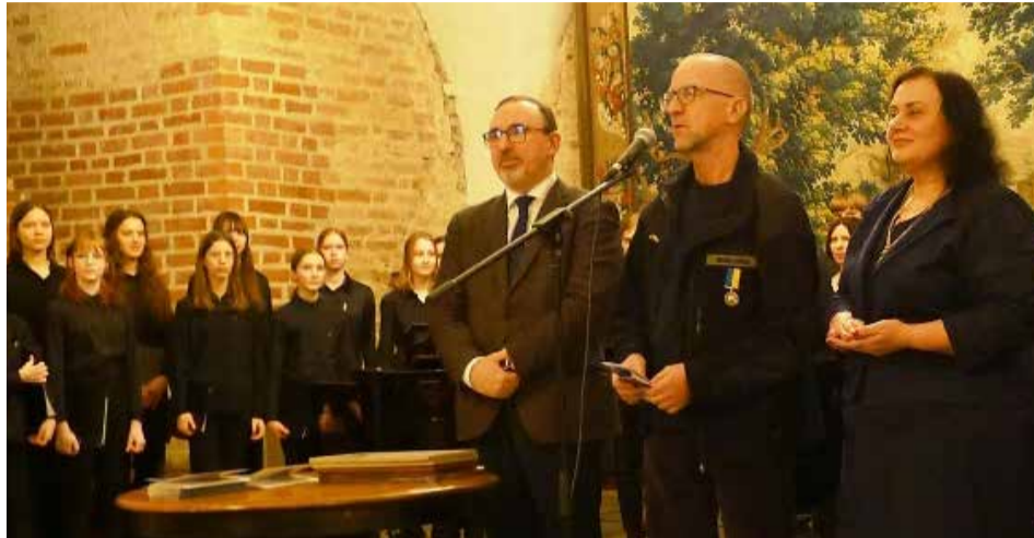
Ukrainos sakralinio meno parodos atidaryme.

Pasak parodos rengėjų, būtent ikonose geriausiai įkūnyta Ukrainos žmonių tautinio