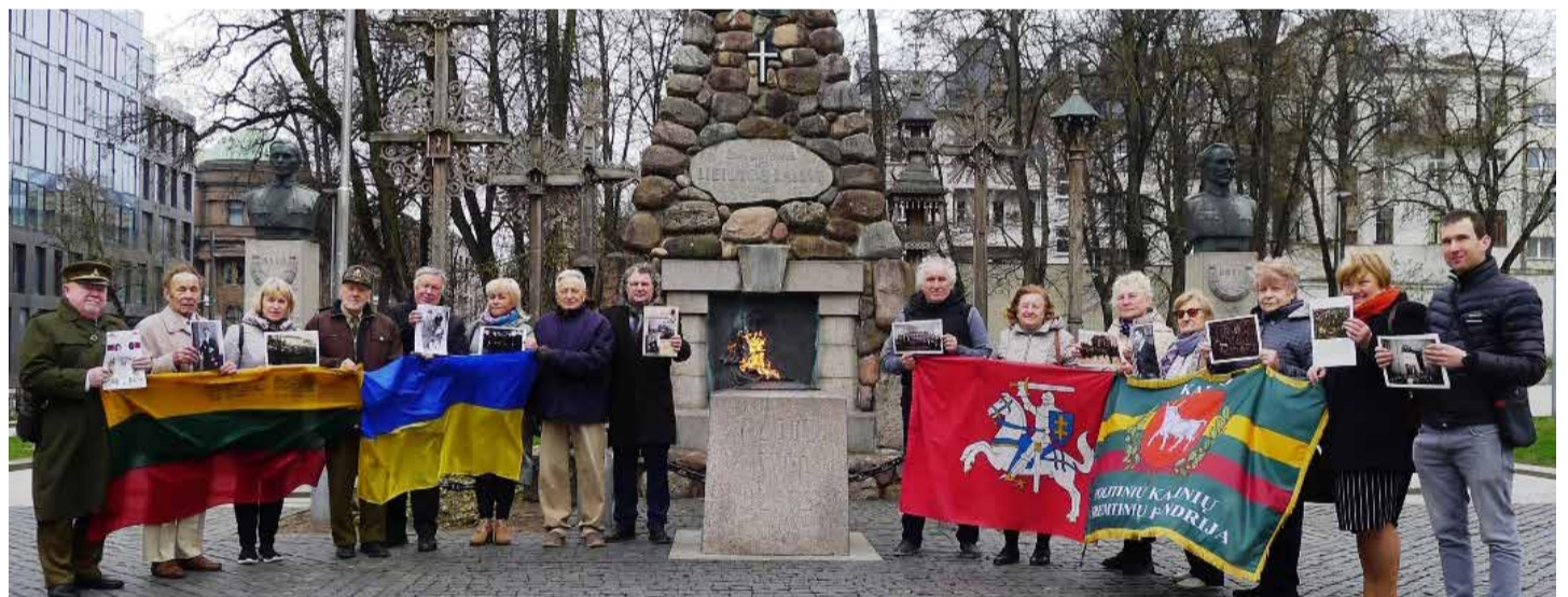
Prie Nežinomo kareivio kapo Vytauto Didžiojo karo muziejaus sodelyje.