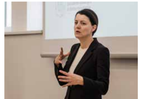
Ministrė Monika Navickienė susitikime su VDU studentais.

Numatoma plėsti socialinių paslaugų teikėjų ratą. Tikimasi, kad jau nuo kitų metų laikinas atokvėpis taps nemokama ir atskira specialiąja socialine paslauga, o socialines paslaugas galės teikti ir fiziniai asmenys. Bus nustatytas aiškesnis socialinės globos įstaigų licencijavimas ir akreditavimas, patikslinti socialinių paslaugų kokybės reikalavimai. ■