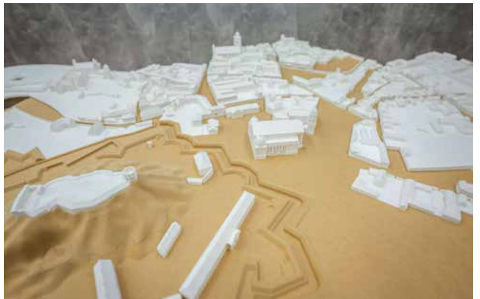
Atkurto XIX a. Vilniaus miesto maketo fragmentas.

Atkurtas maketas bus pats tiksliausias mūsų dienas pasiekęs liudijimas apie tai, kaip Vilnius atrodė prieš 200 metų, ir parodys miesto, kaip gyvo organizmo, visumą: miesto topografiją, viso senamiesčio užstatymą. Interaktyvūs sprendimai makete leis vizualizuoti demografinio, socialinio-kultūrinio konteksto pokyčius po 1794 ir 1831 m. sukilimų, atkurti įvairias kasdienybės istorijas,