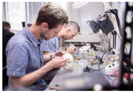
Dalyvavimas Europos universitetų ATHENA iniciatyvoje. Asoc. nuotrauka

„Jau galima matyti „Co-Creation Hub“ iniciatyvos pavyzdžius, tokius kaip aljanso narių dalyvavimas žiemos ir vasaros mokyklose, kurias organizuoja VILNIUS TECH „LinkMenų fabrikas“. Šie renginiai sutei-