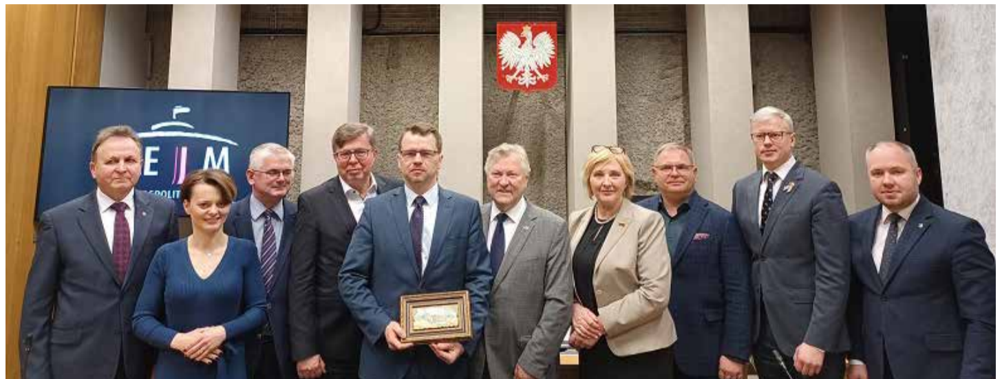
Lenkijos ir Lietuvos parlamentarų susitikimas. Lietuvos ambasados Lenkijoje nuotr.

Aptartos skirtingos verslo veiklos Lenkijoje formos (Lenkijai būdinga jų gausa) ir kt. Lenkijos parlamentarai taip pat kalbėjo apie lengvatas, taikomas inovacinėms įmonėms, sukuriančioms apie 1,24 proc. Lenkijos BVP. Jie pasidžiaugė, kad Lenkijos BVP per pastutinius aštuonerius metus padvigubėjo. „Lenkija laikytina smulkiojo ir vidutinio verslo sisteminio rėmimo lydere Europoje. Nepakankamai efektyvi smulkiojo ir vidu-