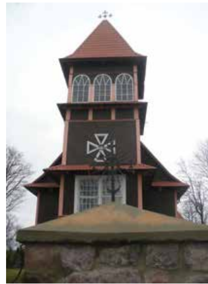
Akmenynės Šv. Kūdikėlio Jėzaus Teresės bažnyčia. Neringos Markauskaitės nuotrauka, 2022

Kaczyński, Hieronim. Akmenynės valdy planas. 1834 m. rugpjūčio 6 d. Fragmentas. LMAVB RS F229-927