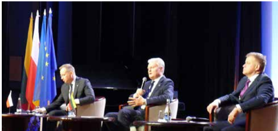
Lietuvos ir Lenkijos Prezidentai VDU forume

Balandžio 26 d. Kaune Vytauto Didžiojo universiteto atkūrimo 35-mečio ir Lietuvos narystės Europos Sąjungoje 20-mečio proga vyko du tarptautiniai forumai. Pirmajame akademikai aptarė universiteto idėjos kaitą, o antrajame apie Europos iššūkius diskutavo visuomenės veikėjai ir politikai, tarp jų – Lietuvos Respublikos Prezidentas Gitanas Nausėda ir Lenkijos Respublikos Prezidentas Andrzej Duda.