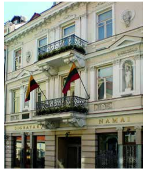
Signatarų namai Vilniuje