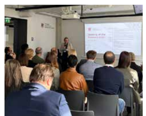
Consumer Decision Making Lab (CDM Lab) ir Vilnius University Lab for Behavioural Economics (VU LABBE) laboratorijų atidarymas.