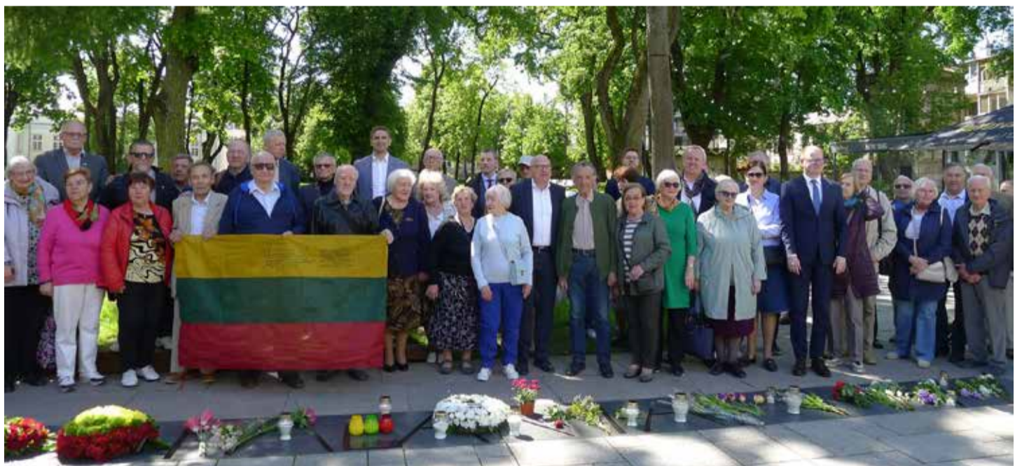
Romo Kalantos žūties 52-ųjų metų minėjimo dalyviai.

G egužės 14 d. Kaune, Laisvės alėjoje, netoli Valstybinio muzikinio teatro prie Romo Kalantos paminklo visuomeninių organizacijų atstovai paminėjo Pilietinio pasipriešinimo dieną. Prieš 52 metus, protestuodamas prieš sovietų santvarką, susidegino tik 19 metų sulaukęs Romas KALANTA. Prisimename jo žygį ir kančią, kaip ypatingą pasiaukojimą Lietuvos laisvei. Tada Romo laidotuvės (KGB jį slapčia palaidojo anksčiau) sukėlė atvirą jaunimo pasipriešinimą. 1972 m. gegužės 18–19 d. įvyko tūkstantinės jaunimo eitynės ir demonstracijos. Skambėjo šūkiai „Laisvę Lietuvai!“, buvo platinami atsišaukimai „Tegyvuoja nepriklausoma Lietuva!“ Sovietų milicija, sovietinis komunistų aktyvas nesugebėjo sulaukti ir išsklaidyti didžiulės minios. Tik pasitelkus ginkluotus sovietų desantininkų būrius, demonstracijas pavyko nuslopinti.