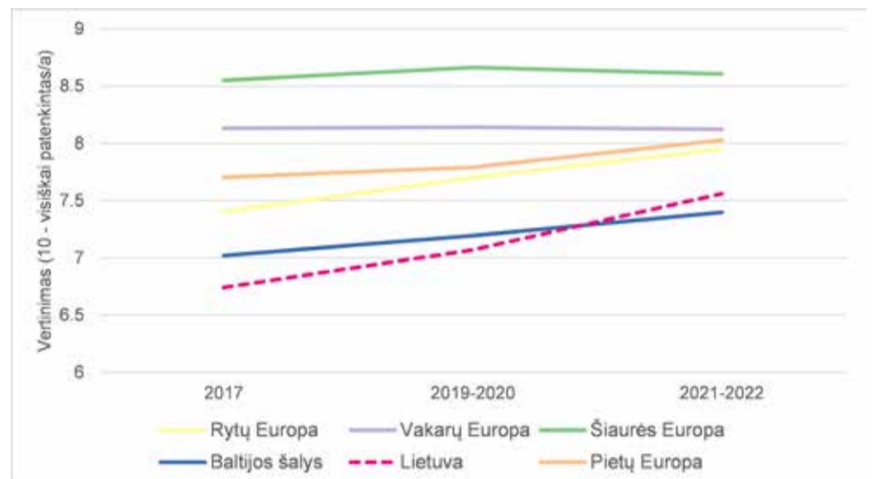
2 pav. Namų ūkių Lietuvoje atsakymai apie tai, kaip sekėsi įveikti finansinius sunkumus 2017–2022 m.

Tyrimo rezultatai rodo ir vyresnio amžiaus asmenų finansinės padėties gerėjimą. Per penkerius metus vidutinės Lietuvos namų ūkio, kuriame gyvena 65 m. ir vyresnis tyrimo dalyvis, pajamos vienam asmeniui išaugo nuo 275 eurų (2017) iki 412,5 euro (2021–2022). Tačiau jos dar labai atsilieka nuo vidutinio tyrimo dalyvavusio euro zonos namų ūkio, kur 2021–2022 m. vidutinės pa-