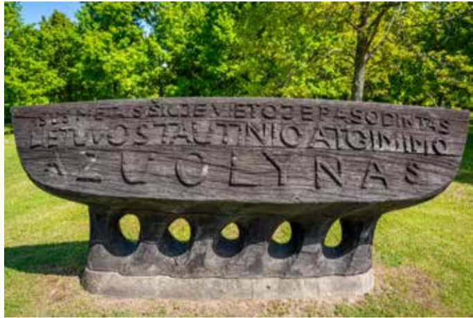
Lietuvos tautinio atgimimo ąžuolynas.

Festivalio svečiai galės pirmieji išbandyti naują interaktyvų gilinukų namelių maršrutą ąžuolyne, kuris ypač patiks mažiesiems. Mistikos mėgėjai galės rinktis naktinę ekskursiją ąžuolyne. Lankytojai turės išskirtinę progą dalyvauti naujo dokumentinio filmo „Ožkabalių ąžuolynas“ peržiūrose ir pabendrauti su filmo kūrėjais. Šiuo metu šį apie ąžuolyno istoriją pasakojantį filmą galima pamatyti tik Jono Basanavičiaus gimtiniame įrengtame kino paviljone.