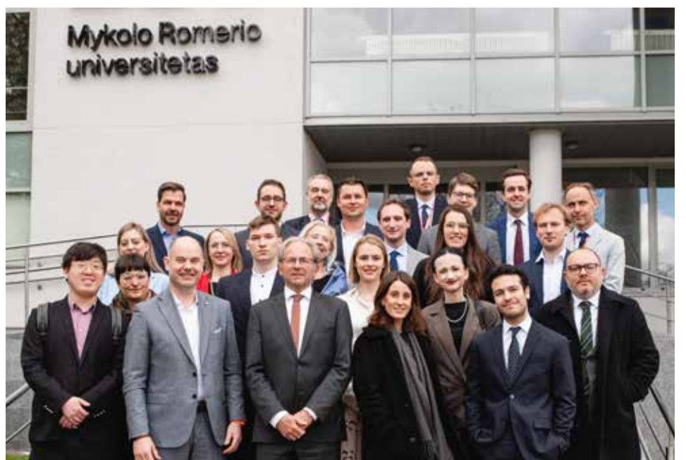
Tarptautinės CERIL konferencijos dalyviai.