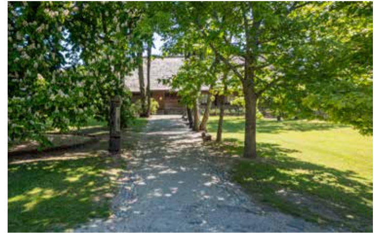
Lietuvos nacionalinio muziejaus padalinys – Jono Basanavičiaus gimtinė

saugi ir žmonėms, turintiems alergiją bitėms. Šventės rengėjai pakvies lankytojus dalyvauti linksmuose švietėjiškuose užsiėmimuose. Norintys galės pasivaržyti stalo žaidimo „Kalbantys ąžuolai“ turnyre. Smagurių lauks gimtiniame gaminamos gilių kavos degustacijos. Svečiai bus kviečiami į diskusiją