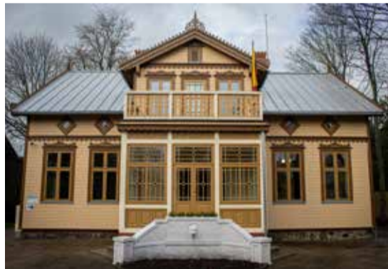
Jono Šliūpo muziejus Palangoje.

Parodoje linksmai ir nesistengiant gražinti tikrovės, atskleidžiamas dr. J. Šliūpo – Lietuvos politikos, visuomenės, kultūros veikėjo, filosofo, aušrininko, gydytojo – gyvenimas, idėjos ir darbai. Pristatomas ne visada „patogus“ J. Šliūpas, atkreipiamas dėmesys į jo veiklos progresyvumą anuomet