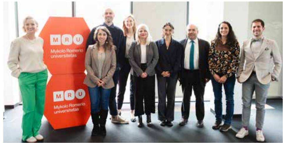
Seminaro dalyviai Mykolo Romerio universitete.

Gegužės 6–7 d. MRU vykęs renginys yra dalis projekto „Mnemoninė realybė: Atminties įstatymų poveikio tikrovei ir tikrovės poveikio atminties įstatymams tyrimas“ (angl. Mnemonic Reality: Investigating Memory