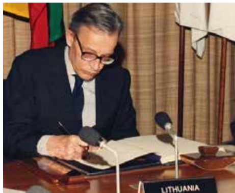
Vilties Prezidentas Stasys Lozoraitis Jr.

Paroda neatsitiktinai eksponuojama Signatarų namuose-muziejuje, kuris yra modernios Lietuvos valstybės simbolis, apmąstantis laisvės idėją. Lozoraičių šeima iš kartos į kartą gyveno valstybės idėją, savo