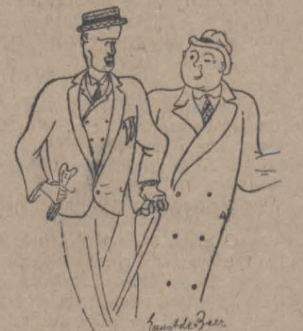
— Powiadam ci, byzyna ta nowa moda noszenia przez kobiety krótkich włosów. Otdąd żona na mojem ubraniu nie znajduje ani jednej szpilki od włosów.

WARSZAWA, 22.VI. (Pat.) — Dolar 5,18 i pół — 5,20 — 5,17, Holandia 208,75 — 209,25 — 208,25, Szwajcaria 101, Londyn 25,22, 1/2, Nowy York 5,18 1/2, Paryż 24,22 1/2, Praga 15,43 i pół, Wiedeń 78,19, Włochy 19,55, 5% -owa pożyczka konwersyjna 46; 8% -wa 71, dolarowa pożyczka 64 — (w złotych 338,18 i 5/8), kolejowa 90 — 85—90, 4 i pół % -owe listy zastawne ziemskie przedwojenne 20,75 — 21,15, 6% -owe warszawskie przedwojenne 18,50 — 18,75.