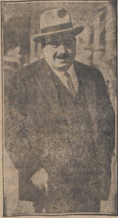
Trzecia komisja Ligi Narodów, zajmująca się sprawą rozbrojenia, rozpatrywała propozycje p. Quinona de Leon, który, jak wiadomo, ustalił w 1924 r. trzy zasady protokołu bezpieczeństwa.