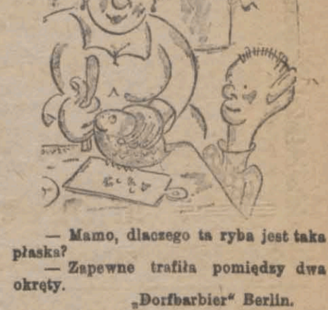
— Mam, dlaczego ta ryba jest taka plaska?