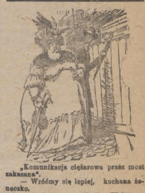
„Komunikacja cietarowa przez most zakazana“.