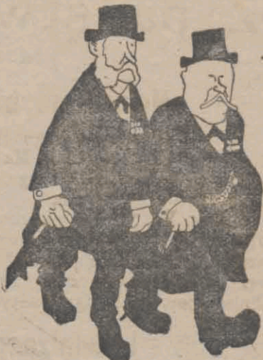
Stypa była smakowita, szkoda tylko, że smarła zimą, o ilej lepiej smakuje w lato.