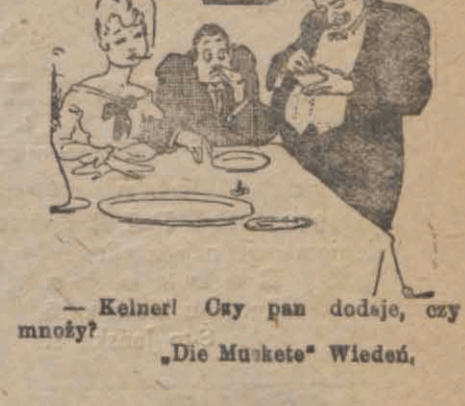
— Keiner! Ozy pan dodaje, czy mnozy?