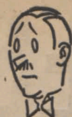
? ? ? ...