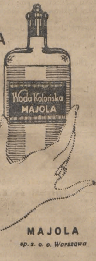
MAJOLA sp. z o. o. Warszawa