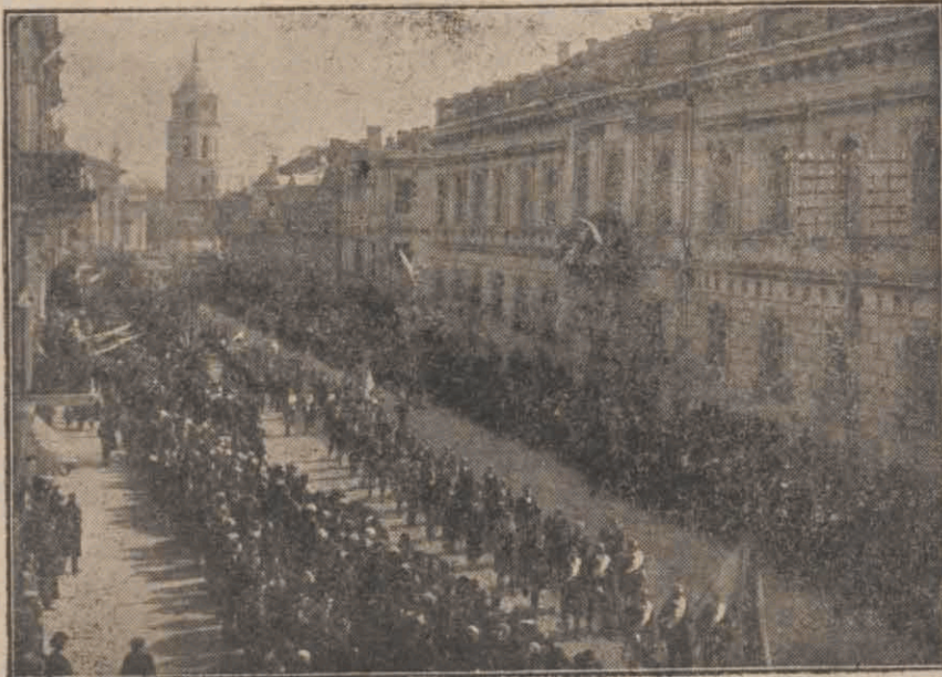
Konwent Polonia w pochodzie 3 maja 1927 r. na ul. Adama Mickiewicza w Wilnie.