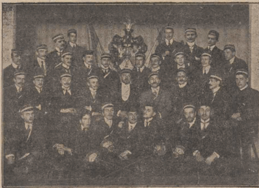
Konwent Polonia w Dorpacie w Sali Rycerskiej.