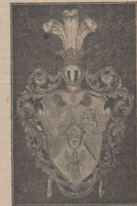
Herb Konwentu Polonia.