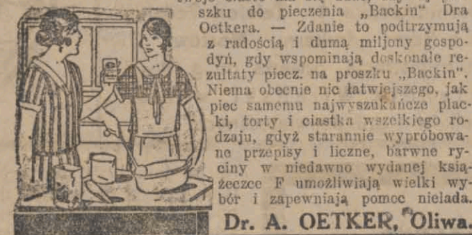
Dr. A. OETKER, „Oliwa.”

nlechnaj przysła pani domu w całej pełni uwzględnia rady, jakie daje jej matka. Ta zaś powtarza stale: Jeżeli twoje ciasto ma się udać, używaj proszku do pieczenia „Backin” Dra Oetkera. — Zdanie to podtrzymują z radością i dumą miliony gospodyń, gdy wspominają doskonale rezultaty pieczenia „Backin”.