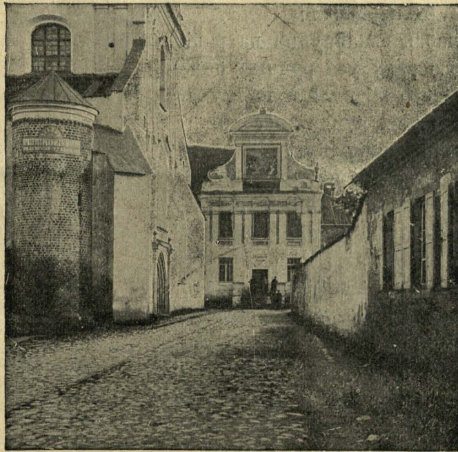
АБРАЗКІ ВІЛЬНІ. Г. зв. Па-Францішканскія мурны на Троцкай вуліцы.