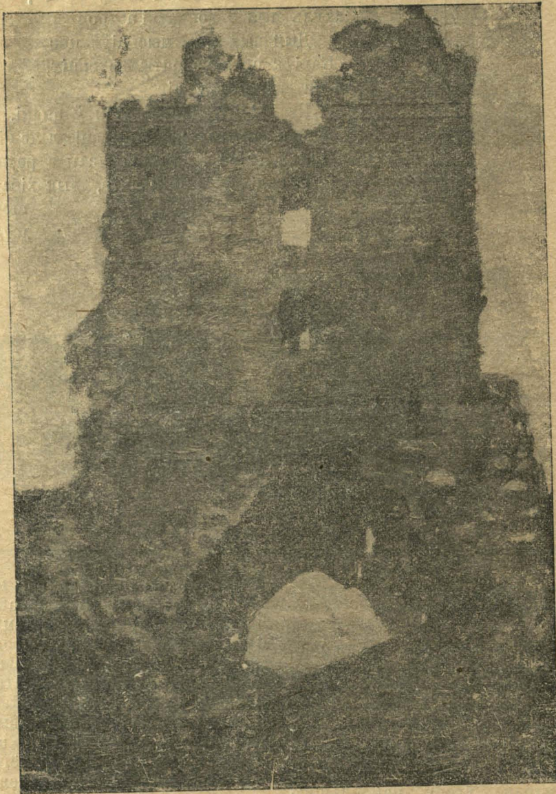
РУІНЫ ЗАМКУ НАВАГРАДЗКАГА.

вільную плазменную сыстэму гаспадаркі, якая павінна складацца так: